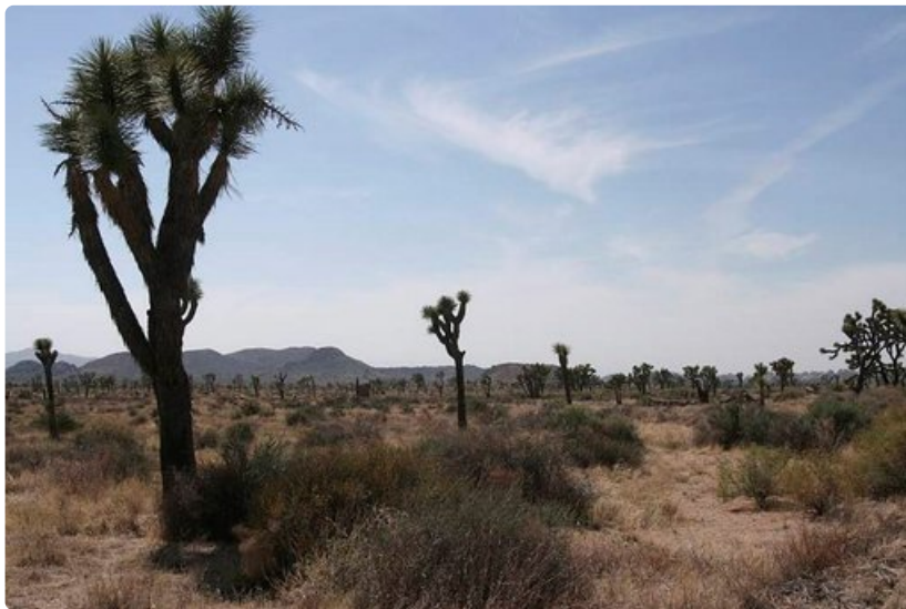
Joshua Treen kansallispuisto on karu mutta monipuolinen kohde.