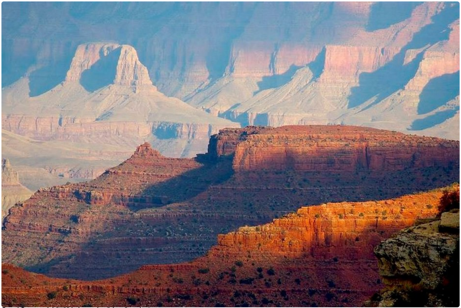
Grand Canyon viehättää kokonsa ja väriensä ansiosta.