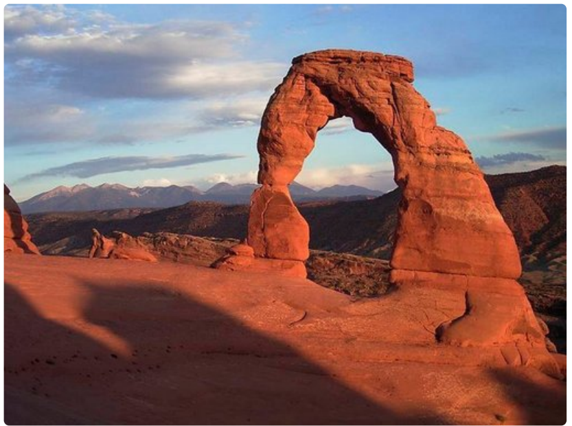
Utahin luonnonsillat ovat kauniita ja valokuvauksellisia.