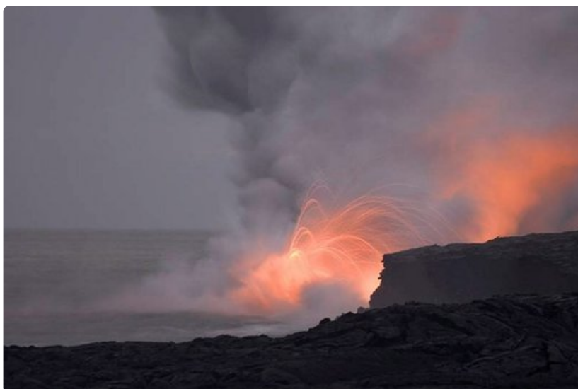
Havaijin laavakentät ovat kuin eri maailmasta.