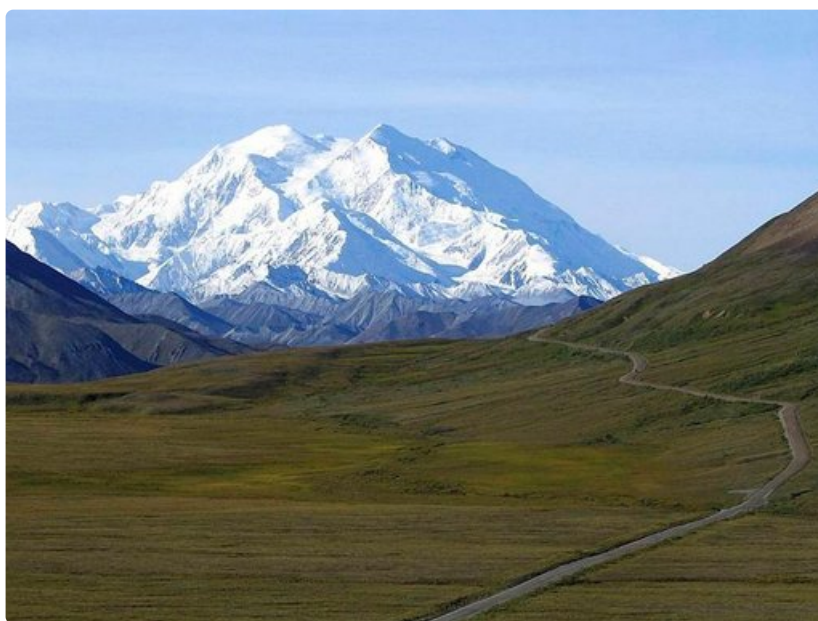
Mount McKinley on Yhdysvaltojen korkein vuori.