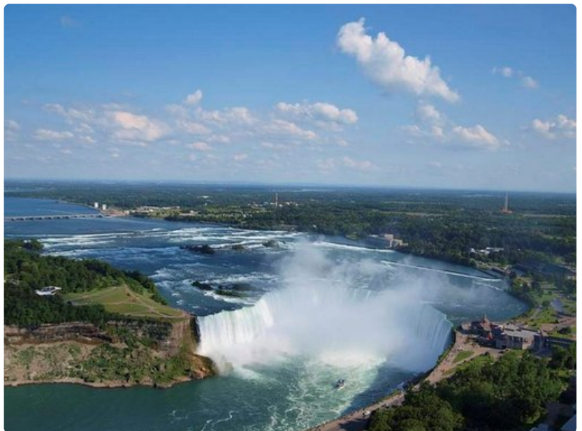
Niagaran putoukset häkellyttävät niin kokonsa kuin voimansa ansiosta.