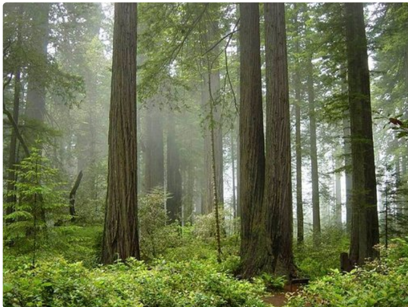
Redwoodin kansallispuisto tarjoaa majesteettisen kokoisia puita.

Mount McKinley sijaitsee Denalin kansallispuistossa Alaskassa. Alueen lähin lentokenttä on Anchorage Ted Stevens International Airport. Luonnonpuistoon järjestetään kesäisin bussiretkiä.