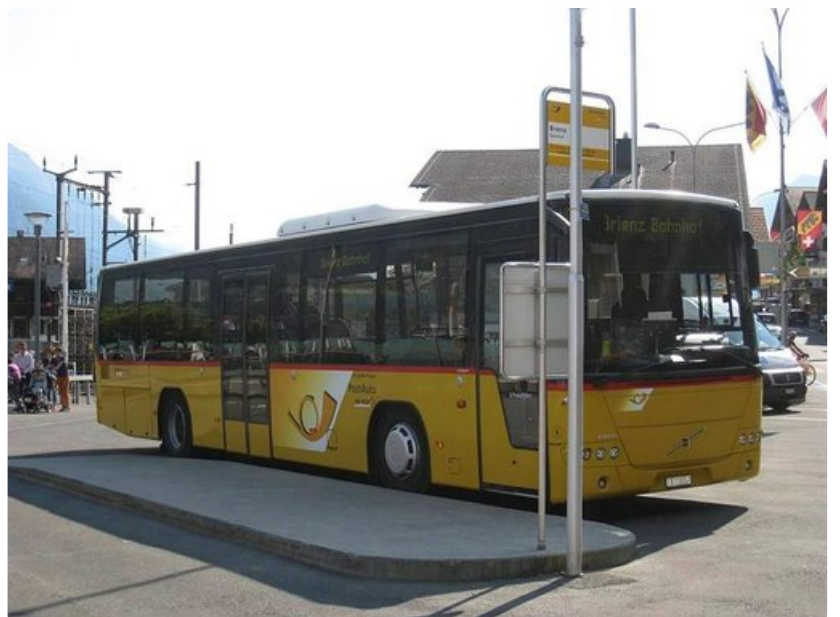
Monipuolista rataverkostoa täydentävät keltaiset Postbus-linja-autot, joilla pääsee syrjäisimpiinkin pikkukyliin.