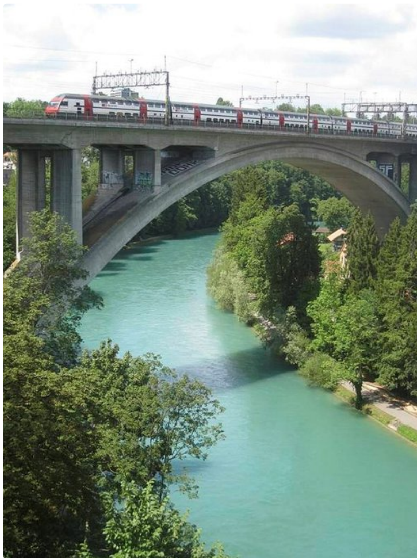
Pääkaupungin Bernin rautatieasemalle saavutaan ylittämällä Aare-joki korkeaa rautatiesiltaa pitkin.