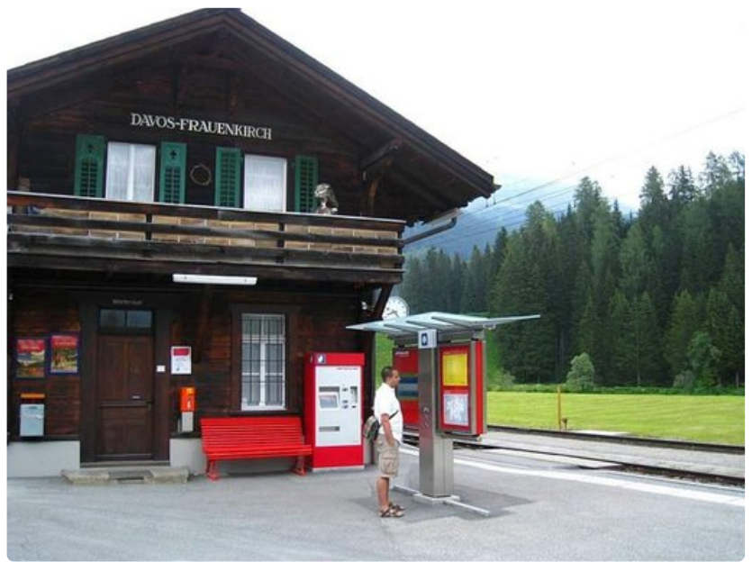
Pienimmillä asemilla paikallisjuna pysäytetään kättä heilauttamalla.