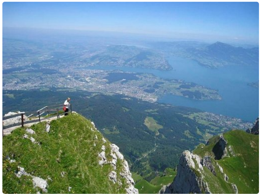
Maaillan jyrkin hammasratasjuna vie turisteja 2132-metrisen Pilatus-vuoren huipulle ihailemaan maisemia.