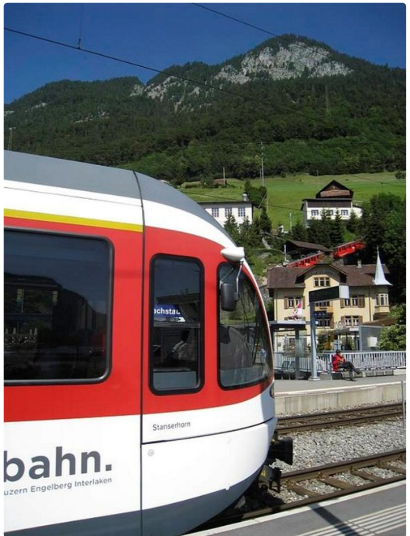
Sveitsissä on yli 5000 kilometrin hyvin hoidettu rautatieverkosto.