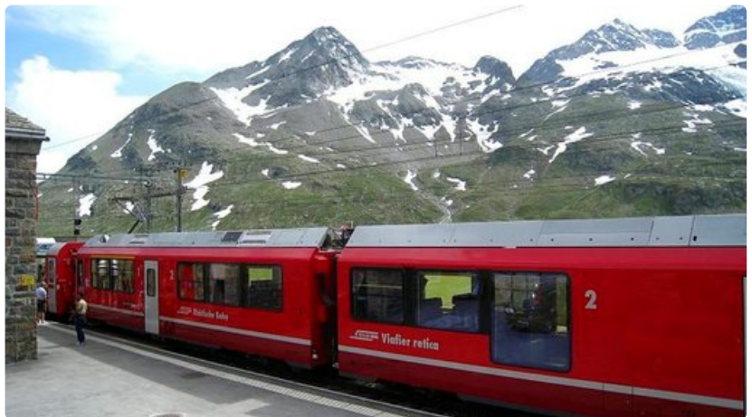
Bernina Express -junalla voi ylittää Alpit matkalla Italiasta Sveitsiin.