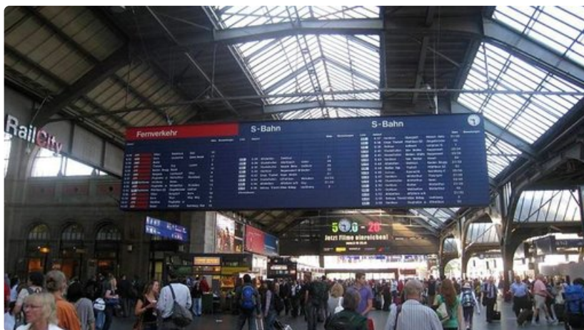
Zürichin päärautatieasema on yksi Sveitsin suurimmista.