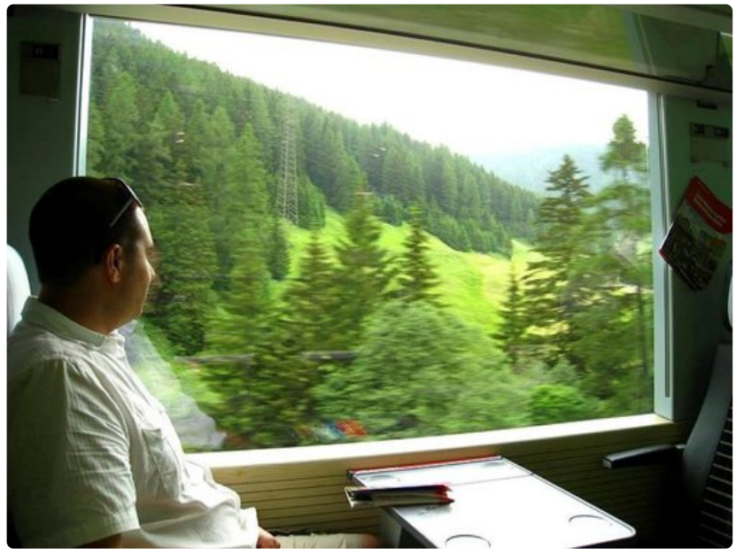
Alati vaihtuvat maisemat tarjoavat viihdykettä pitkienkin matkojen ajaksi.