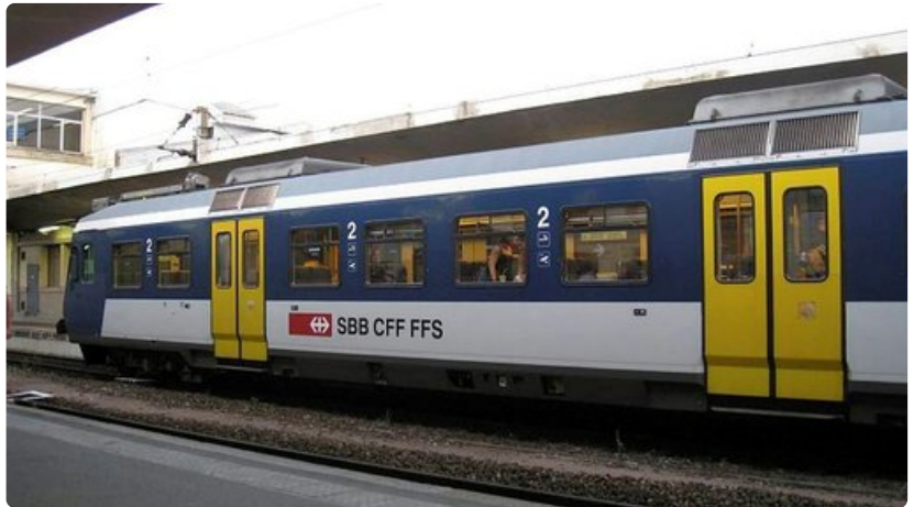
Valtion rautatieyhtiön SBB-CFF-FSS:n junat ovat siistejä ja kulkevat täsmällisesti aikataulussaan.