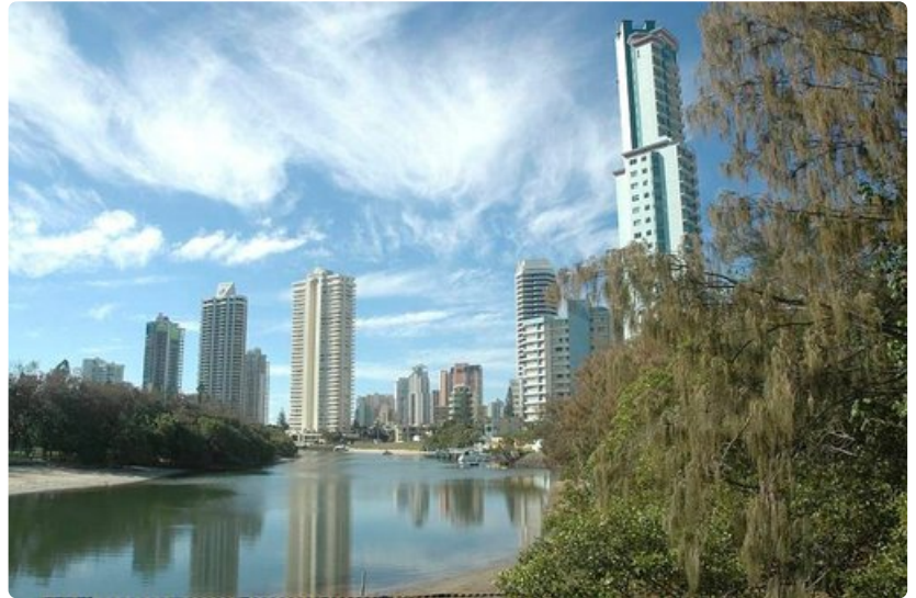
Gold Coastin modernia keskustaa. Ylimmät kerrokset ovat haluttuja näköalan vuoksi.