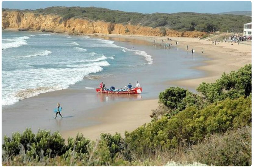
Pelastusvenetoiminta on eräs paikallisten harrastus.

Fremantle toimi satamakaupunkina ja 1800-luvun lopussa Kalgoorliessa koettiin ennennäkemätön kultakuume. Luonnon oudoista ilmiöistä mainittakoon Pinnacles kansallispuisto, jossa on näkyvillä entistä merenpohjaa sekä valtavia hiekkadynejä. Eroosio on hävittänyt pehmeämmän aineksen ja jättänyt pystyyn mitä omituisimman muotoisia puikkoja, pinnacles . Kuljettaessa autolla on muistettava, että matkalla on vain yksi polttoaineen jakelupaikka, muuten osavaltio on tietöntä aavikkoa.