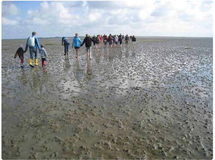
Vattimerivaellus on jännittävä ja unohtumaton elämys.

Mutaisen vattimerivaelluksen jälkeen suunnataan Borkumin keskusta rentoutumaan. Idyllinen pieni keskusta on kuin pala Välimerta pohjoisessa. Vastaremontoitu rantabulevardi houkuttelee iltpäiväkävelylle ja kapeita katuja kehystävät viehättävät ravintolat, jäätelökahvilat ja matkamuistoliikkeet. Suurimman vaikutuksen tekee kuitenkin itse ranta, joka kaartuu u-kirjaimen muotoisena pitkälle horisonttiin. Pohjanmeren ja Itämeren Saksan puoleisille rannoille tyypilliset värikkäät korituolit täplittävät rantaviivaa riemunkirjavassa sekamelskassa. Merivesi on viileää, mutta aurinko paistaa lämpimästi ja uimisen sijaan monet näyttävätkin keskittyvän erilaisiin rantapeleihin. Rentoudumme rauhoittavaa rantamaisemaa ihailen, emmekä voi