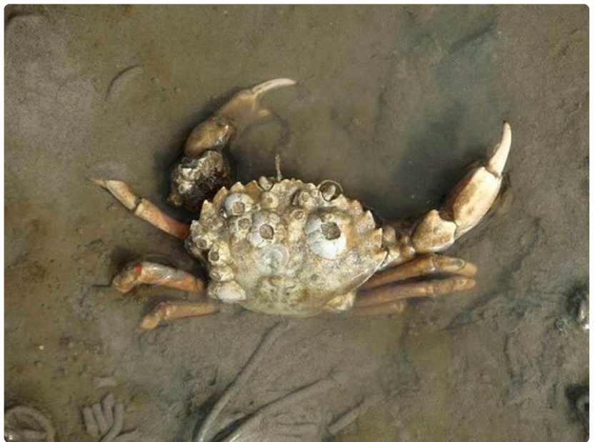
Merenpohjalla elää lukuisia rapu-, kotilo- ja simpukkalajeja.