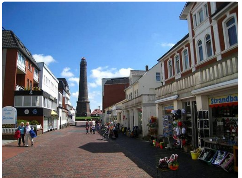
Borkumin keskustaa vartioi 130-vuotias majakka.