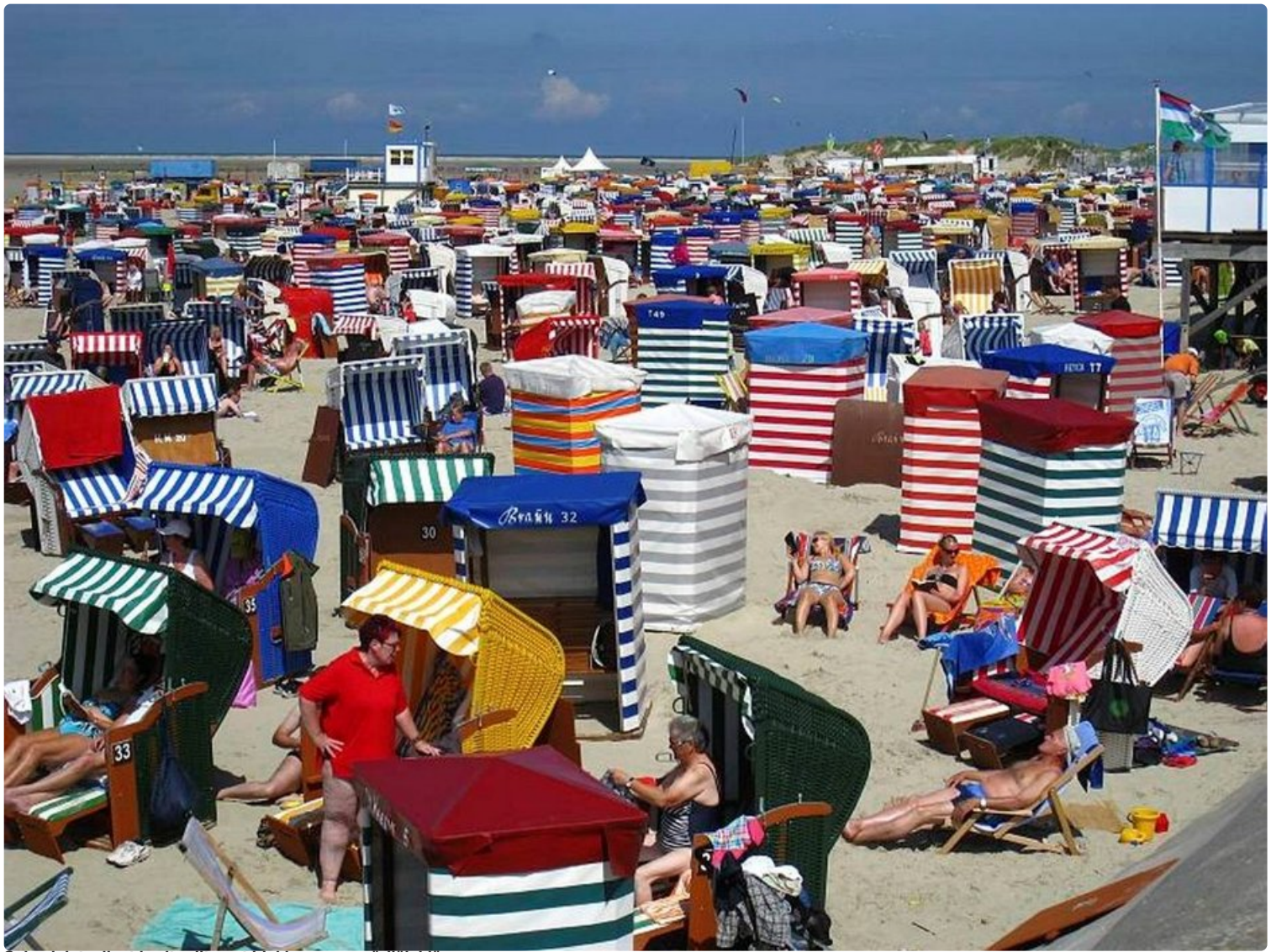
Saksalaistyyliset korituolit ovat hiekkarannan väriäiskä.