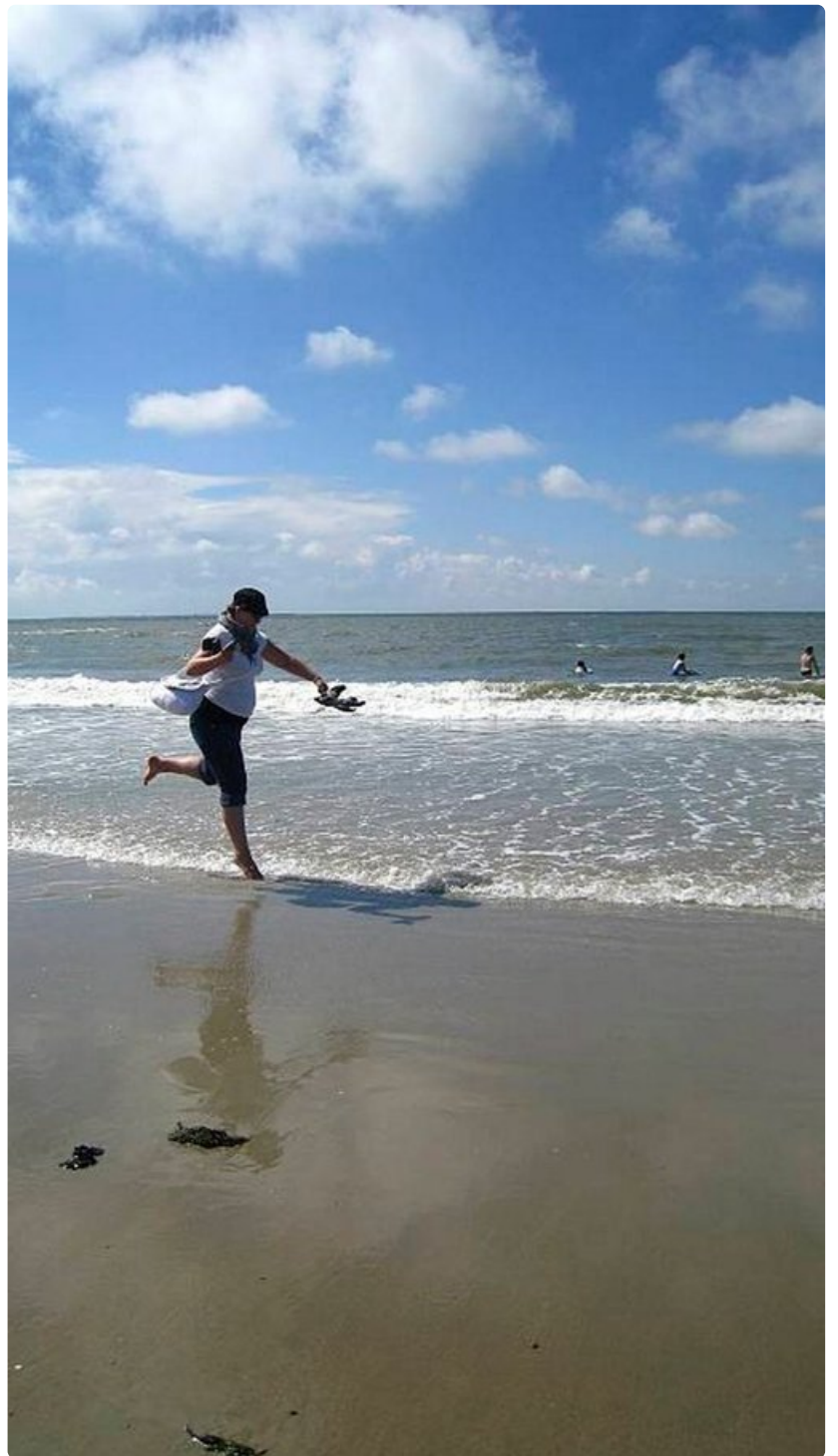
Aurinko, meri ja hiekkaranta houkuttavat Borkumille tuhansittain turisteja.