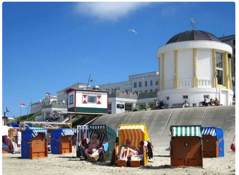
Keltainen paviljonki on koristanut rantapromenadia jo toistasataa vuotta.