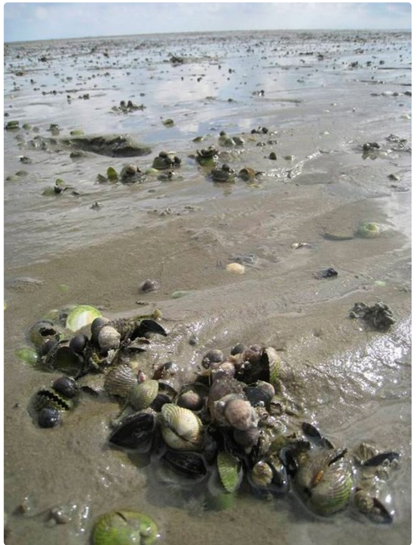
Paljain jaloin kulkeminen merenpohjalla on välillä haasteellista.