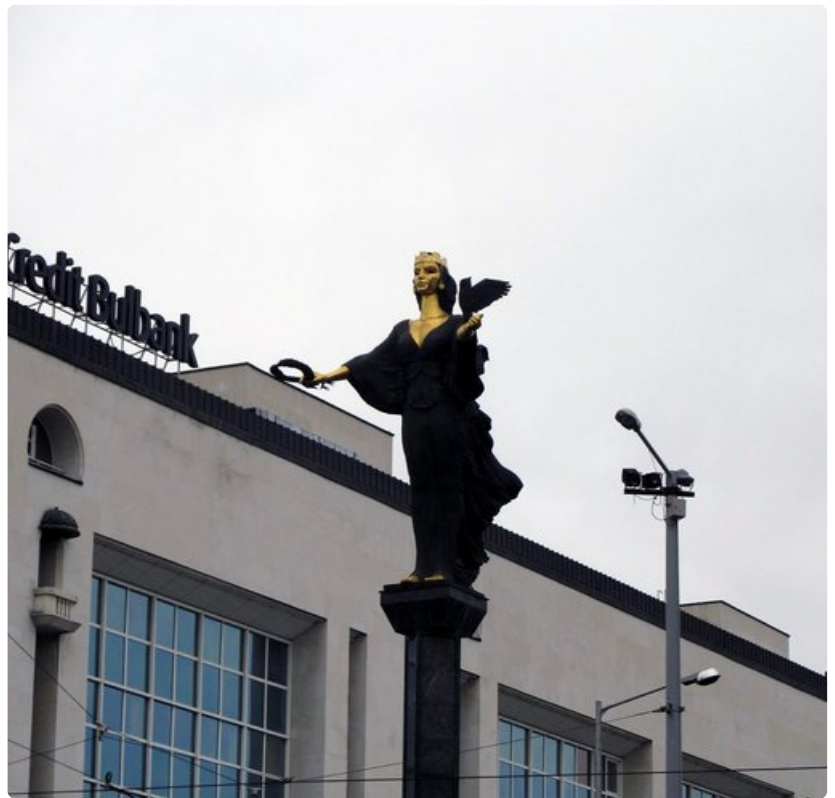
Niin katoaa maine kunnia. Kaupungin suojeluspyhimyksen patsas korvasi vuonna 2000 paikkaa ennen hallinneen Leninin.