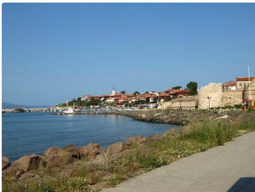
Historialliseen Nessebariinkin pääsee Varnasta bussilla.