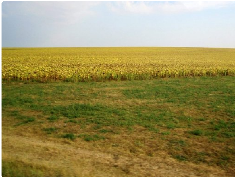
Auringonkukat viihtyvät Mustanmeren mullassa.