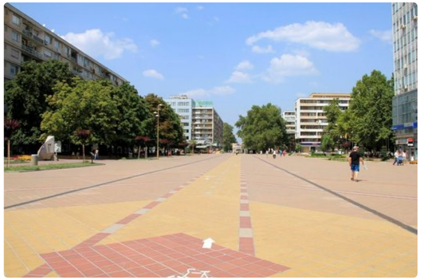
Dobrištín kaupunki kertoo olevansa "lahja Jumalalta ja Eurooppa-hengen lähde".