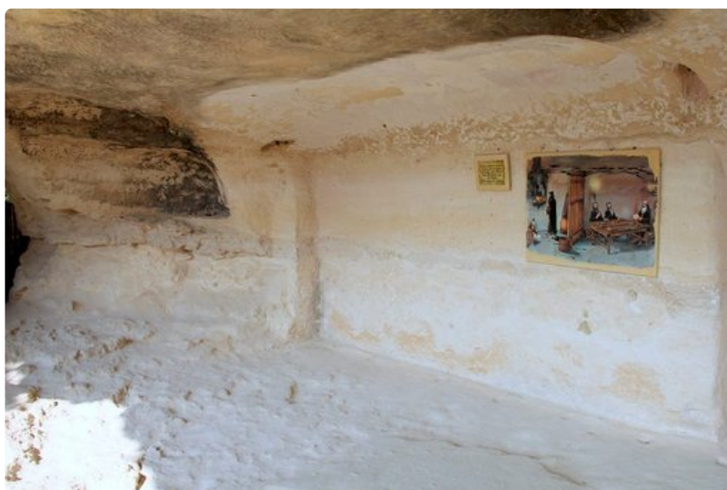
Luolaluostarin keittiön tulisijasta on jäljellä hiilenmusta seinä.