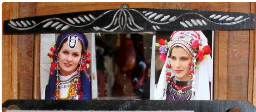
Vanhankaupungin museopajassa esitellään kansallispukuja.

Rahanvaihdoissa paikallista käteistä herahti käteen kuitenkin vain 159 levaa. Emme olleet huomanneet, että taululla olivat erikseen setelirahan ja shekkien vaihtokurssit. Käteisen kurssi oli shekin kurssia huonompi. Tässä vaiheessa suomituristeille nousi ruusunpuna poskiin.