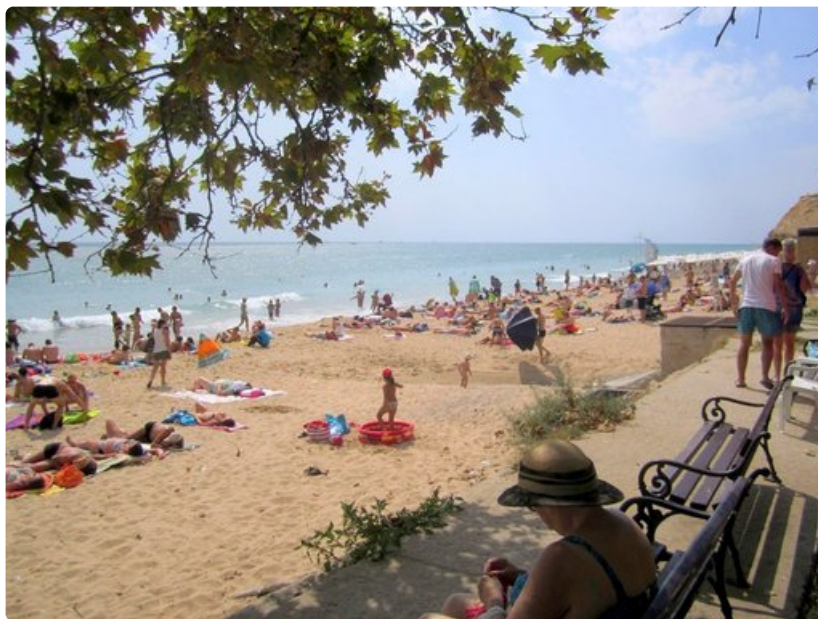
Kultahietikka houkuttelee paikallisväestön lisäksi etenkin venäläisiä ja saksalaisia.