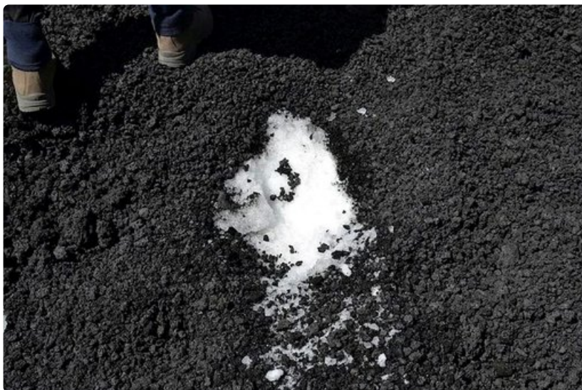
Vuosikertalumi on edelleen hyvin säilynyttä parikymmensenttisen tuhkerakroksen alla.