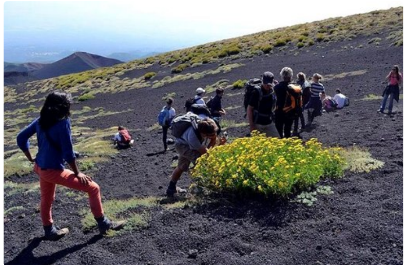
Vuorella on myös kasvillisuutta. Monet lajit ovat kotoperäisiä ja niitä tavataan vain Etnan rinteillä.