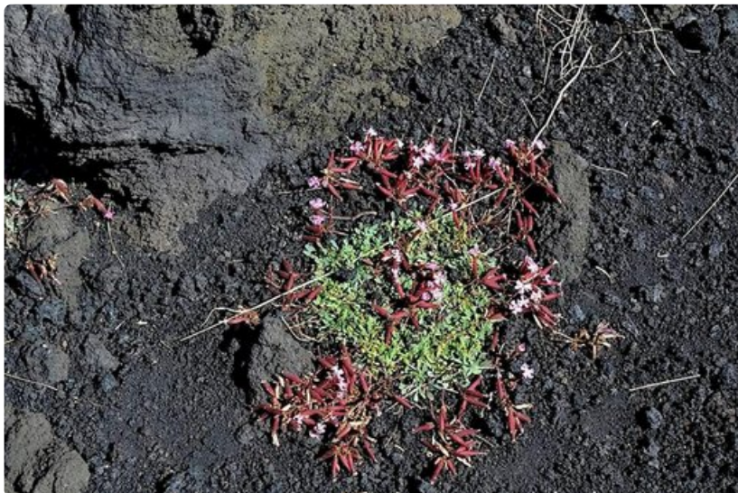
Saponaria sicula kuuluu Etnan kotoperäiseen kasvistoon. Se on sukua Suomessa yleisesti koristekasvina käytettävälle suopayrtille. Kukka on Etnan kansallispuiston tunnus.

Miten pääsee? Suomalaiset matkanjärjestäjät tarjoavat matkoja Sisilian Giardini-Naxoksen ja Taorminaan, joista on noin tunnin ajomatka.