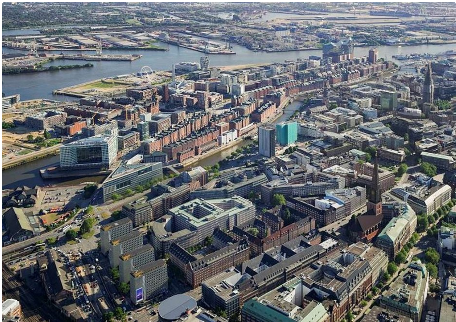
Hampurin Speicherstadt on maailman suurin historiallinen makasiinialue.