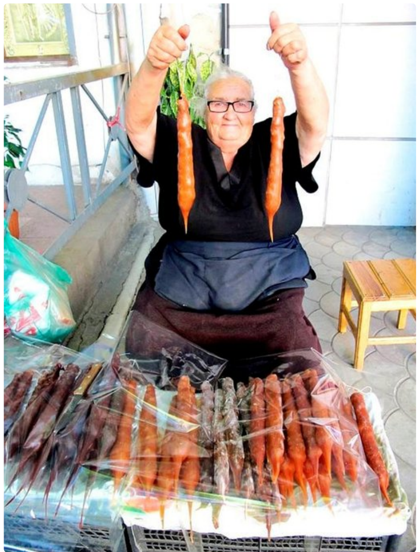
Tbilisin katujen varsilla istuskelee mummoja, jotka myyvät "karkkeja" eli viinirypälemehusta, hunajasta ja pähkinöistä valmistettuja 10 päivää kuivatettuja kynttilänmuotoisia tshurtsheloja.