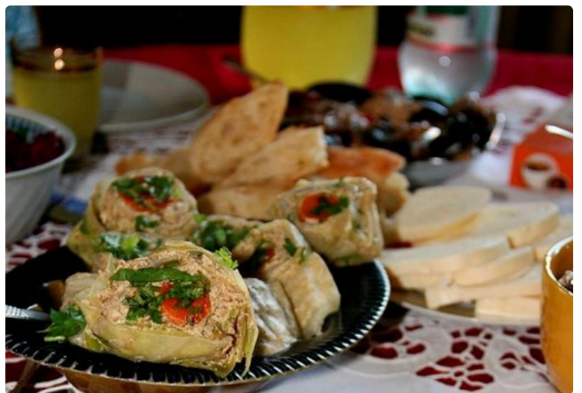
Lämpimiä liharuokia kannattaa maistella varovasti, sillä niitä seuraavat kylmät liharuoat, kuten lihatäytteiset paprikat. Sika, nauta, kana ja lammas muhivat padoissa mausteiden, pähkinäkastikkeiden ja vihannesten kera. Lihaa tarjotaan myös kuivattuna.