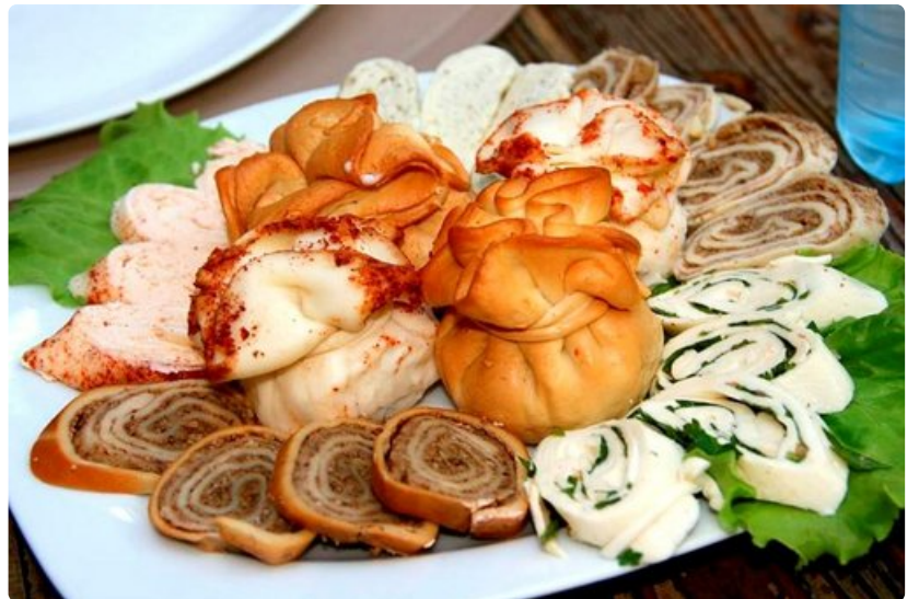
Georgialaiseen pitopöytään katetaan suolavedessä keitettyjä khinkalinyttejä, joiden syömistekniikka on opeteltava isäntäväen auliilla avustuksella.