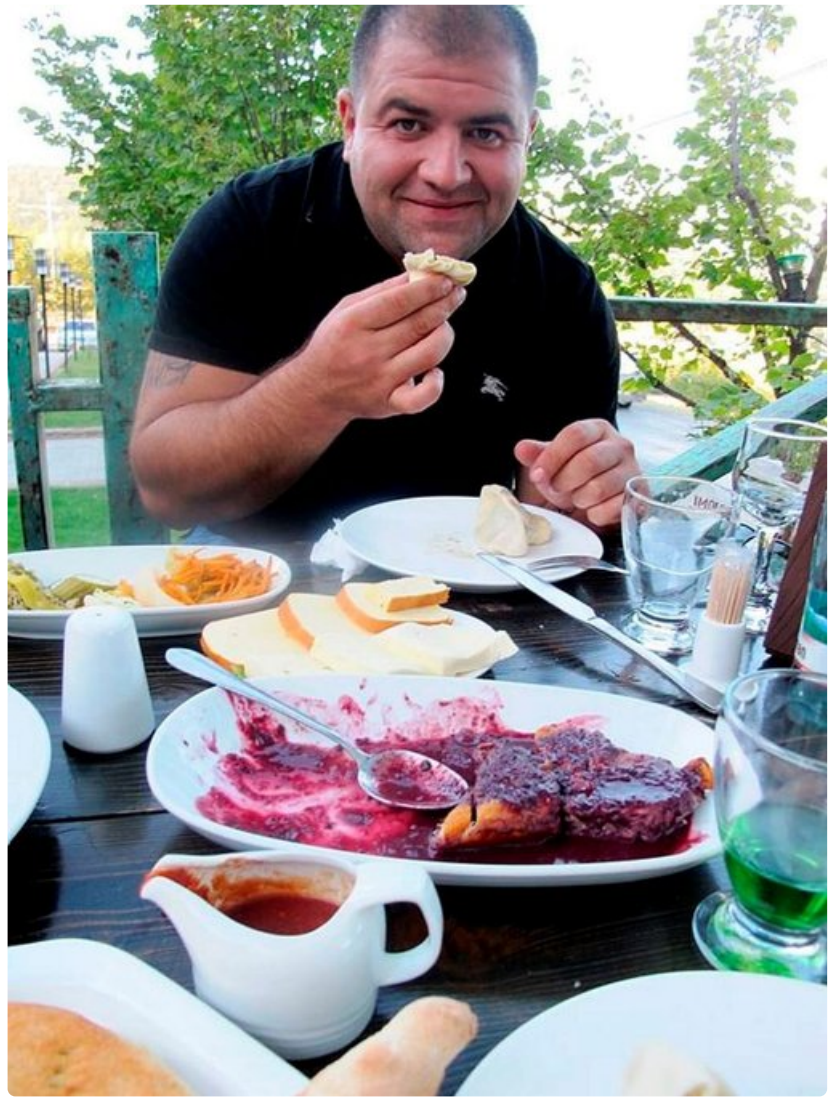
Jälkiruissa ei sokeria ja hunajaa säästellä. Hillot ovat erityisen herkullisia. Palan painikkeeksi voi ryypätä jauholla saostettua greippimehua.