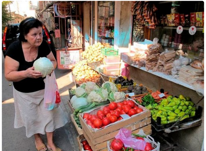
Vihanneskauppa käy tuoreiden tuotteiden ja edullisten hintojen ansiosta. Sipulit, tomaatit, chili, pippurit ja pähkinät ovat georgialaiskeittiön must. Munakoiso, yrtit ja perunat keventävät lihapatoja.