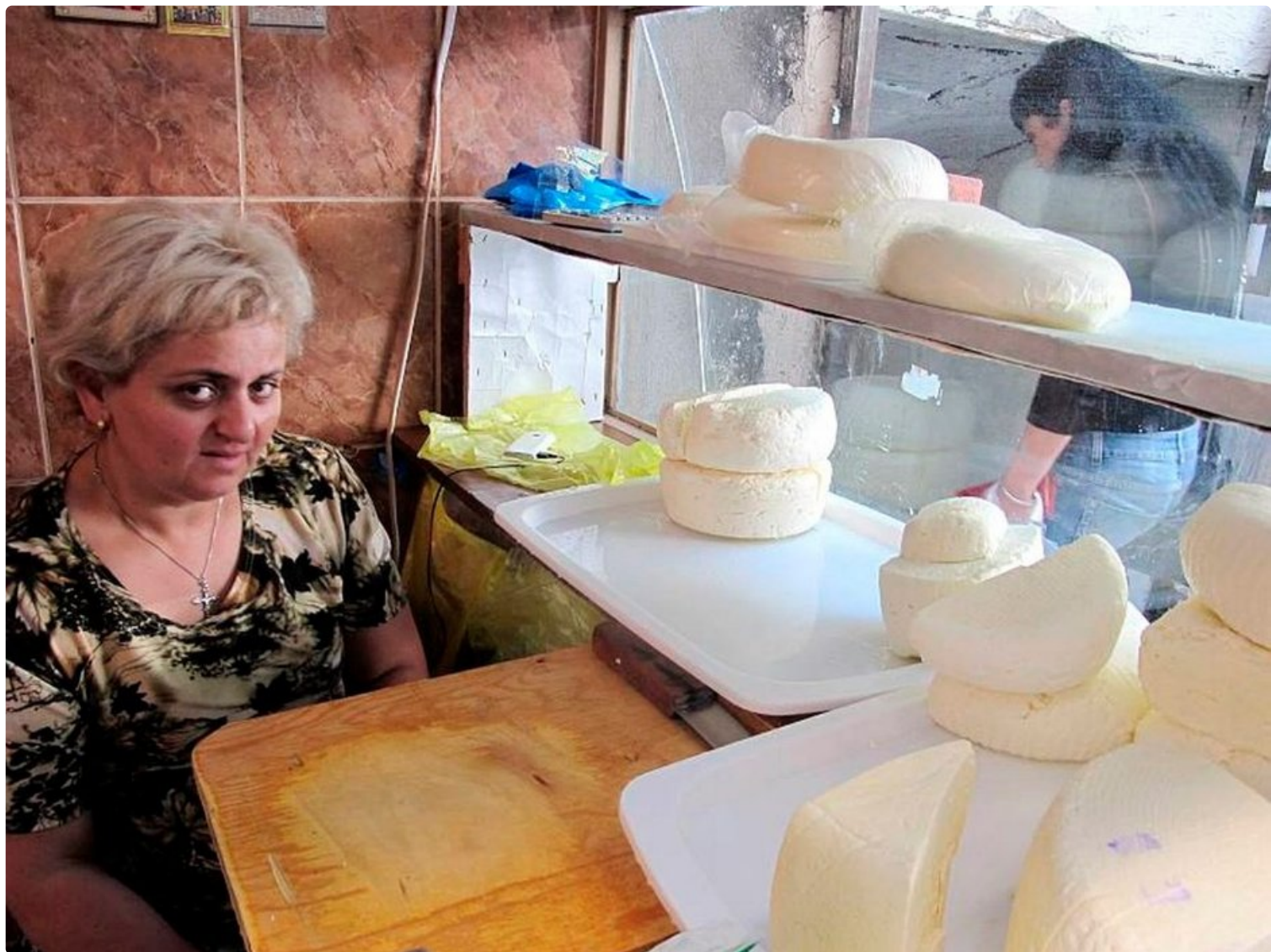
Kotijuustoja tehdään lehmän, vuohen ja buffalon maidosta. Makuja on miedosta happamaan, pehmeästä terävään.