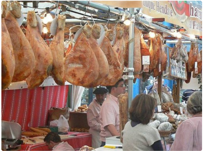
Joka kevät Bayonnessa järjestetään kinkkufestivaalit. Tämä on yli tuhat vuotta vanha perinne. Bayonnan ilmakuivattu kinkku on maailmankuulua.

Bayonne on tunnettu ihanasta suklaastaan. Myös Bayonnan kinkku on maailmankuulua. Yli tuhat vuotta vanhan perinteen mukaan Bayonnan kinkkufestivaalit järjestetään vuosittain keväällä.