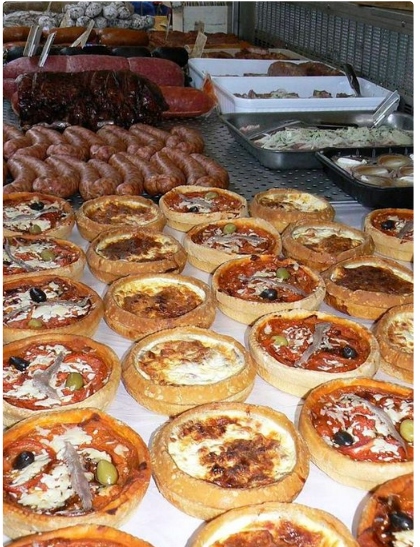
Bayonnessa kannattaa sallia itselleen herkuttelu. Suklaata, käsintehtyjä konvehteja, värikkäitä macaron-leivoksia, eli mantelimarenkeja, herkullisia piiraita, hienostuneita kakkuja - näistä herkuista Bayonne tunnetaan.