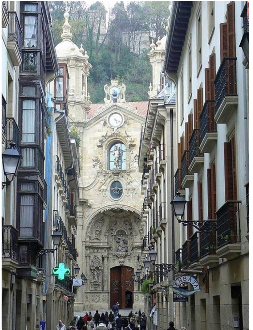
Vanhankaupungin, Parte Viejan sydäimestä löytyy komeudessaan mykistävä barokkikirkko Iglesia de Santa María del Coro.