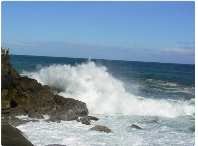
San Sebastián on lainelautailijoiden keskuudessa suosittu kaupunki. Biskajanlahden aallot ovat liian hurjia vasta-alkajille, joiden kannattaa ihailla taitavia lajin harrastajia rannalta. Biskajanlahtea on joskus sanottu maailman myrkyisimmäksi merialueeksi. Meren syvyyteen on moni laiva vuosisatojen saatossa uponnut.