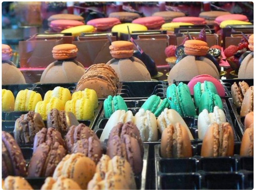
Bayonne tunnetaan näistä herkuista.

Tarjolla on suolattua tai savustettua valkoista kalaa, tonnikalaa, marinoituja ja gratinoituja simpukoita, rapuja, mustekalaa, meriahventa ja anjovista. Myös kananmuna, kana, marinoidut sienet, vuohenjuusto, aurinkokuivatut tomaatit, marinoidut vihannekset ja ilmakuivattu kinkku ovat tavallisia raaka-aineita baskikeittiössä.