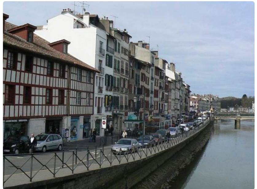
Pyreneiden vuoriston halki virtaavan Adourin haarajoki Nive virtaa Ranskan baskialueiden läpi.