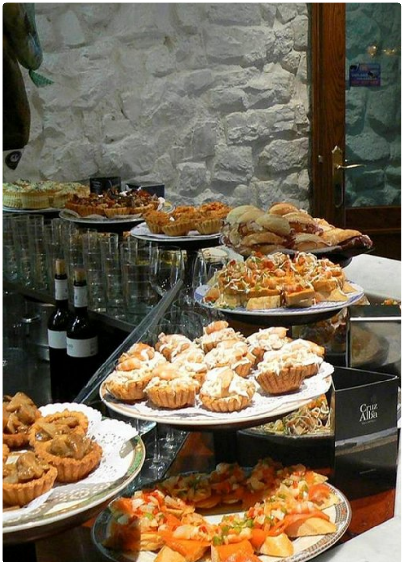
Vanhankaupungin kortteleissa on lähes 200 pintxos-ravintolaa ja jokaisella on omat erikoisuutensa.