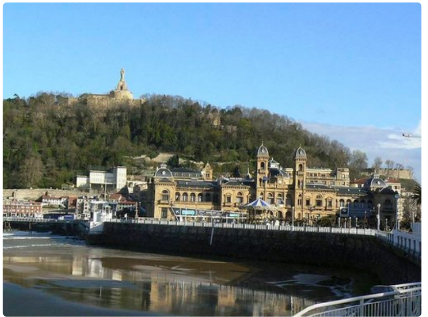
Vanhaakaupunkia vartioi Kristus-patsas vihreältä Monte Urgullin kukkulalta. Vuoren juurella sijaitsee 1600-luvulta peräisin oleva keskusaukio Plaza de la Constitución, joka on entinen härkätaisteluareena.