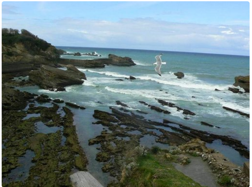
Biarritzissa on mahtavia piknikpaikkoja. Kannattaa ostaa eväät ja nauttia ne luonnon helmassa vaikka merta ihaillen. Rantaviivaa riittää silmän kantamattomiin ja itse Biarritzin kaupungissa sitä on yli kuusi kilometriä.