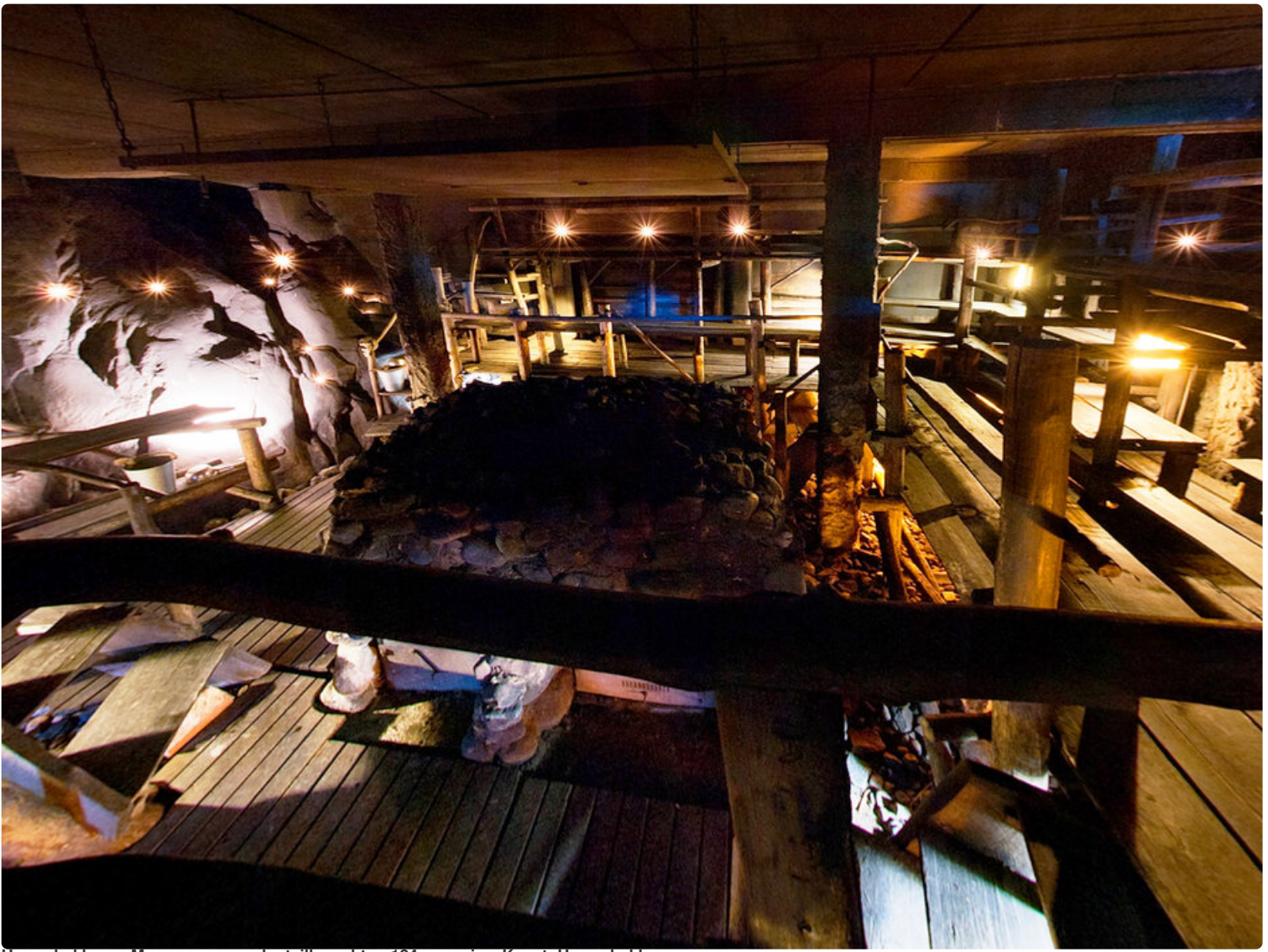
Herrankukkaron Maasavusaunan lauteille mahtuu 124 saunojaa.