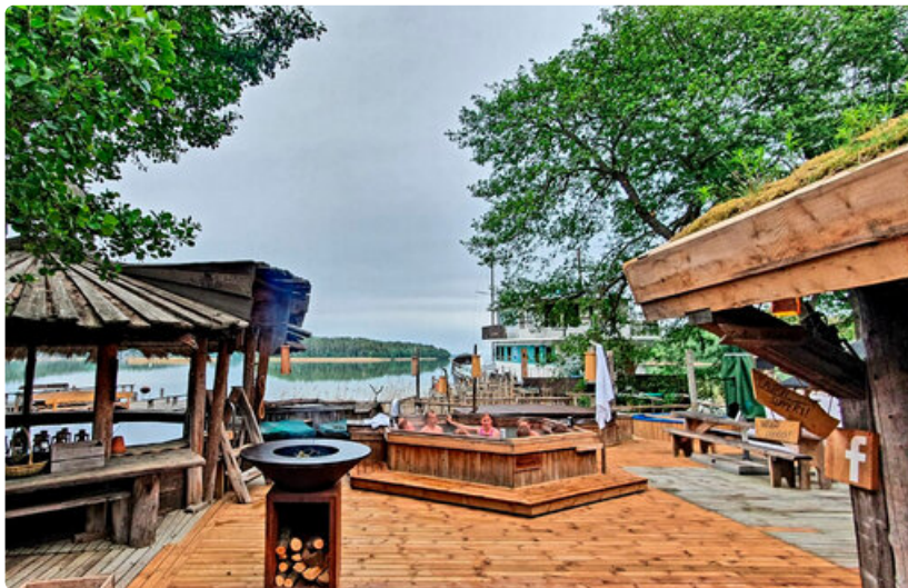
Saunomisen yhteydessä asiakkaat pääsevät rentoutumaan myös lämminvesialtaissa.

Parhaillaan rakenteilla olevien uusien linnunpönttö majoituskohteiden yhteyteen valmistuvat myös uudet saunat – koska suomalainen luksus ei ole kultaisia vessan hanoja vaan kunnolliset löylyt. Erilaisia saunoja on vanhalla kalastajatilalla jo 24 kappaletta.