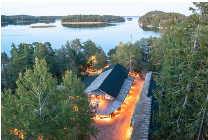
Herrankukkaron sijaitsee Rymättylässä, Naantalin saaristossa