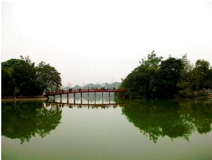
Hanojin keskustassa on kuuluisa Punainen Silta, jonka yli on jokaisen kaupungissa kävijän ehdottomasti käveltävä.