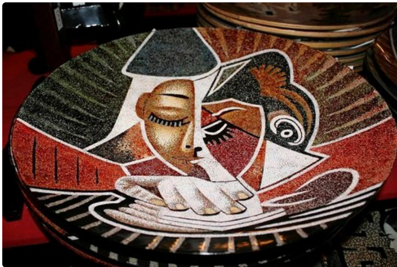
Ellet jaksaa kantaa painavaa savikulhoa äidille tuliaisiksi, voit ottaa siitä kuvan.

Reppumatkailuun kuuluu tinkiminen. Rahankäyttö on sosiaalista peliä, jossa vaaditaan pelisilmää. Tinkiminen on kuin tanssi, jolla on oma rytmi, tyyli, melodia ja askeleet. Tinkimisen luonteeseen kuuluu myös se, että tunnistaa, milloin on lopettamisen aika.