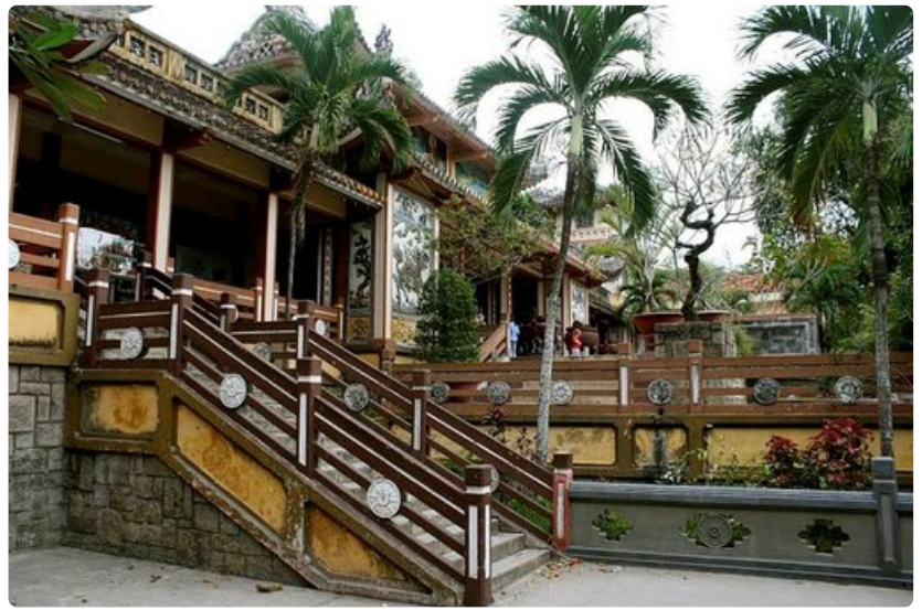
Reppumatkailijoille kelpasivat kaikki kahdelle sopivat majoitustilat, joiden hinta ei ylittänyt kymmentä dollaria yöltä.

Ho Tsi Minh Cityyn eli entinen Saigon on Vietnamin vilkas bisnespääkaupunki, jossa tarjontaa on joka lähtöön. Kaupunki muistuttaa Bangkokia matkailijoinen, ravintoloinen, liikeneruuhkineen, pilvenpiirtäjäineen ja liikekorteineen.