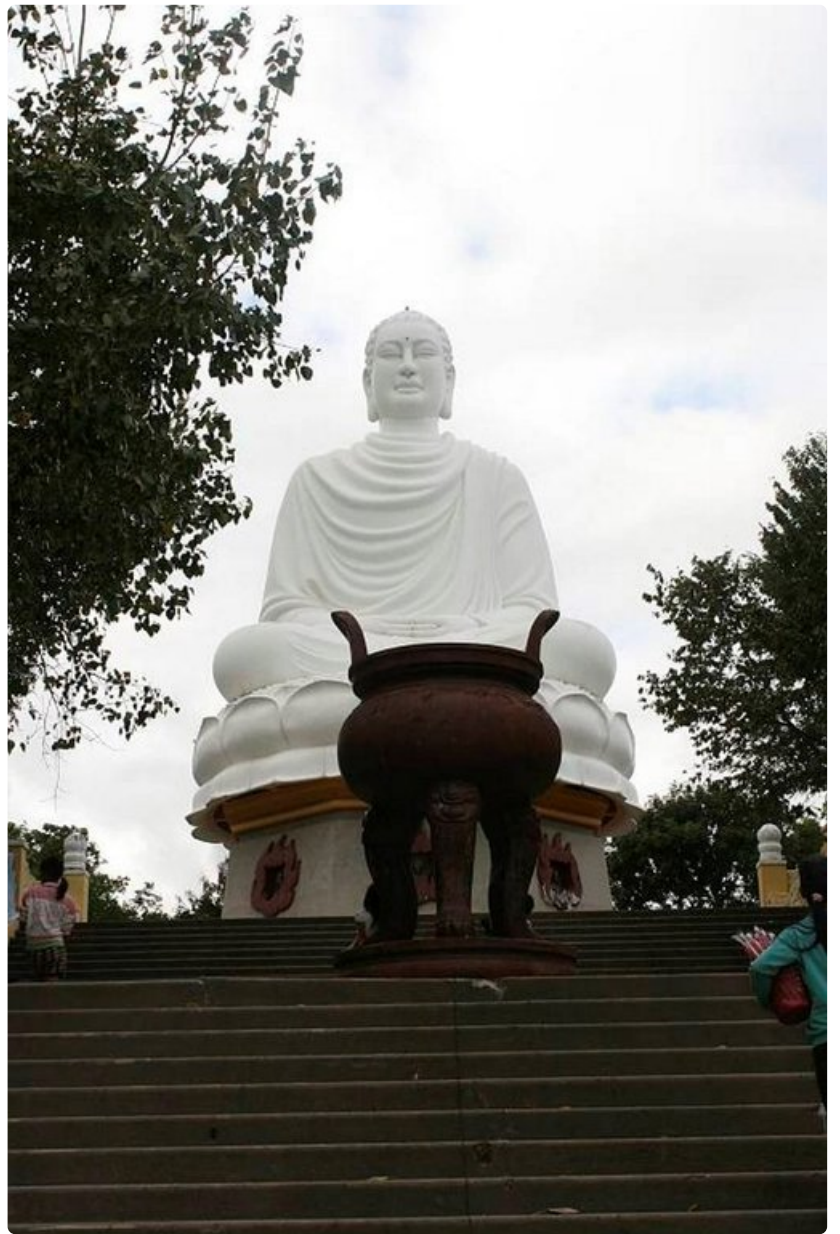
Jeesus vartioi Rio Janeiroa, Shiva Nan puolestaan Trangia. Viitisen metriä korkean patsaan sisällä on temppeli.