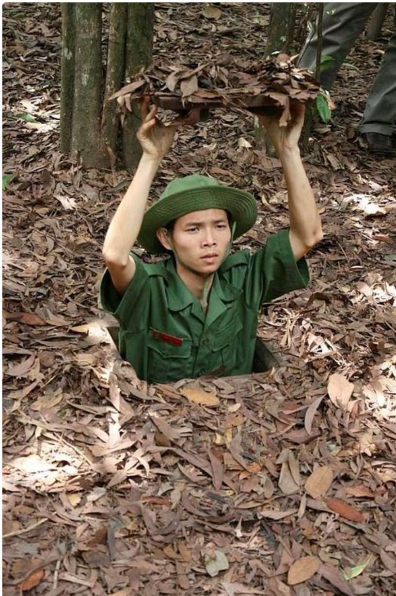
Ho Tsi Minh Cityn liepeillä olevassa tunnelikylässä näytetään, miten tehdään amerikkalaisten sotilaiden vihaama katoamistemppu. 250 kilometrin pituista tunnelia esitellään nyt matkailijoille.