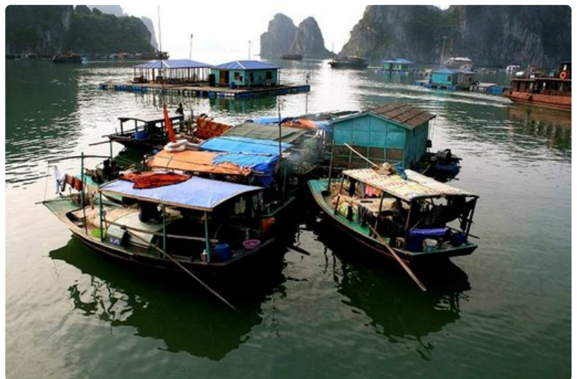
Alukset ovat vanhoja värikäsurjeisia puulaivoja, joilla matkailijoita kuljetetaan Halong Bayn terävien kalliomuodostelmien välissä.