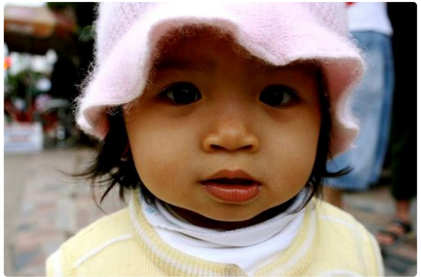
Vietnamilaisilla lapsilla ei ole nukkumaanmenoaikaa. Aikuiset ovat ulkona iltaisin pikkuvauvat kainalossa ja kaduilla pyörii pikkulapsia yömyöhään.