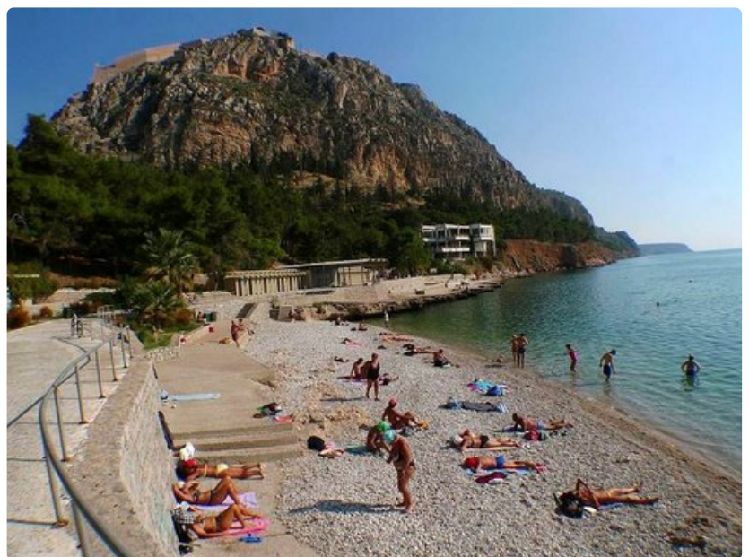
Yli 200 metrin korkeuteen yltävä linnoitusvuori suojaa Nafpliosin kirkasvetistä Arvanitia-uimarantaa. Kaupungin keskustan läheisyyden ranta on erityisesti vanhempien ihmisten suosiossa.