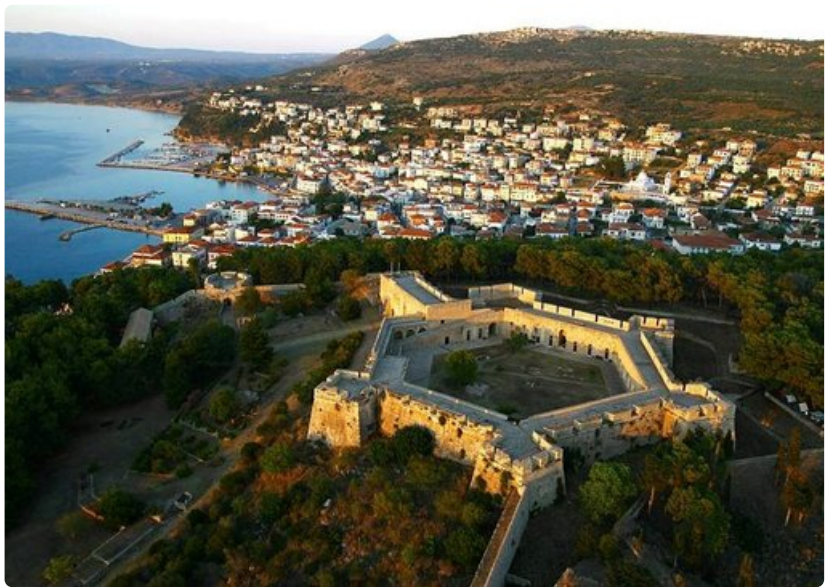
Niokastro-niminen turkkilaisten 1500-luvun loppupuolella rakentama linnoitus vahtii Costa Navarinon lahden rannalla sijaitsevaa Pylosin kaupunkia.