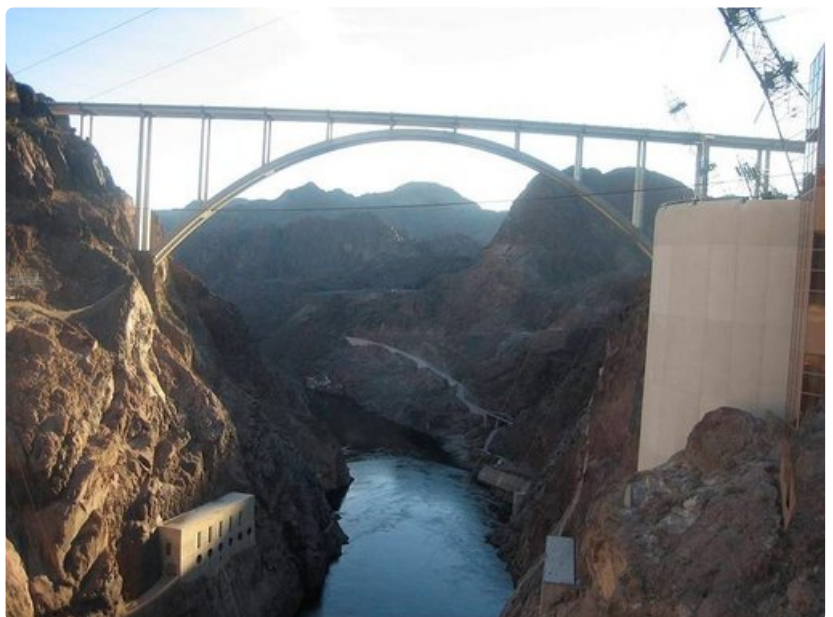
Coloradojoki jatkaa padon jälkeen matkaansa kohti päätepistettään.