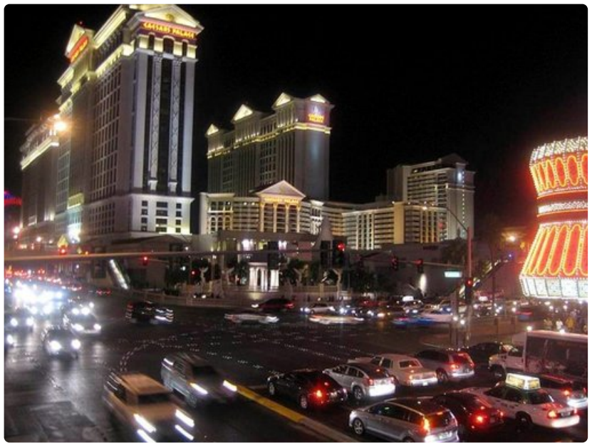
Las Vegasin uhkapelikaupungin neonvalot loistavat Hooverin padon tuottaman energian voimin.