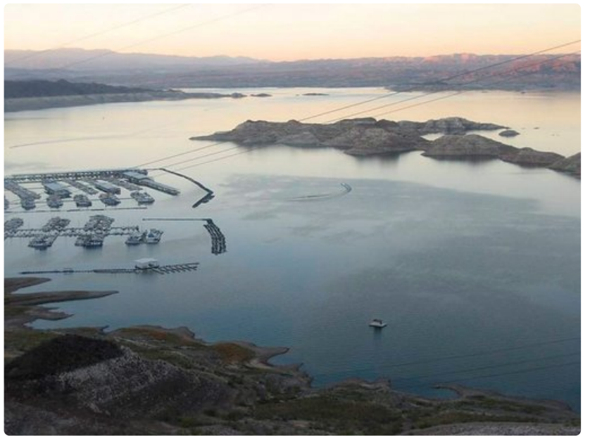
Valtava Lake Mead tekojärvi varastoi veden padon tarpeisiin.