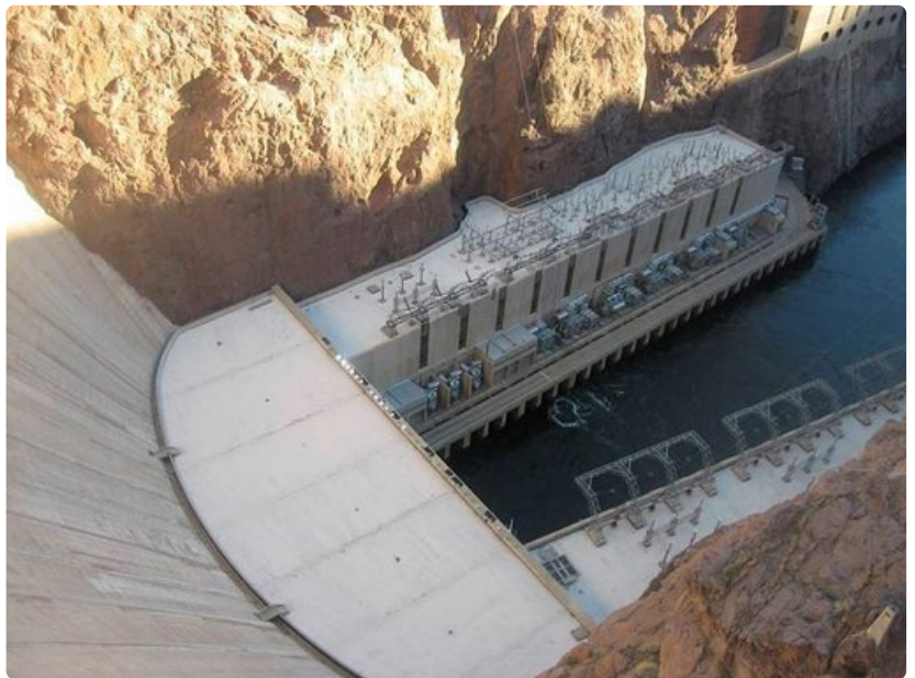
Voimalaitoskenttä on yli 200 metriä vesipinnan alapuolella.