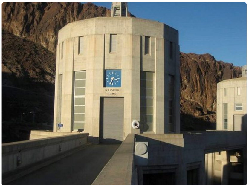
Hooverin padon alueella eletään niin Nevadan kuin Arizonan osavaltioiden aikaa.