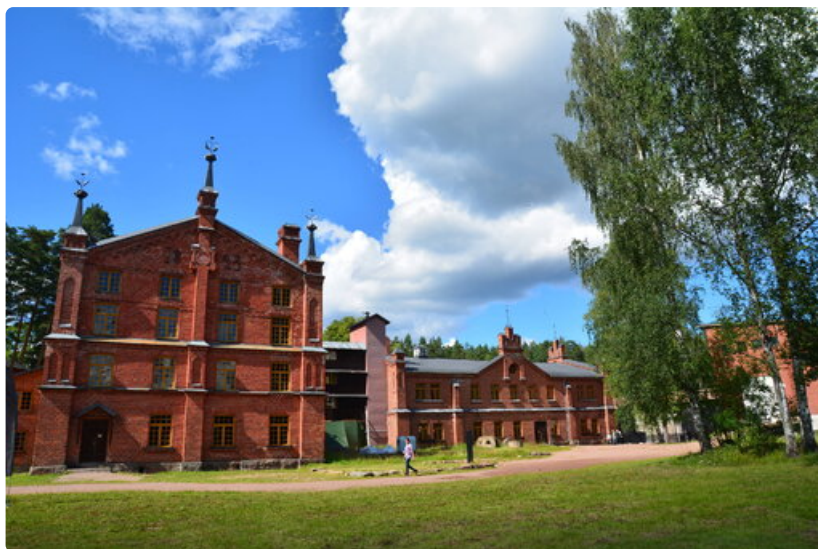
Maailmanperintökohde Verla.