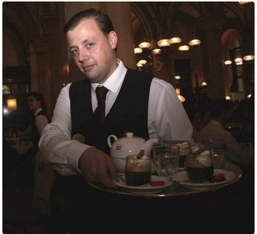
Tarjoilijoiden pukukoodi on klassinen; valkoinen paita ja tumma liivi tai takki.