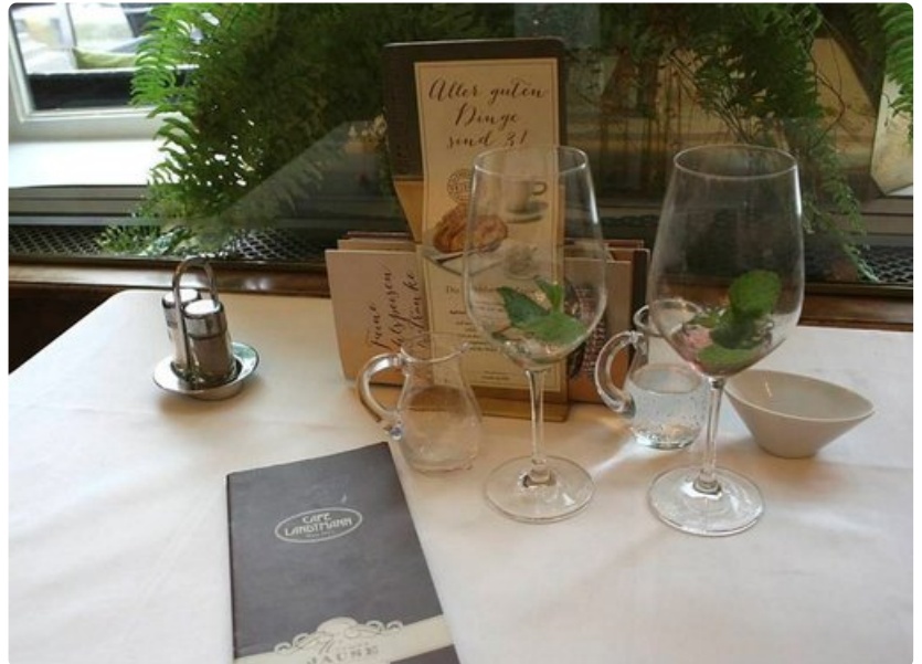
Cafe Landtmann oli Sigmund Freudin kantapaikka.