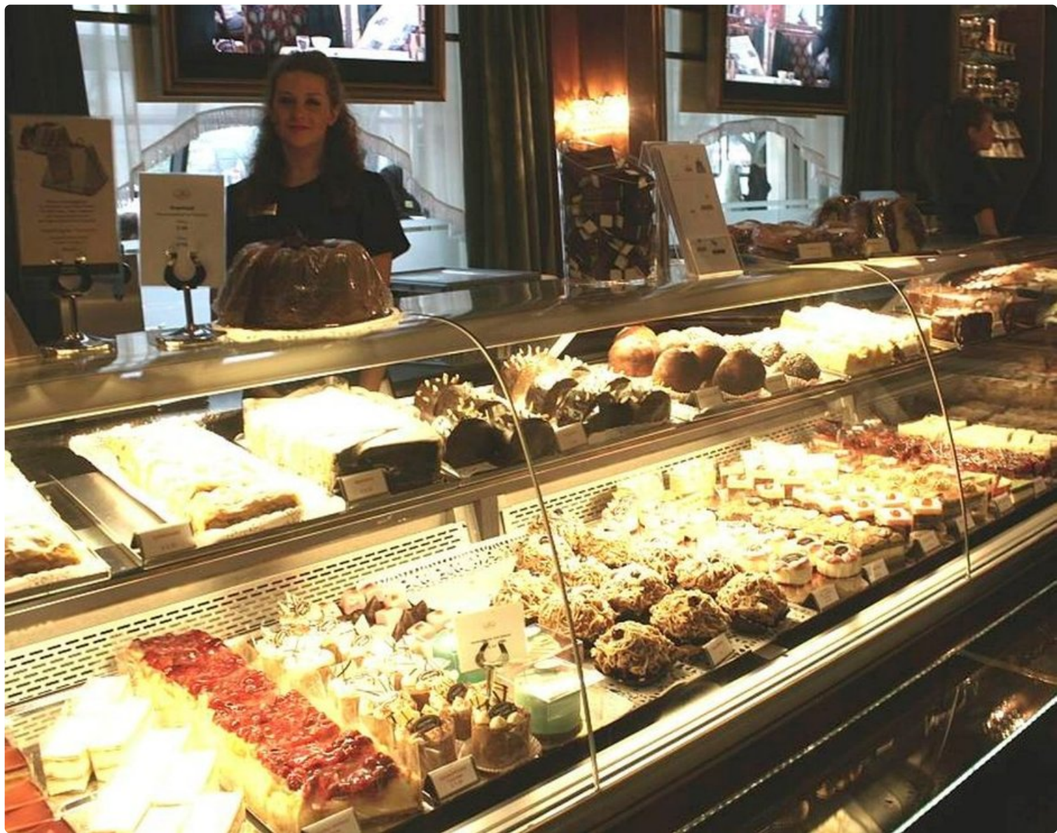
Cafe Landtmann houkuttelee herkullisilla leivoksillaan.