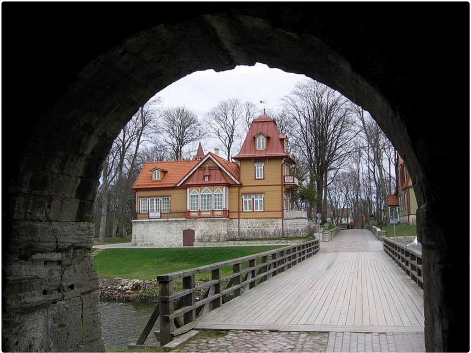
Kuressaaren Piispanlinnan portilta avautuu idyllinen kaupunkinäköymä.