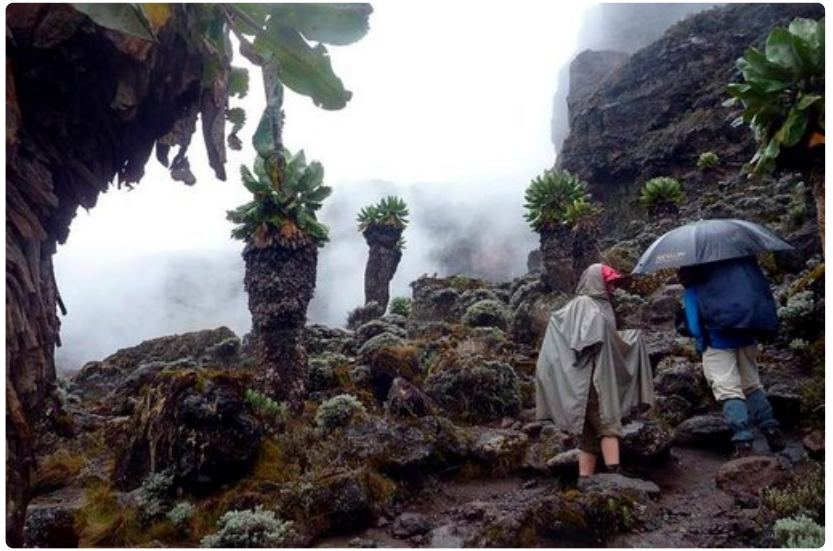
Jäättiläisvillakoiden viitoittamalla tiellä kohti Barrancon seinämää. Erilaisille sadevarusteille löytyi käyttöä.

Kaikki eivät ole liikkeellä samalla taktiikalla. Harjannetta kömpii ylös arviolta ainakin sadan otsalampun letka, josta osa jo kaukana