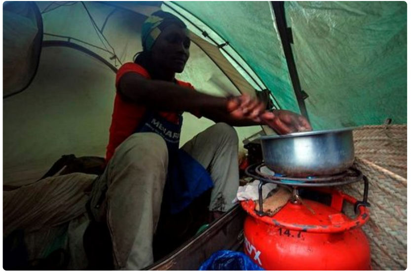
Retkikunnan kokki työntouhussa. Alkeellisista oloista huolimatta ruoka oli todella maistuvaa ja monipuolista koko vaelluksen ajan.