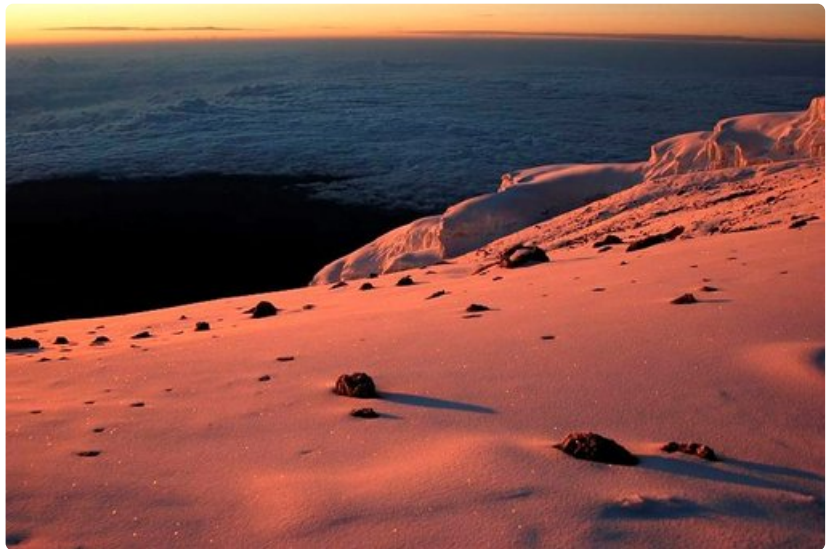
Kalderan reunalle Stella Pointiin saavuimme auringon ensisäteiden mukana.