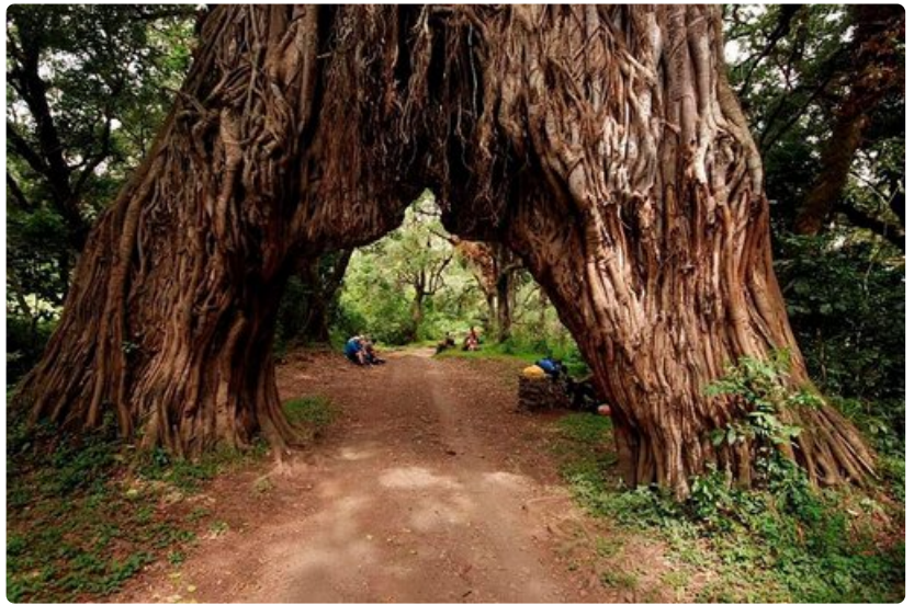
Lounastauolla jättimäisen viikunapuun juurella Arushan luonnonpuistossa.