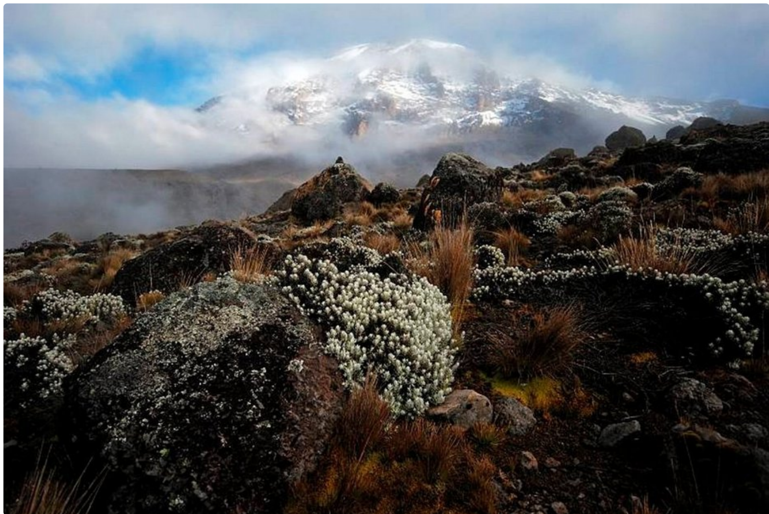
Kukkaloistoa korkealla rinteillä Kilimanjaron luonnonpuistossa.