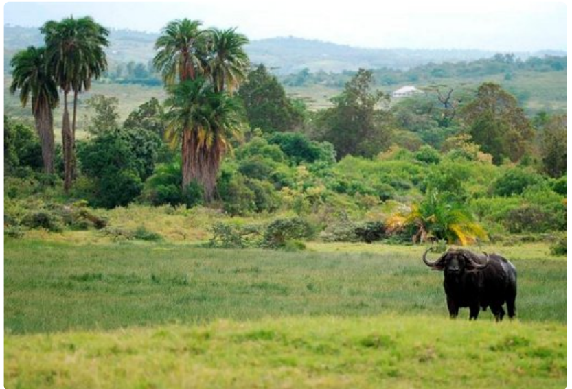
Merun vaelluksen aikana on mahdollista bongata safareilta tuttuja eläimiä. Tämä oudosti käyttäytynyt puhveli sai aseistetun puistonvartijan varpailleen.