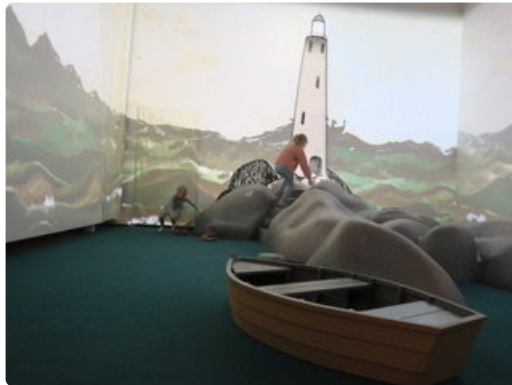
Merestä löytyviä aarteita:, simpukoita, ruostuneita kettinginpalasia ja linnunmunan kuoria, on koottu pieniin vitriineihin kaikkien ihailtaviksi.