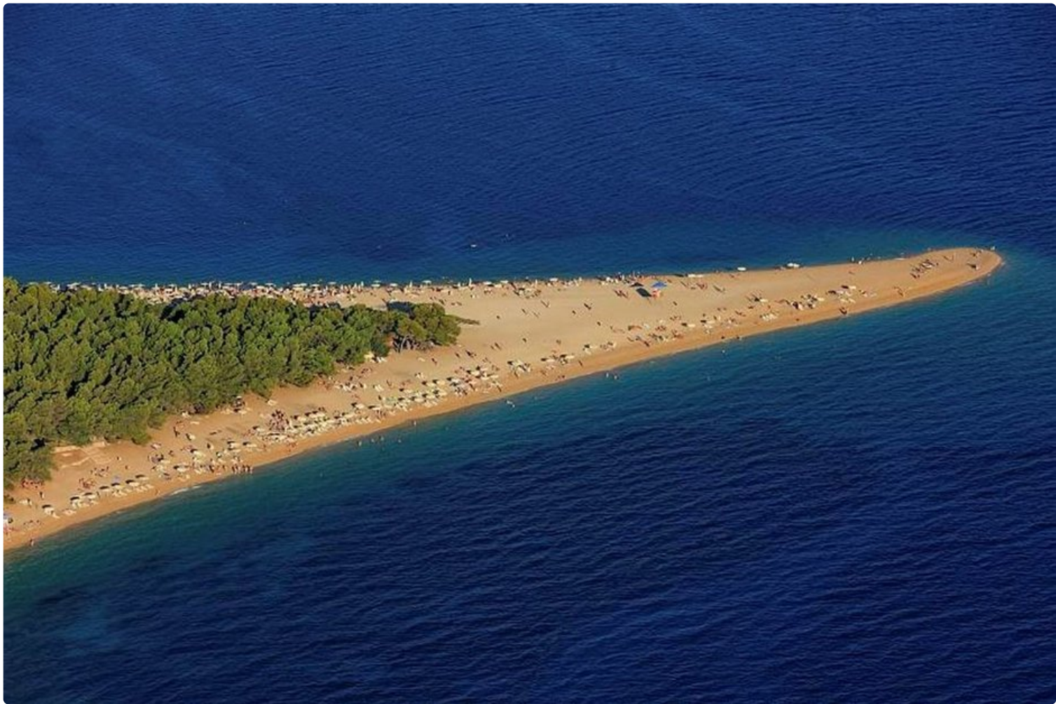
Zlatni Rat - Kultainen niemi.