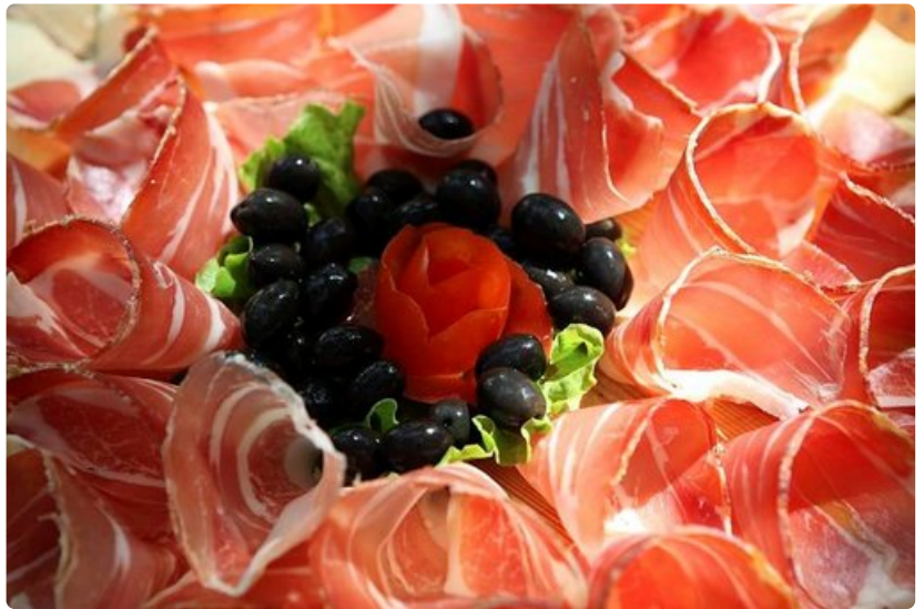
Kroatialaiset osaavat kinkun kuivaamisen.