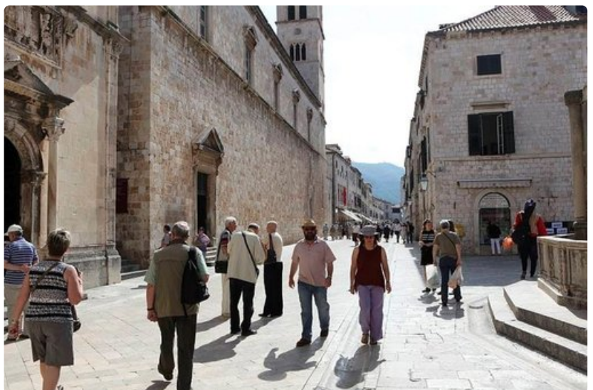
Dubrovnik henkii historiaa.