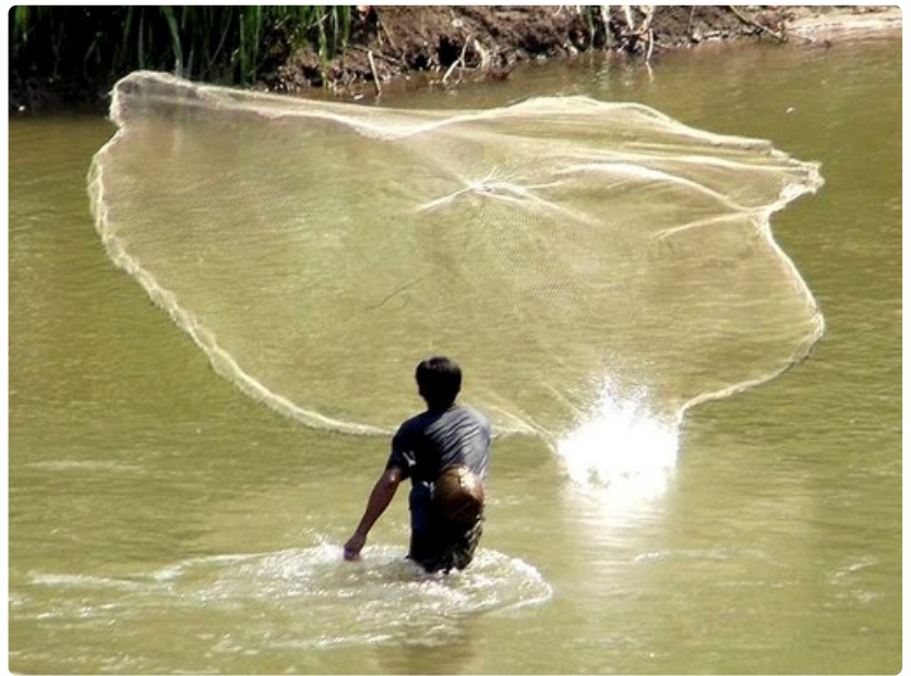
Mekong-joki tarjoaa monelle mahdollisuuden lisätä hieman aterioiden proteiinipitoisuutta eväkkäillä.

Myös pienen etelälaosilaisen kylän ja sen uskomattomat ihmiset.