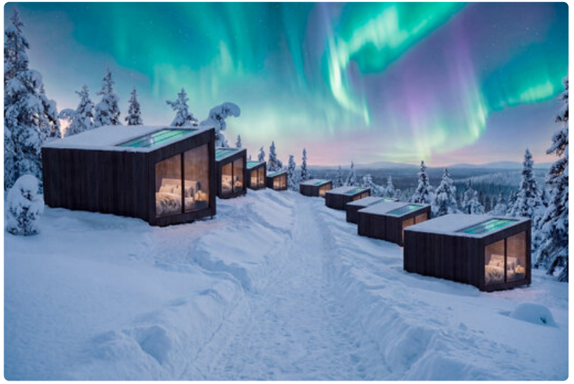
Yhtiö tuottaa mökkejä sekä hotellikokonaisuuksiin että yksityisten tonteille.

– Olemme rakentaneet erittäin vahvan pohjan kasvulle. Uusien tuotteiden vastaanotto, kasvava tuotantokapasiteetti, Lapin matkailurakentamisen voimakas kysyntä ja tehokas valmistusmalli luovat meille erinomaiset edellytykset jatkaa kasvua myös kansainvälisesti, Vaaramo sanoo.