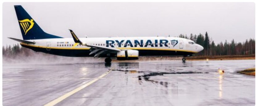
Rovaniemen neljä uutta reittilento-yhteyttä Britteinsaarille alkavat.