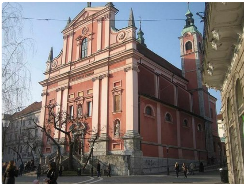
St. Nicholasin katedraali sijaitsee Vanhassakaupungissa.