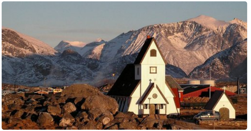
Syvällä Grönlannissa voi törmätä äärettömän kauniisiin kohteisiin.