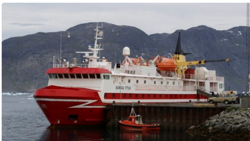
Liikkuminen Grönlannissa tapahtuu lentäen tai laivateitse.