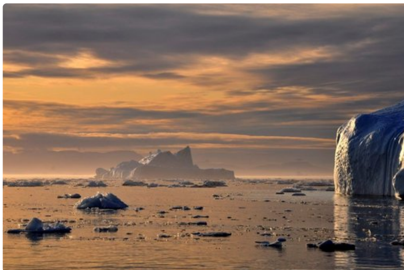
Vuodenaajasta riippumatta rannikolla ajelehtii jäävuoria.