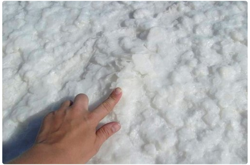
Suola on kovaa kuin kivi. Mitä muuta voisi olettaakaan 10 metrin paksuiselta kerrostumalta?

Vahva mädännyttä kananmunaa muistuttava rikinkatku ja vihmovan kylmä tuuli pitivät kuitenkin vierailumme Sol de Mañana -geysirien luona lyhyenä.