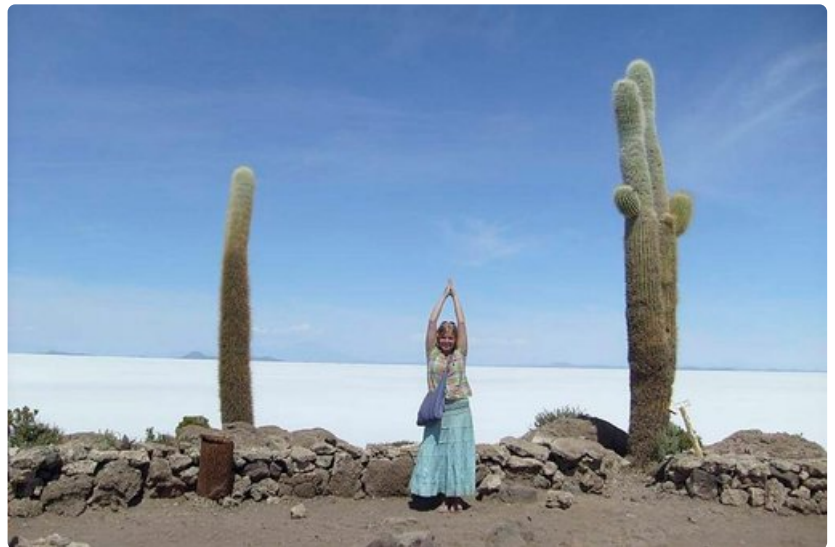
Incahuasin kaktussaarella kasvaa satoja jäättiläiskaktuksia, joista osa on jopa 1000 vuotta vanhoja.