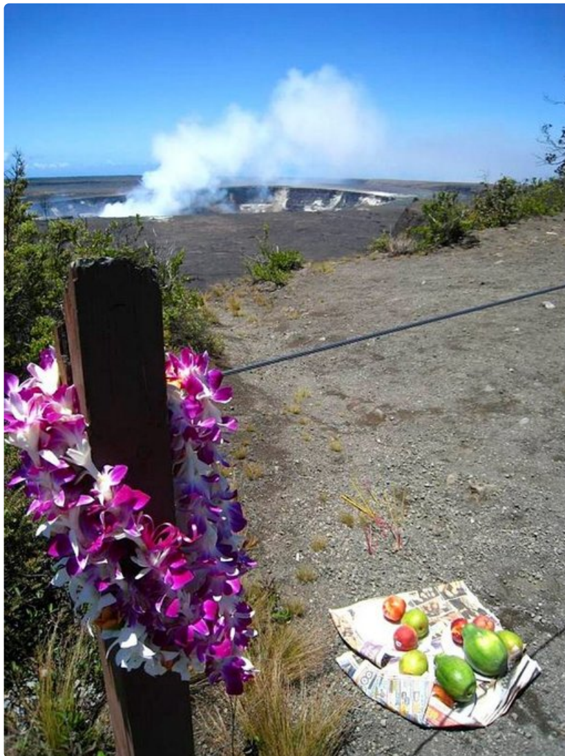
Kilauean tulivuori Big Islandilla on ollut aktiivinen yli 30 vuotta.

Paras vierailuaika: Havaijin ilmasto on suotuisa ympäri vuoden. Kesällä on hieman kuumempaa ja kuivempaa, mutta talvi on parasta surffaus- ja valaiden katseluaikaa.