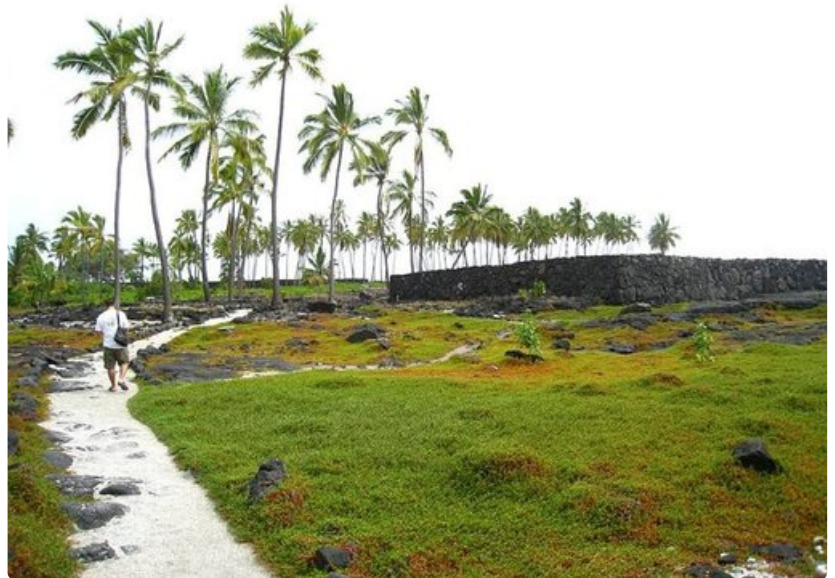
Pu'uhonua o Honaunaun kansallispuisto sijaitsee havaijilaisten pyhällä maalla.