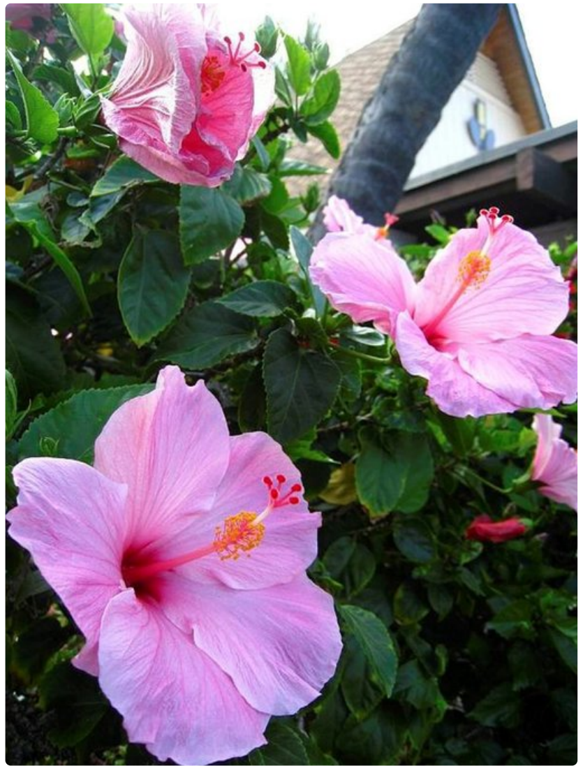
Värikkäät ja eksoottiset kukat kaunistavat Havaijin saaristoa.

Havaijilainen kulttuuri on sukua Polynesian kulttuurille, ja havaijilaiset ovat syystäkin ylpeitä rikkaasta kulttuuriperinnöstään. Useimmat osaavat ainakin jonkin verran paikallista, vokaalipitoista havaijinkieltä, joka maistuu suomenkielisten suussa hauskalta. Suurimpien hotellien hulatanssi- ja musiikkiesityksissä matkailijoita tutustutetaan Havaijin kulttuurin kulmakiviin, mutta tarkempi perehtyminen kiehtoviin havaijilaisperinteisiin on matkailijoiden keskuudessa valitettavan aliarvostettua. Kiinnostuneet voivat syventää kulttuurintuntemustaan esimerkiksi kehitussa Polynesian Cultural Centerissä Pohjois-Oahulla. Vierailun arvoinen on myös Big Islandilla sijaitseva Pu'uhonua o Honaunaun kansallispuisto, joka sijaitsee havaijilaisten muinaisella pyhällä paikalla. Pienessä ja rauhallisessa puistossa tutustutaan havaijilaisten menneisyyteen ja ihaillaan samalla merikilpikonnia sekä rannalla lepäilevää laiskanpulskeaa havaijinhyljettä. Keltaisten eristysnauhojen ympäröimänä pötköttävä uhanalainen hylje ei ole uteliaista katseista moksiskaan, vaan jatkaa päiväuniaan salamavalloista välittämättä.