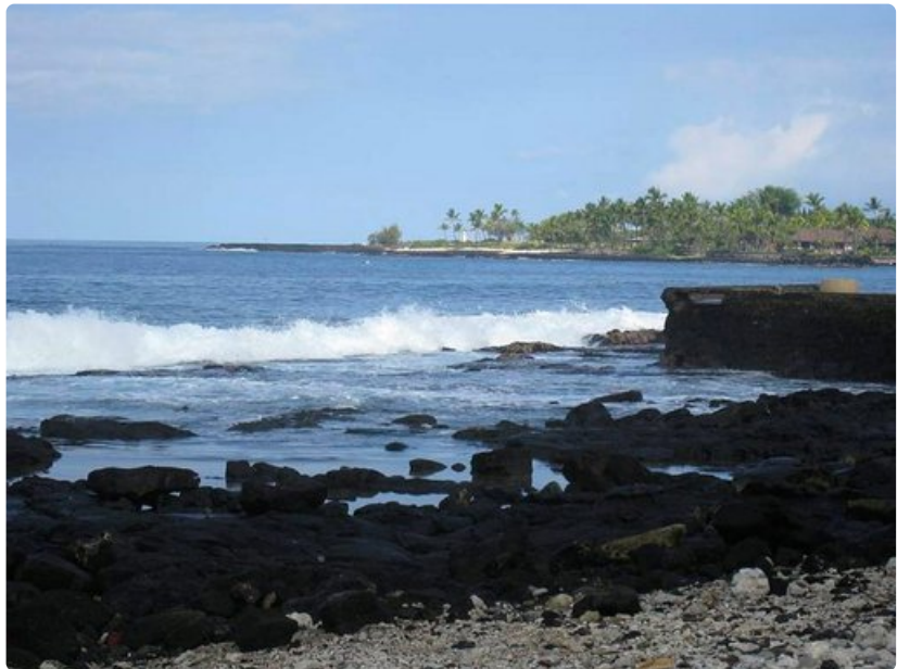
Tulivuorisaarilta löytyy myös karumpia rantoja.