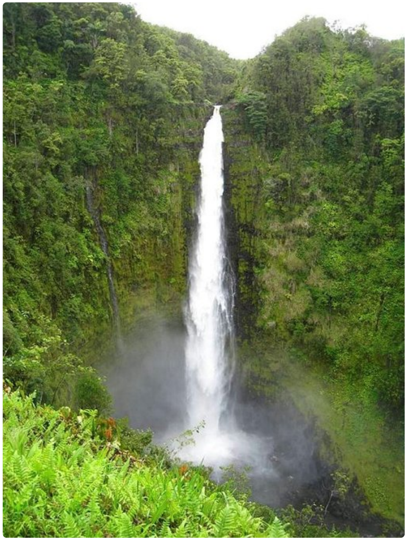
Akaka Fallsin vesiputous on piilossa keskellä sademetsää.