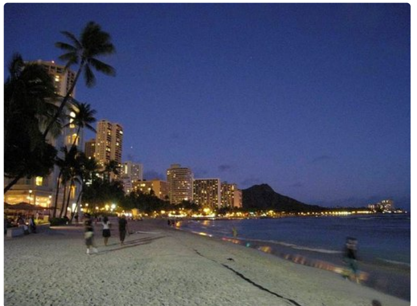
Auringonlasku Waikiki Beachilla on unohtumaton elämys.