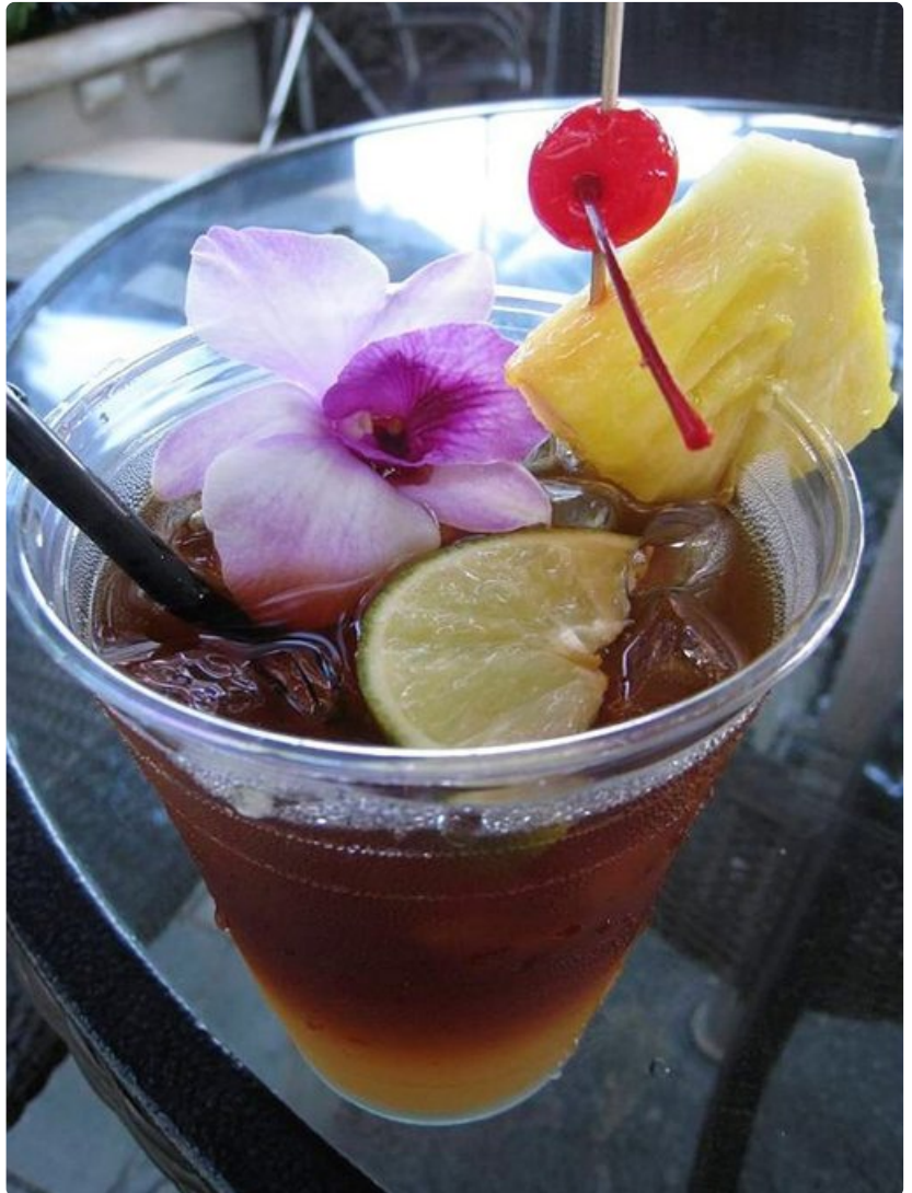
Havaijin tavaramerkki Mai Tai -drinkki maistuu parhaalta auringonlaskun aikaan.