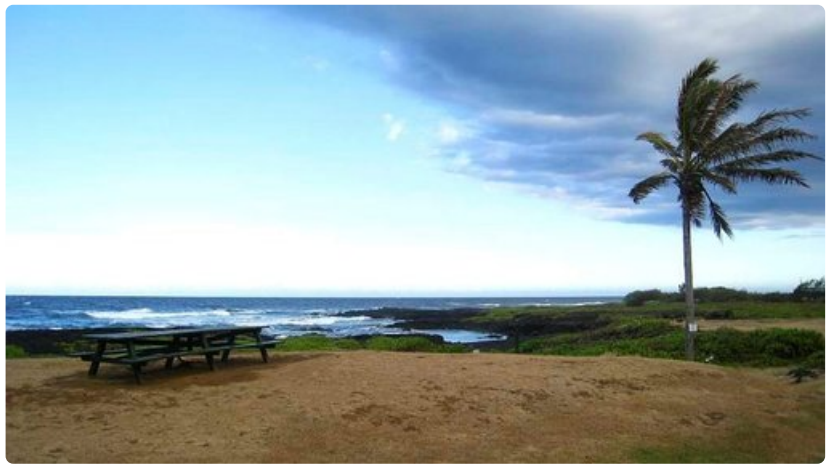
Big Islandin eteläkärjessä rantahiekka on mustaa.