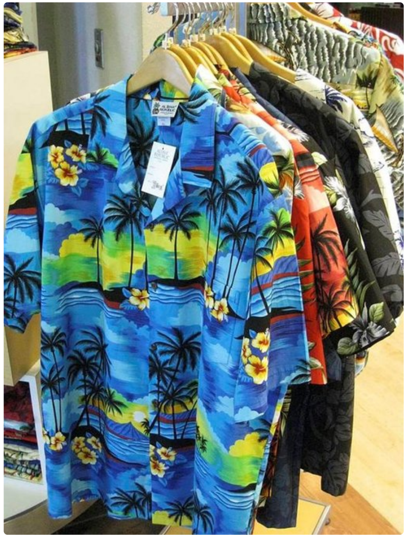
Värikkäät havaijipaidat kuuluvat katukuvaan kaikilla saarilla.