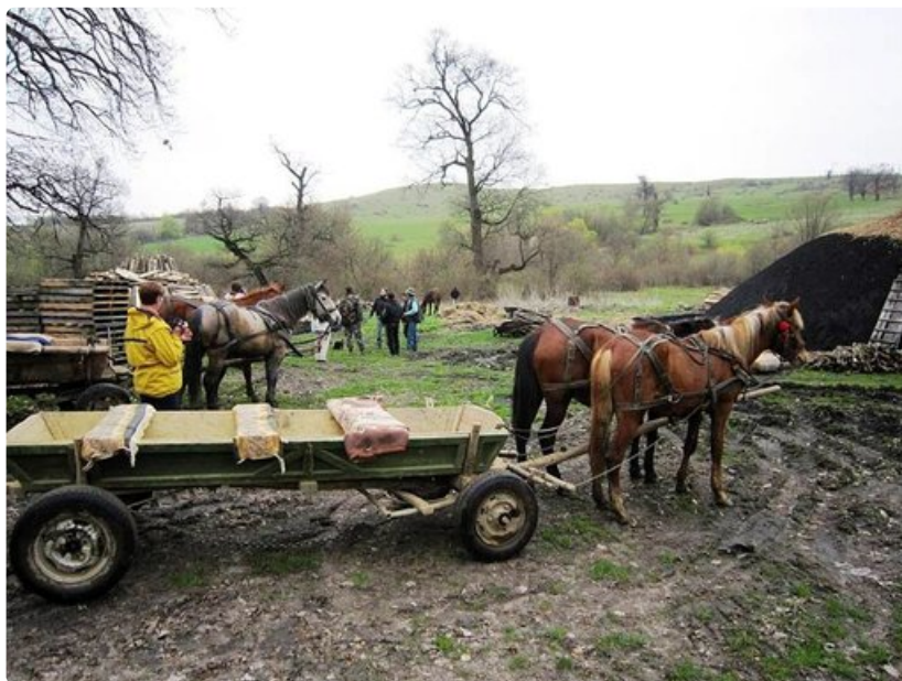
Hiilimiilulla sekä ajokit että ajomiehet saivat levähtää.

Matkustusasiakirjat: voimassaoleva passi tai henkilökortti