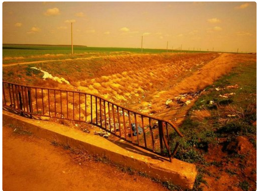
Valtavia viljelyaukeita rumentavat jätteet, joita paikalliset kantavat pimeään aikaan ojiin ja niiden pientareille.

Tuhat kilometriä Tonavaa erottaa Romanian naapureistaan, Bulgariasta ja Serbiasta. Joki muodostaa Mustanmeren rannikolla suiston, jonne muuttolinnut lentävät pakoon pohjoisen talvea. Vapaan liikkumisoikeuden EU:n sisällä takaavaa Schengen-sopimusta ei vielä sovelleta Romaniaan eikä naapurimaahan Bulgariaan. Saksa ja Ranska eivät olleet viime vuoden lopulla valmiit hyväksymään Unionin yksimielisyyttä vaativaa päätöstä. Eurovaluutan tavoiteajankohdaksi Romania on asettanut vuoden 2014, taloustilanteesta johtuen euron käyttöönoton oletetaan siirtyvän hamaan tulevaisuuteen. Nykyinen valuutta, uusi Romanian lei otettiin käyttöön vuonna 2005. Rahaa voi hyvin vaihtaa Henri Coandan lentokentän rahanvaihtopisteissä. Alkukevään päivänä pääkaupungin kansainvälinen kenttä on hiljainen. Kentältä on keskustaan matkaa 18 kilometriä ja jos ei ole ruuhkia, se vie parikymmentä minuuttia.