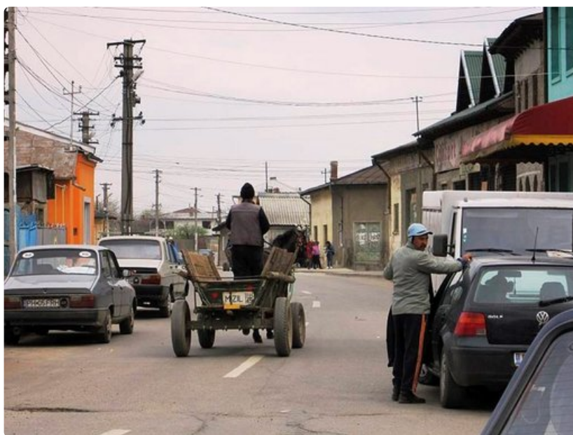
Hevoskärryt eivät ole harvinaisen näky Romanian maaseudulla.