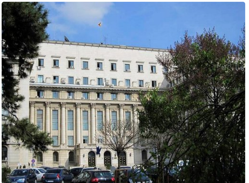
Kommunistisen puolueen Keskuskomitean rakennuksen parvekkeelta Ceausescu aloitti viimeisen puheensa ja josta hän pakeni helikopterilla joulun alla vuonna 1989.