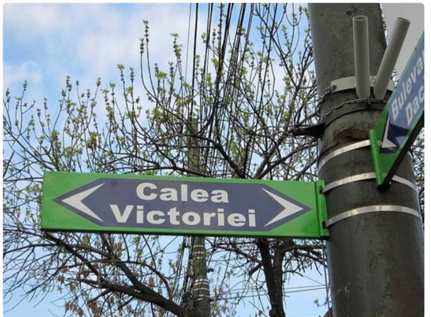
Bukarestin vanhin ja kuuluisin katu.