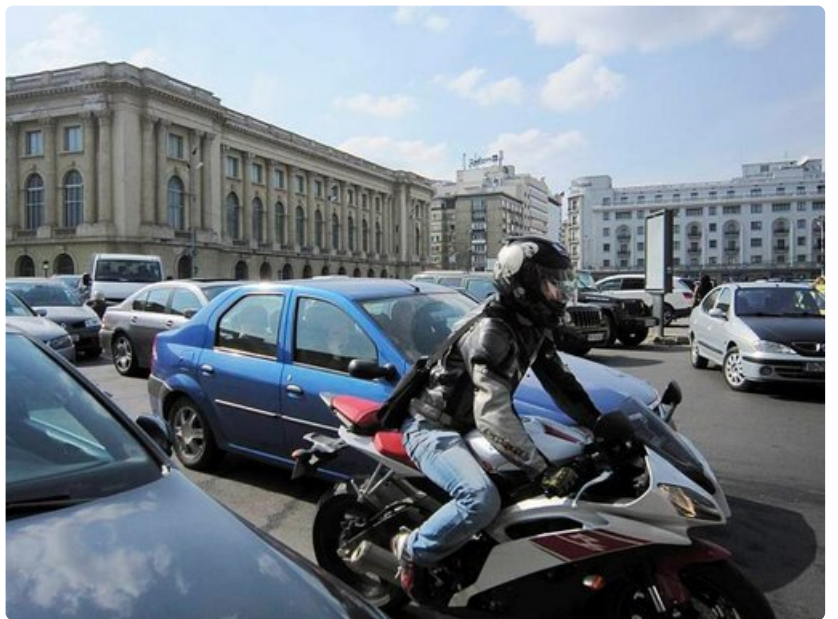
Bukarestin liikenne on kaottista. Kävellessä on mielenkiintoista seurata kaupunkilaisten taitoa selviytyä ruuhkassa.