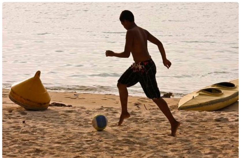
Paikallisten suosimia urheilulajeja ovat varsinkin rantalentopallo ja jalkapallo. Ulkopuoliset ovat tervetulleita osallistumaan huvitteluun.