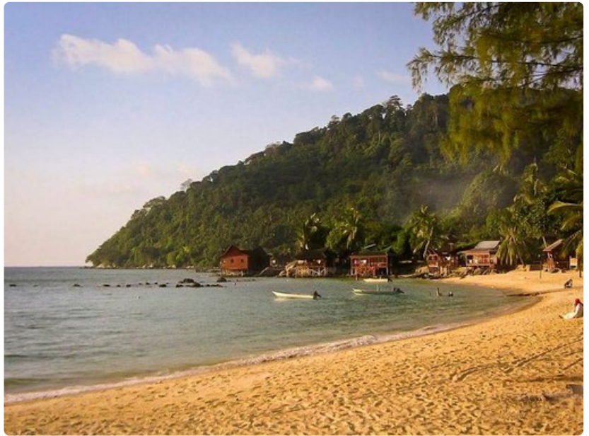
Tiomanin pohjoiskärjen Salang Beach on varsinkin reppumatkailijoiden suosiossa.