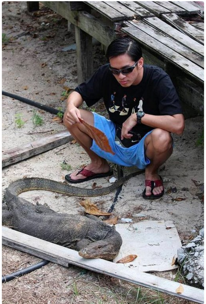
Varsinkin Perhentianin saariryhmällä törmää usein jättimäisiin, mutta täysin harmittomiin monitoriliskoihin.