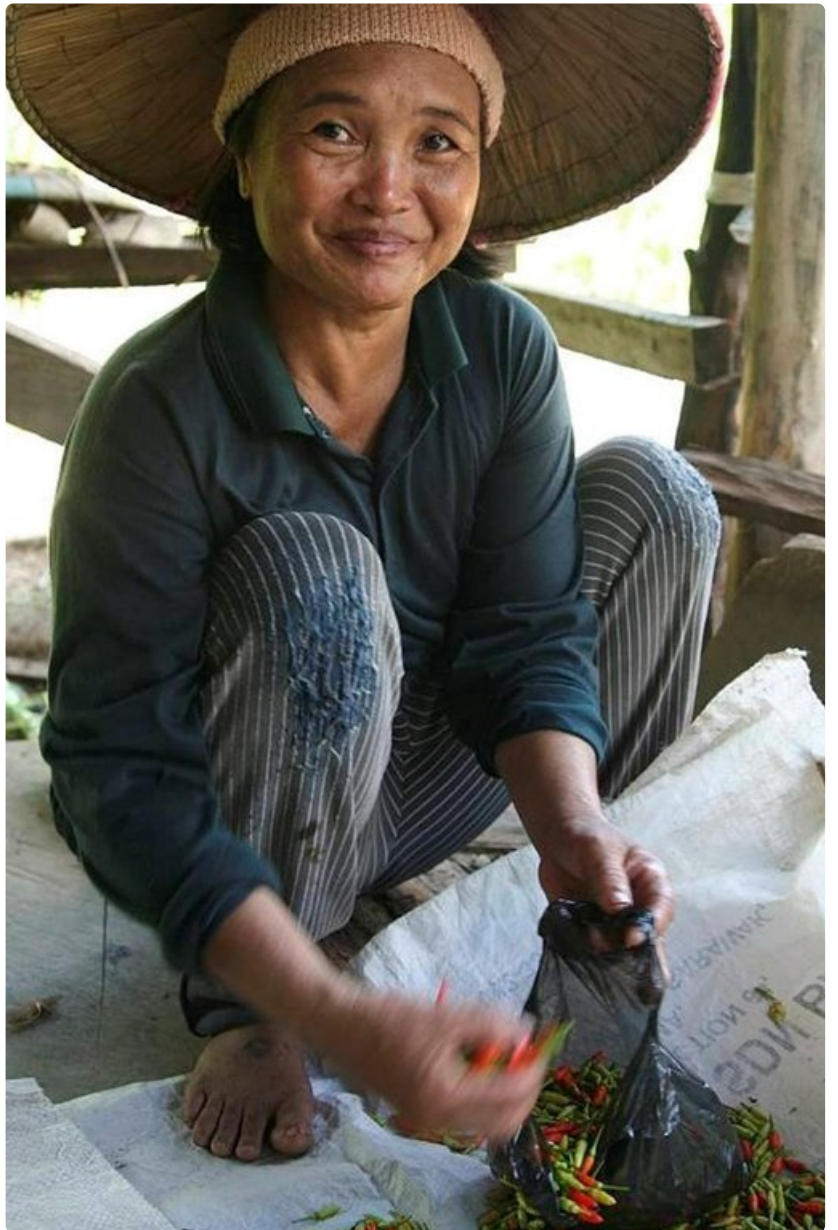
Saarten väestö on ystävällistä ja auttavaista. Nainen myi markkinoilla tulisia chilejä.