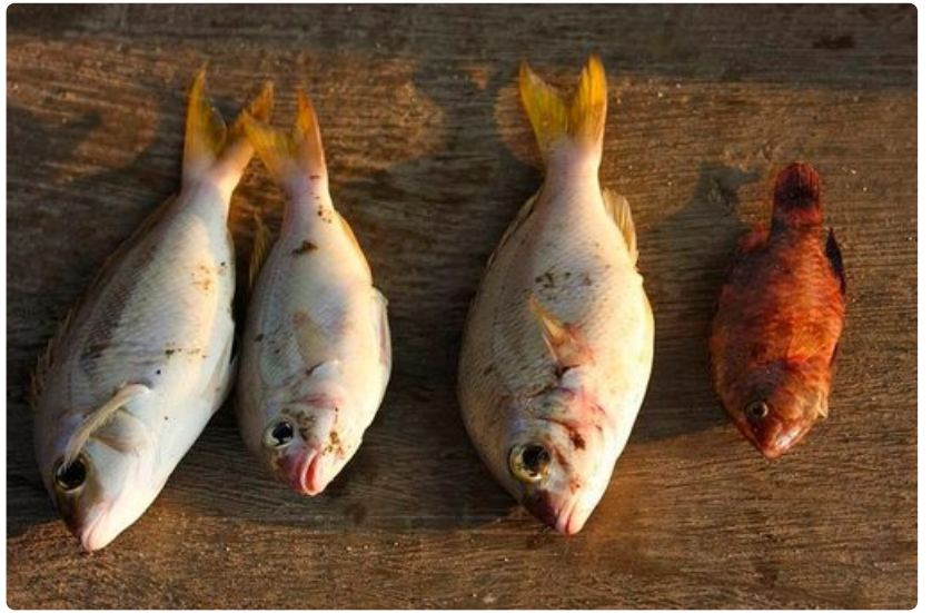
Illalla ravintolat valmistavat eksoottiset saaliit pientä lisämaksua vastaan.