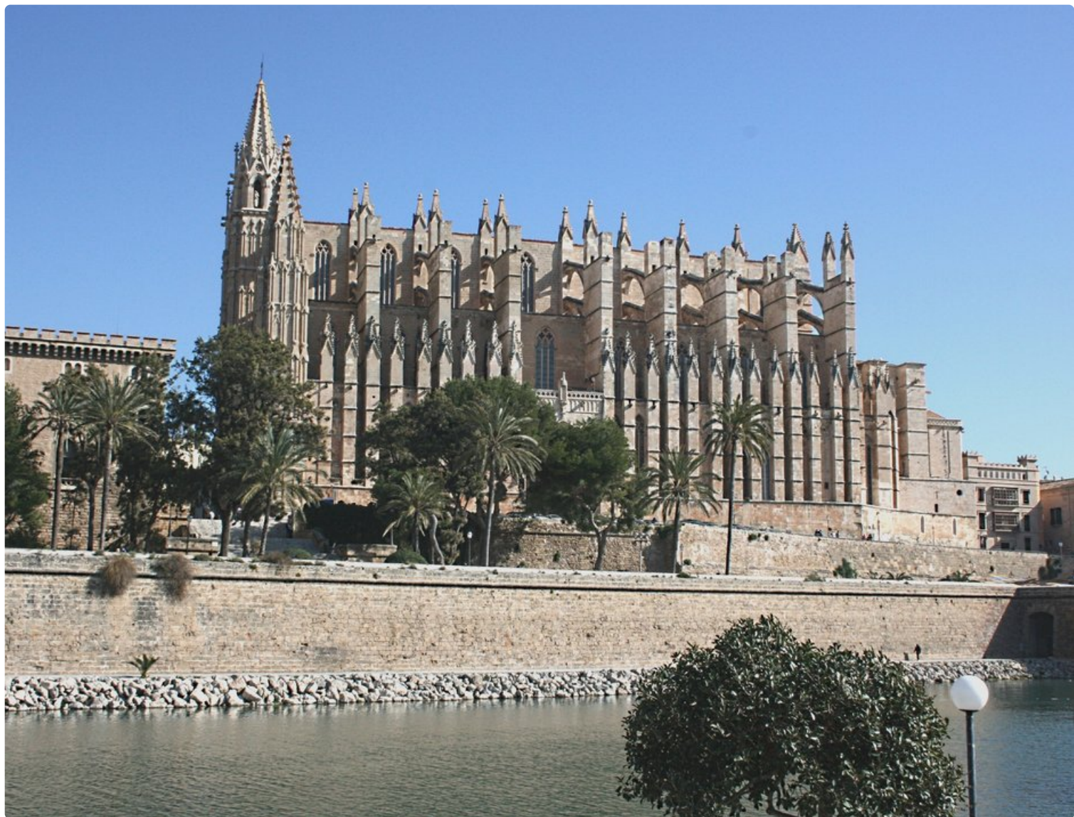
Palman kaupunki uhkaa kovilla otteilla turistihuoneistoja.