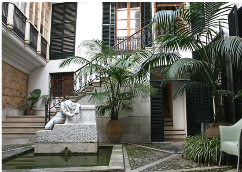
Tähän asuntoon Palman vanhassakaupungissa ei turisteilla ole todennäköisesti asiaa en kesänä.