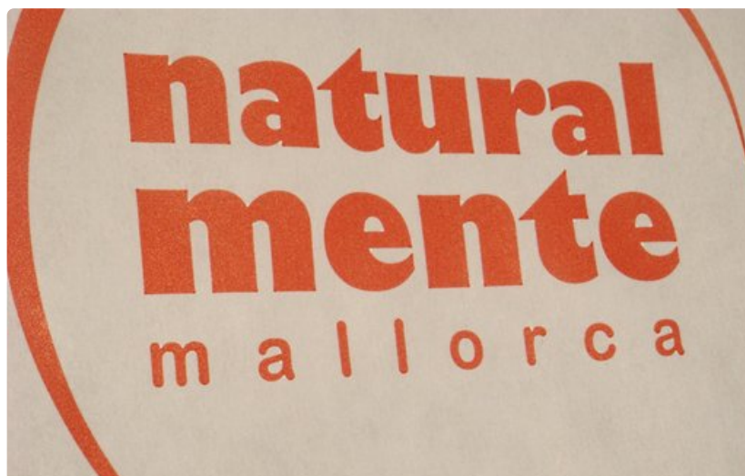
Mallorca luonnollisesti -kampanja on saamassa kovan kolauksen.