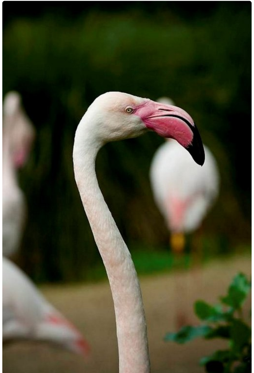
Eläimiä kuvatessa kannattaa käyttää pitkää zoom-linssiä.