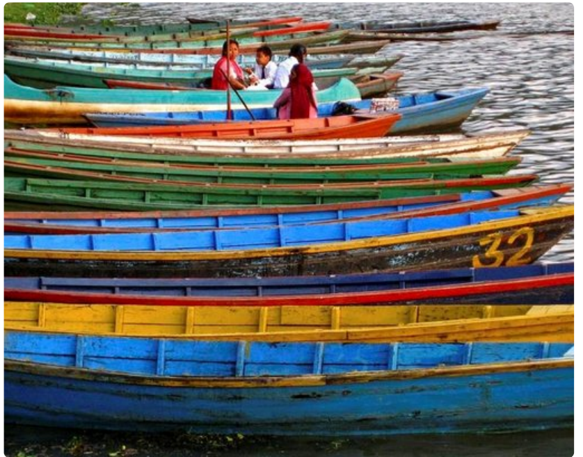
Erilaisia kuvakulmia kokeilemalla löytää sen oikean.