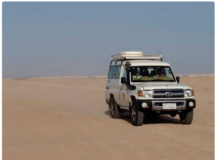
Maastoautossa matka beduiinikylään taittuu.