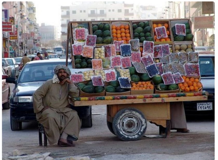
Supermarketeissa hinnat ovat kiinteät. Katukauppailta saa niin elintarvikkeet kuin matkamuistotkin huokeammalla.