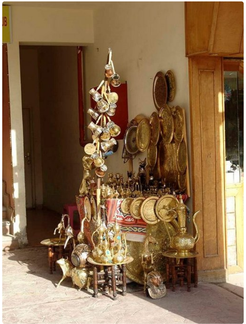
Messinkiastiat, huivit, patsaat, t-paidat, laukut, mausteet, tupakat ja korut löytävät uudet omistajansa.

Poikkeustilanteet: Jos kielitaito riittää, kannattaa seurata kansainvälisiä uutislähetystyksiä. Kun tilanteen vakavuus on selvinnyt, voi loppumatkaan suhtautua seikkailuna ja jos matkatoimistosta niin neuvotaan, jatkaa lomailua normaalisti. Suomen ulkoministeriön ohjeita kannattaa seurata, joskin ne on usein annettu niukkojen tietojen pohjalta.