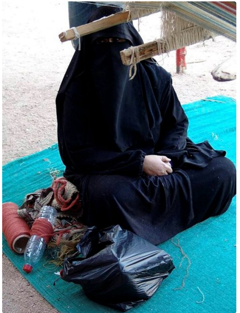
Egypti on miesten maa. Naisia ei näy asiakaspalvelutehtävissä.