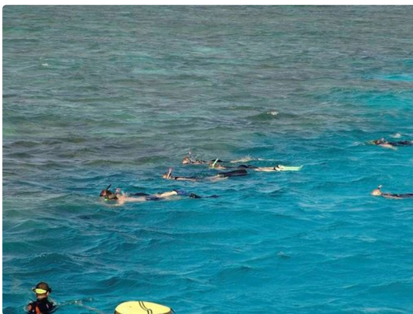
Merenpinnan alapuolella on värikästä ja kaunista.