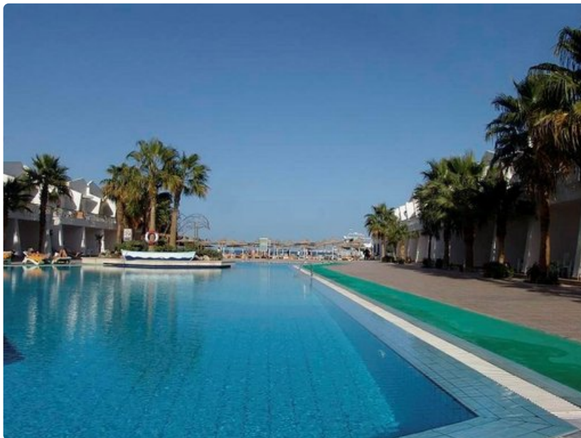
Lyhyt matka aamu-uinnille.

Tarkoitus on myös päästä tutustumaan Punaisenmeren vedenalaiseen, satumaisen kauniiseen korallipuutarhaan.