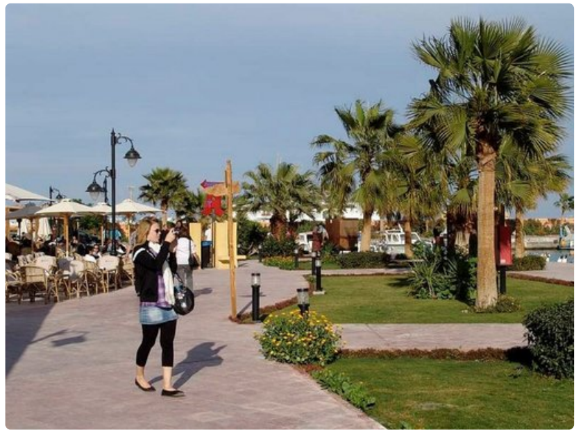
Hurghadan vehreät alueet ovat vastapainoa kuivuudelle.