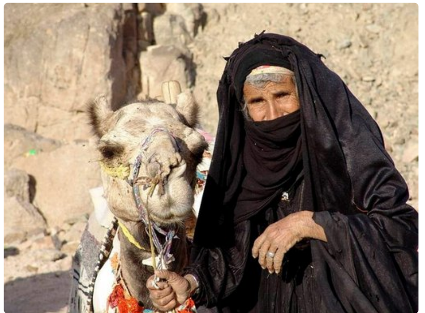
Autiomaan asukkailla ei ole virallista henkilöllisyyttä, eikä heidän lukumääräänsä tiedä kukaan tarkasti.