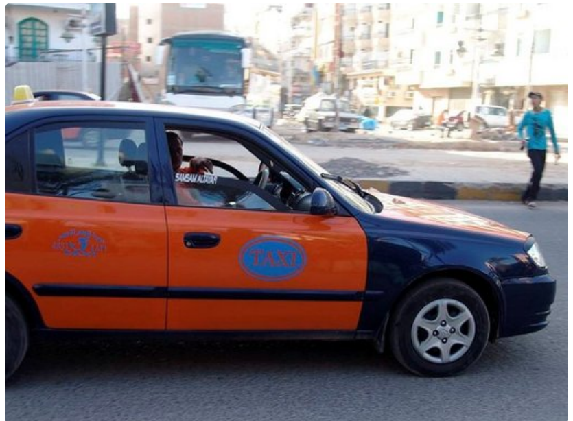
Taksinkuljettajat tööttäilevät turistien kohdalla saadakseen asiakkaita.