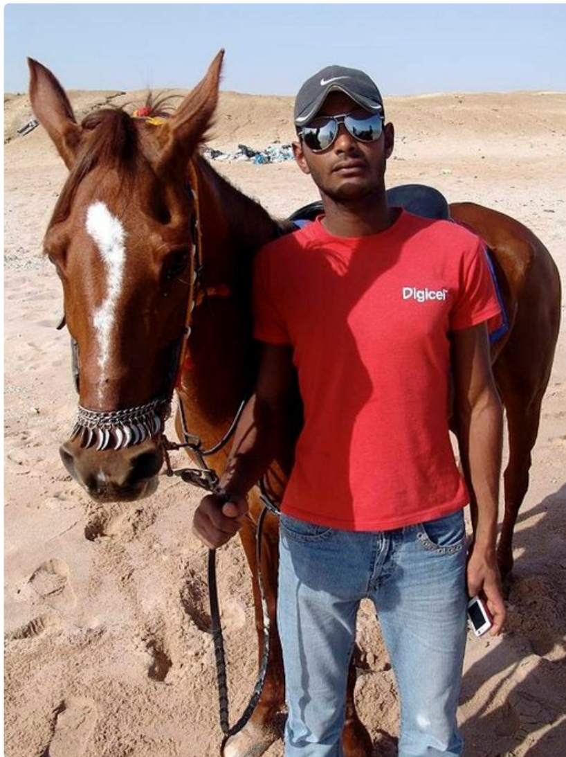
Hevossafarilla pääsee ratsastamaan myös uimarannalle.