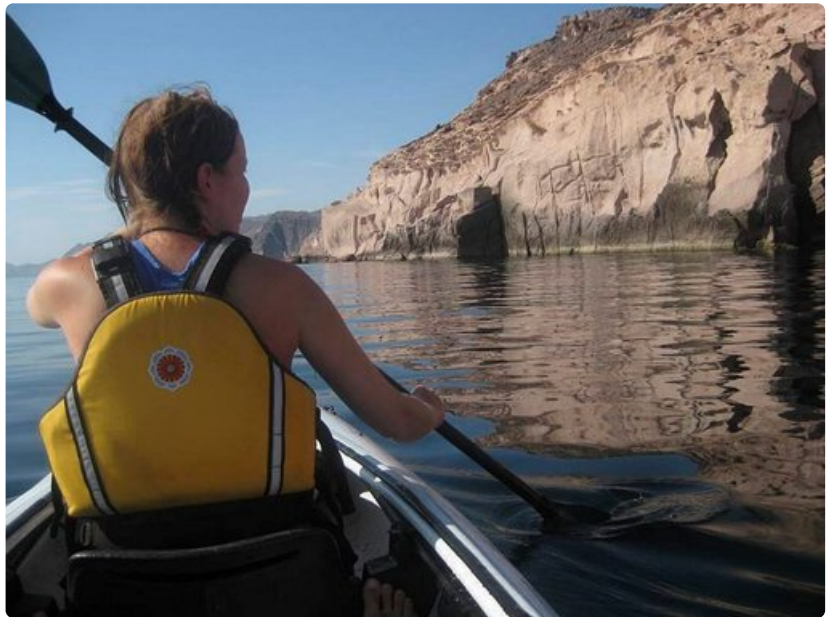
Pelastusliivit on syytä pitää päällä tynnestä säästä huolimatta.