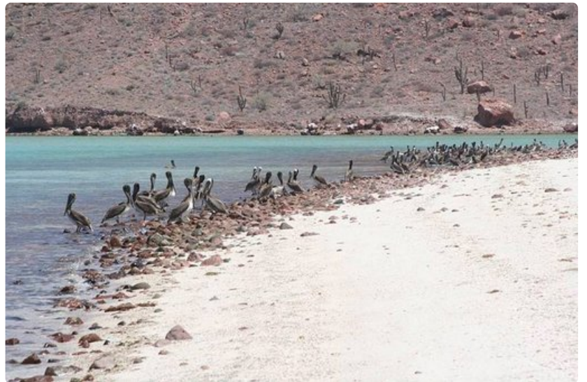
Pelikaanit kansoittavat aluetta kenenkään häiritsemättä.