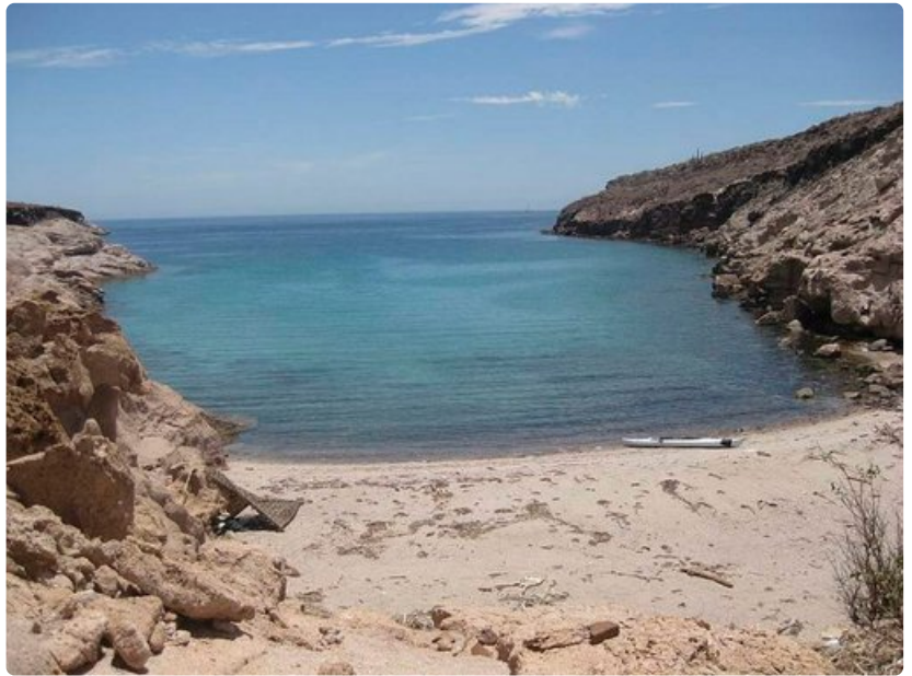
Muut kulkijat eivät häiritse lepotaulla.

Paras matkustusaika: La Pazin aluetta pidetään ympärivuotisena kohteena. Viileimmät tammi- ja helmikuu ovat monien mielestä paras hetki matkustaa. Kuuminta on heinä-elokuussa. Sateisin kuukausi syyskuu, mutta sade ei yleensä ole vakava ongelma.