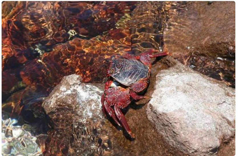
Ravut välttelevät uusia tuttavuuksia sulautumalla kallioperän väreihin.