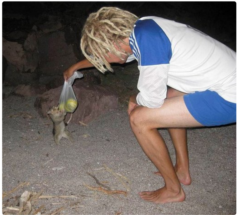
Varaudu heräämään yöllä pelottoman omenarosvon hyökkäykseen.