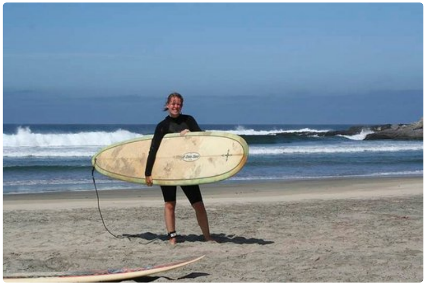
Baja California Surin alueelta löytyy useita suosittuja surffausrantoja.