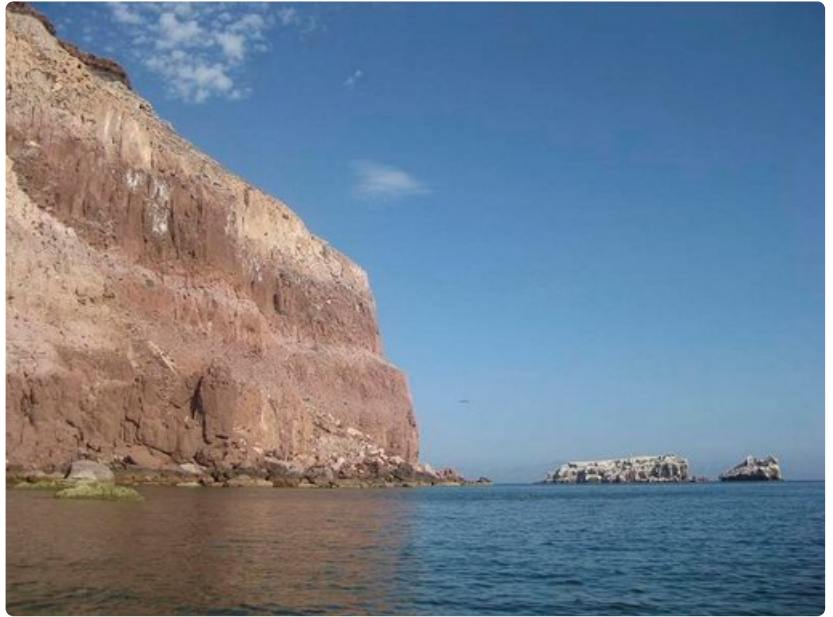
Rapautuva kiviaines muodostaa paikoin lähes pystysuoria rantaseinämiä.