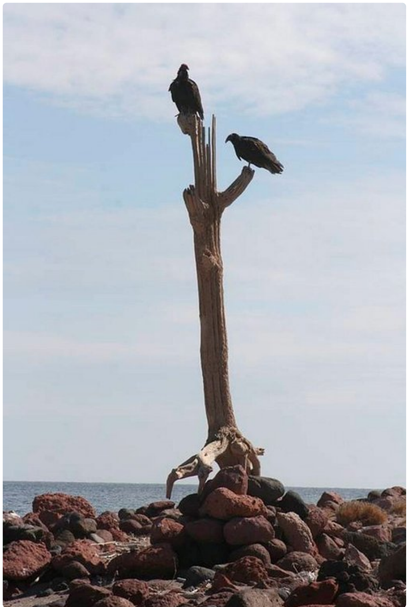
Saaren ainoa puu on ilmeisesti saapunut paikalle kellumalla.