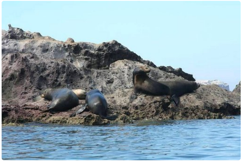
Kalaa on viime aikoina riittänyt, koska merileijonat eivät näytä erityisen nälkiintyneiltä.