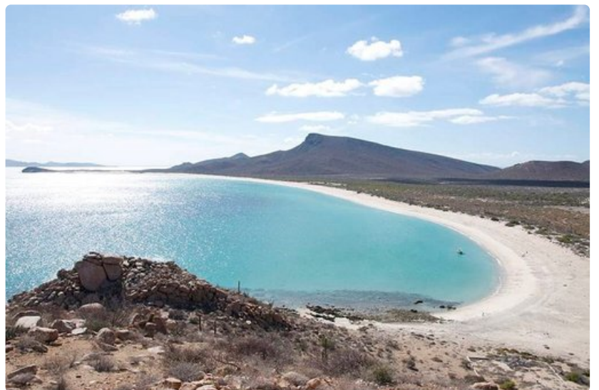
Eräs saarten rannoista on äänestetty maailman kauneimpien joukkoon. Joka tapauksessa ne kaikki sopivat loistavasti satunnaiseen paussiin uimiselle ja välipalalle. Espirito Santos beach.