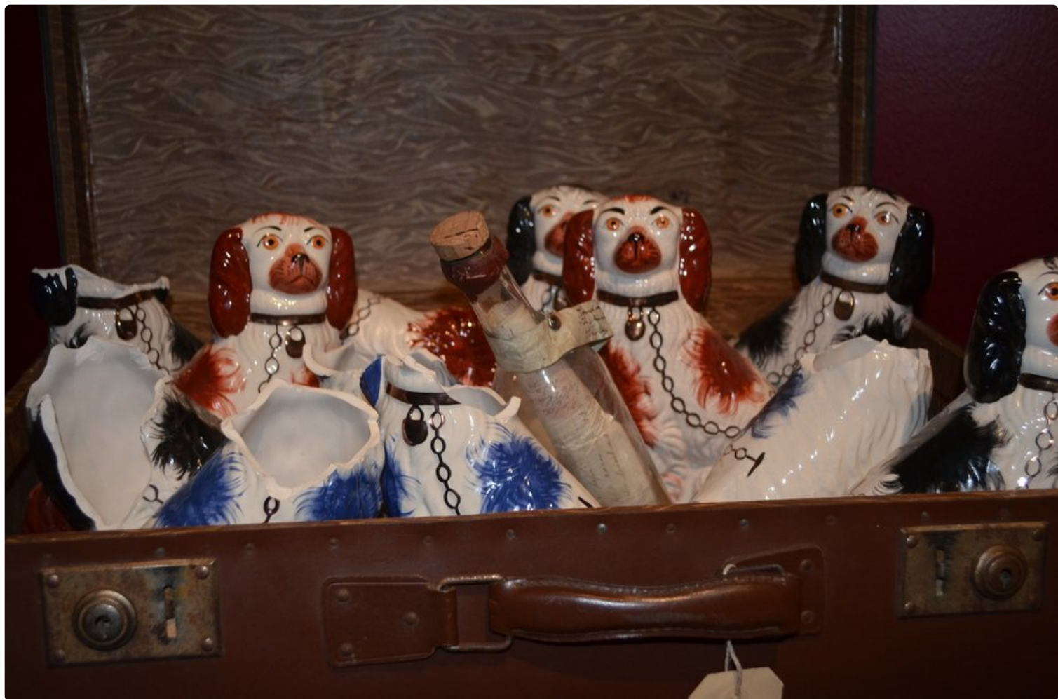
Merimiehen koirat odottivat kotona.