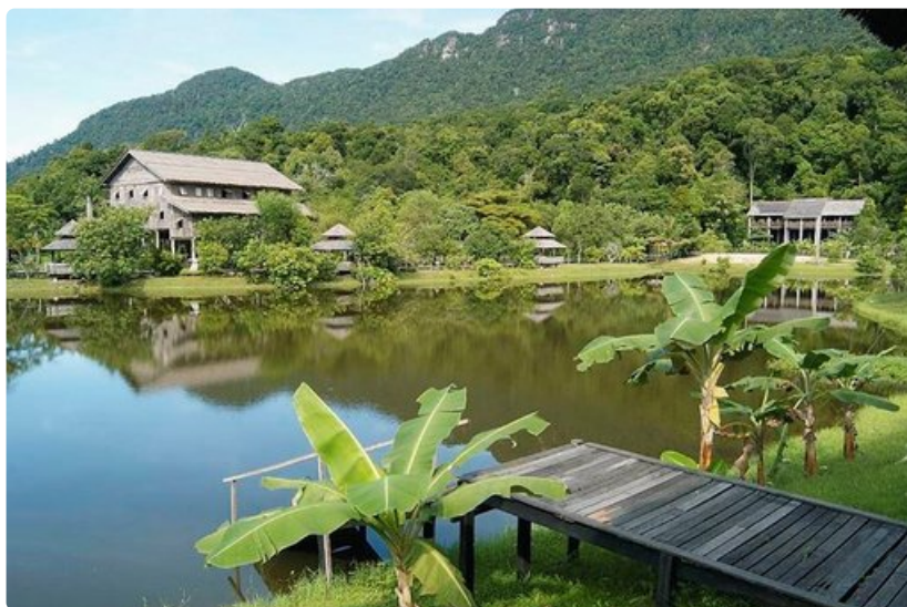
Perinteisiä pitkätaloja Borneossa.