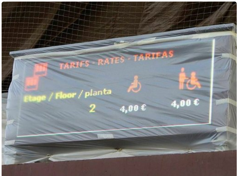
Liikuntarajoitteinen henkilö maksaa Eiffel-tornin lipusta alennetun hinnan ja avustaja kulkee mukana ilmaiseksi.