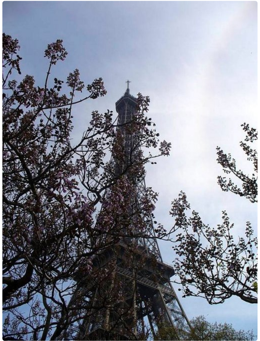
Eiffel-tornin kakkoskerrokseen pääsee myös pyörätuolilla liikkuva.

Hyvä vaihtoehto on myös Musée d'Orsay, 1800-luvun taiteen museo, josta saa lainaksi pyörätuolin. Kaikkiin kolmeen kerrokseen pääsee hissillä ja luiskoja on riittävästi. Suuri keskikäytävä on täynnä veistostaidetta, joka avautuu upeana avaran lasikatkon ansiosta.