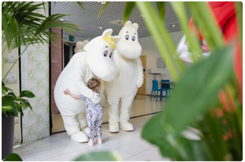
Tapahtumassa pääsee halaamaan muumeja.

Ravintola Tuhto palvelee tapahtumapäivänä laajennetuin aukioloajoin klo 11–21. Pelaamiseen innostava Game On -kesänäyttely on pidennetyksi avoinna klo 9–21, ja Tampere-talon lipunmyynnistä voi ostaa tarjoushintaisia lippuja syksyn tapahtumiin.