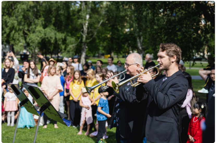
Tampere Filharmonian muusikot esittävät trumpeteilla Länge leve Snork -fanfaarin, jonka on säveltänyt Lauri Kilpinen.