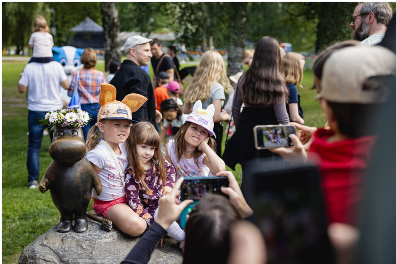
Muumimuseo seppelöi Muumipeikko-patsaan vuosittain Tove Janssonin syntymäpäivän kunniaksi. Perinne viittaa Janssonin omaan tapaan juhlistaa merkkipäiväänsä.