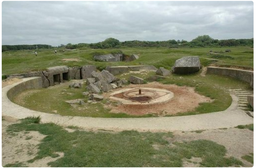
Maanalaisia käytäviä pitkin pääsi ammusvarastolle sekä majoitustiloihin.