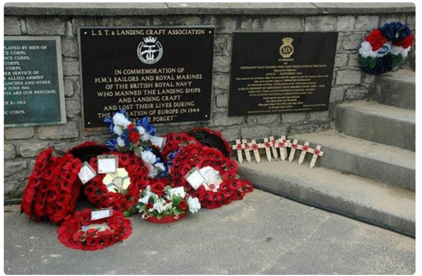
Kukkia, seppeleitä sekä puisia muistoristejä tuodaan edelleen muistomerkeille.