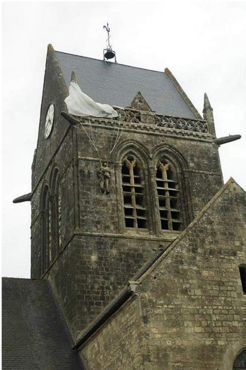
Sotamies John Steele riippumassa laskuvarjostaan kirkon tornissa. Hän haavoittui lievästi, mutta menetti kuulonsa, sillä kirkonkelloja soitettiin syttyneiden tulipalojen vuoksi.

D-Day on englanninkielisessä sotilassanastossa käytetty ilmaus tärkeän operaation alkupäivämäärästä.