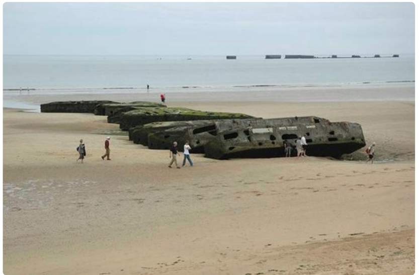
Vanhoja ponttonilaitureita Arromanches'in rannalla.