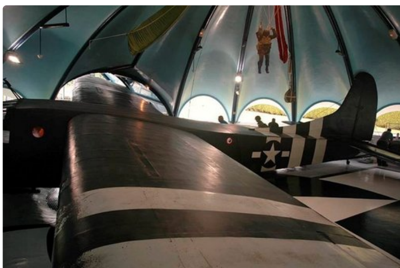
Harvinainen liitokone ja puinen laskuvarjohyppääjä.