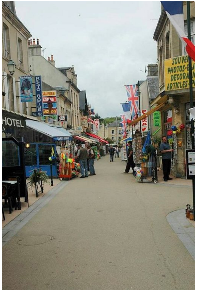
Matkamuistomyymälöitä on vierä vieressä.