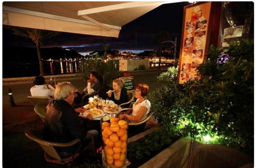
Leppeä ilta on laskeutunut Solleriin. Ravintoloissa nautitaan maukkaista päivällisistä.