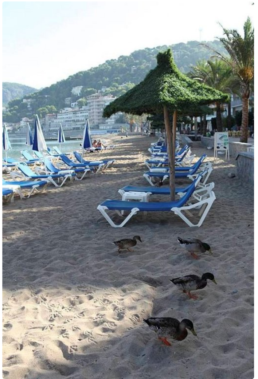
Aamuinen siivouspartio puhdistaa uimarantaa.