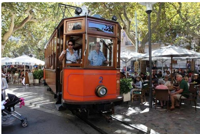
Museoratikka on saapunut vilkkaaseen Solleriin, joka lauantaisin täyttyy markkinaväestä.