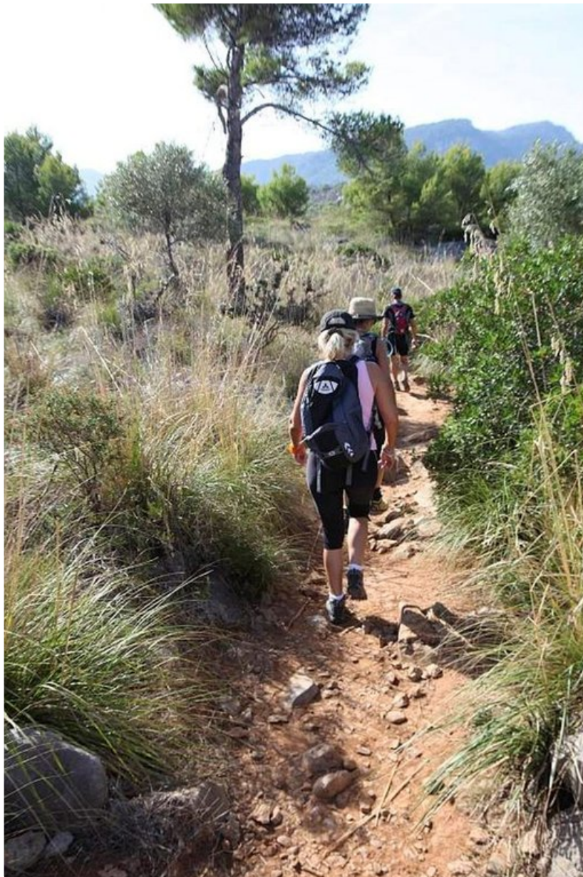
Patikkareiteillä voi varautua myös kivikkoisiin polkuihin.