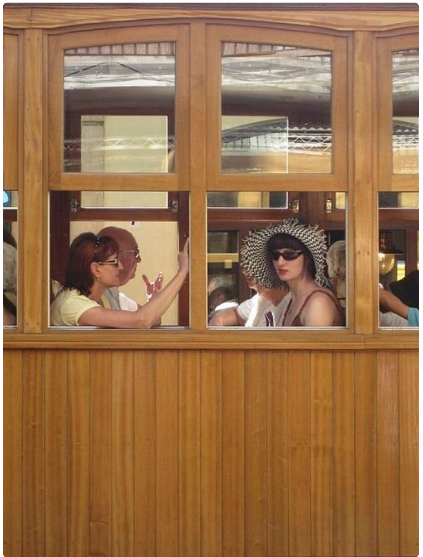
Paikan tyylisiin sopivassa asussa rouvat lähdössä ratikkamatkalle Puerto de Sollerista Solleriin.

Vaikka paikka on pieni, lomanviettomahdollisuuksia riittää. Aluksi voi lähteä idyllisellä ratikalla muutaman kilometrin päähän Solleriin, jossa on putiikkeja, kahviloita sekä markkinat lauantaisin. Silloin pikkukaupungin aukio ja kauppahallin edusta kuhisee paikallisia ja matkailijoita, jotka täyttävät katukahvilat. Myytävänä on serrano-kinkkua, chorizo-makkaraa, juustoja, kuivattuja hedelmiä ja erilaisia pähkinöitä. Eikä sieltä puutu markkinatavaraakaan, koruja, tauluja ja käsitöitä. Kirpputorilta voi löytää aarteita, jos niitä on etsimässä. Palmaan pääsee nopeasti. Sollerin asemarakennus on maailman vanhin ja rakennettu ennen kuin rautateitä oli edes keksitty, vuonna 1606. Rautatie Palmasta Solleriin rakennettiin vasta vuonna 1912.