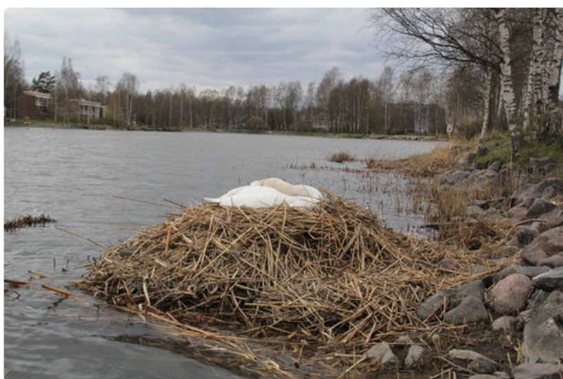
Joutsen on tehnyt muhkean pesän, joka kestää pienen kevättulvankin.