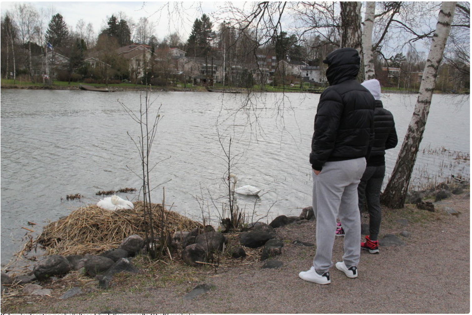
Kyhmyjoutsenten pesä sijaitsee kävelytien reunalla lähellä vesirajaa.