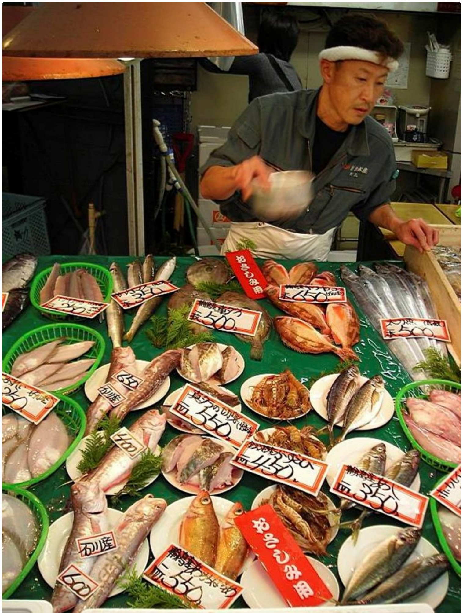
Omicho-torilla nautittu sushi on taatusti tuoretta.