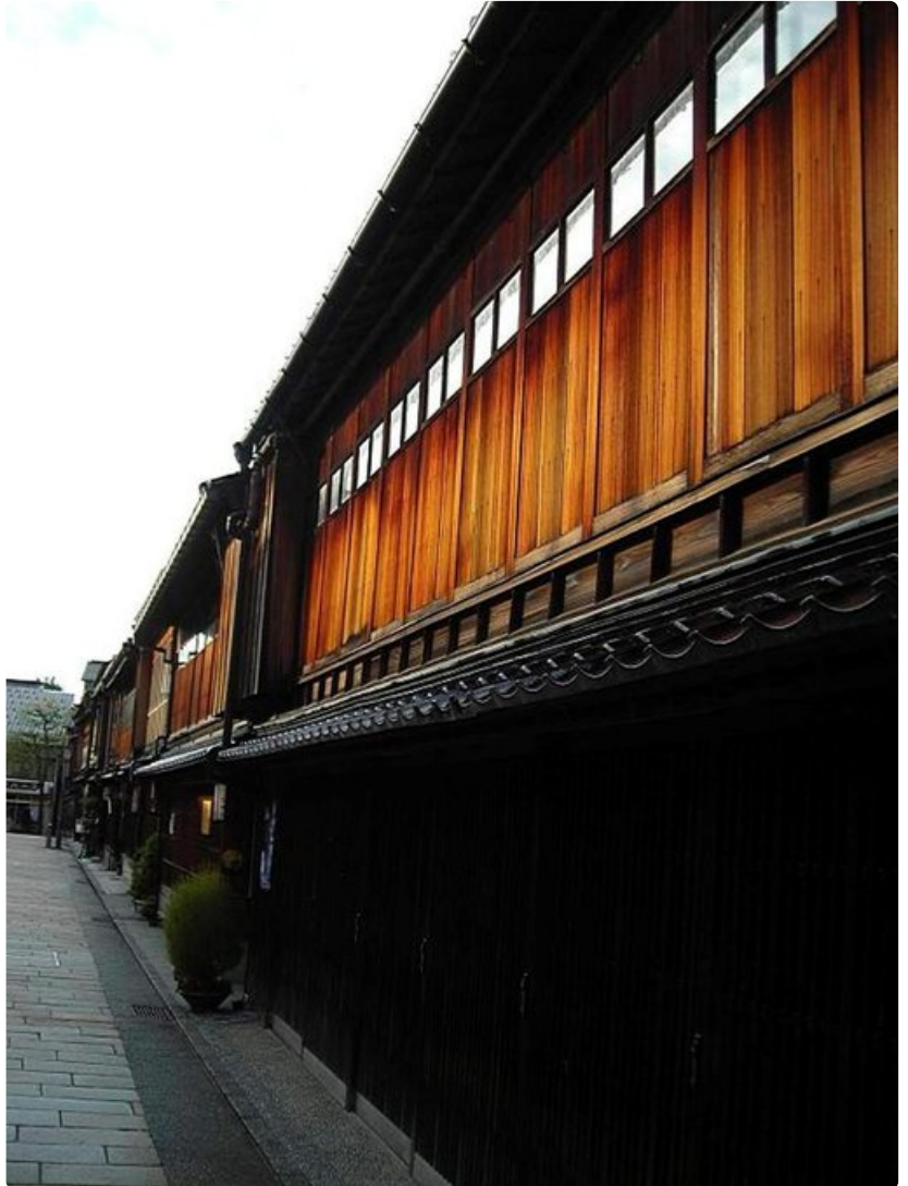
Vanhoissa kortteleissa voi lennähtää vuosisatoja taaksepäin.