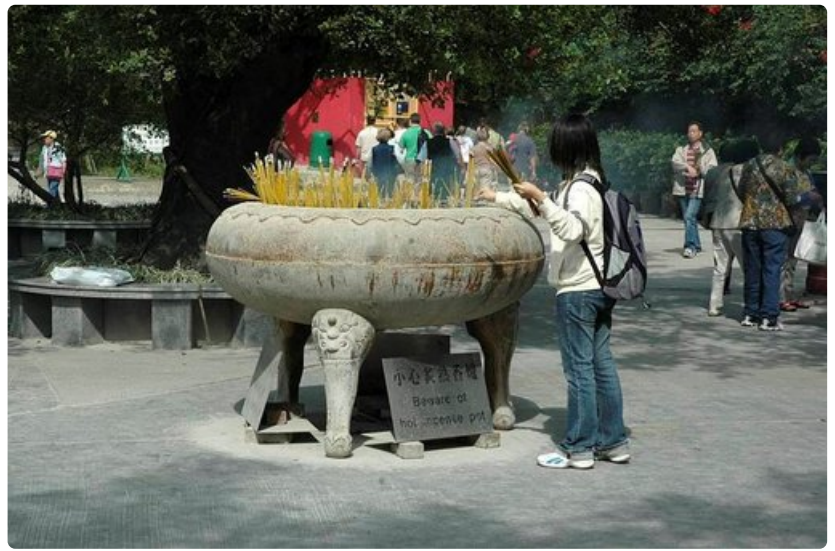
Perinteinen tapa on syyttää suitsukepukko henkien miellyttämiseksi.

Aikaero Suomeen: talvella 6 tuntia ja kesällä 5 tuntia edellä Suomen aikaa