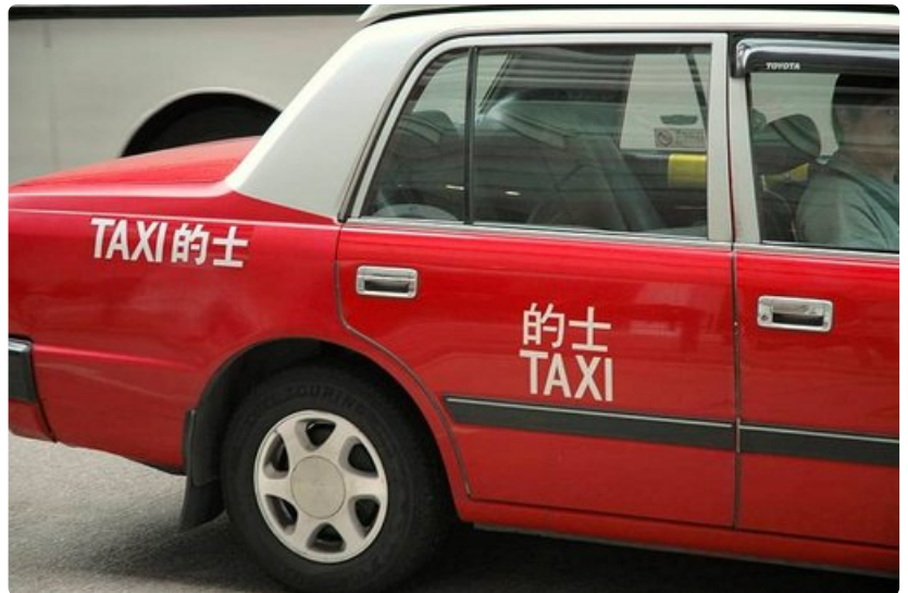
Taksit on merkitty eri värein ja vihreävalkoinen taksi saa ottaa kyydin ainoastaan lentokentältä, sinivalkoinen Lantaun muilta alueilta ja punaharmaat mistä tahansa.