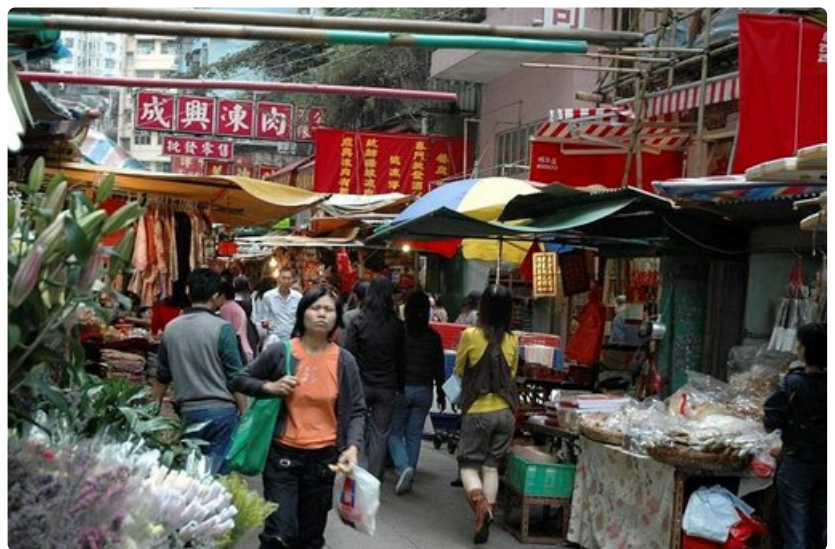
Kaduilta voi ostaa hedelmiä, vihanneksia, nuudeleita, säilöttyjä käärmeitä tai sammakoita. Proteiinia saadaan koppakuoriaisista tai muista hyönteisistä.

Hongkong on edullinen , mitä tulee asumiseen, syömiseen tai ostoksiin. Yön kahdelle korkeatasoisessa hotellissa Kowloonissa saa 55-75 eurolla ja aamiaiset ovat tavan mukaan monipuoliset ja runsaat. Ruokapaikkoja on saksalaismakkaraa tarjoavista ravintoloista sushibaareihin ja mikäli tyytyy syömään katuravintolassa, saa vatsansa täyteen noin kolmea euroa vastaavalla summalla. McDonald's- ja olutindeksin mukaan Hongkong on edullinen. Big Mac maksaa hieman alle kaksi euroa ja paikallinen olut saman verran.