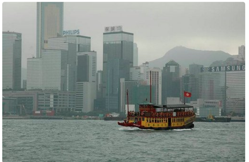
Vaikka Kowloonin meneekin tunneli, on lauttamatka yhä suosittu.