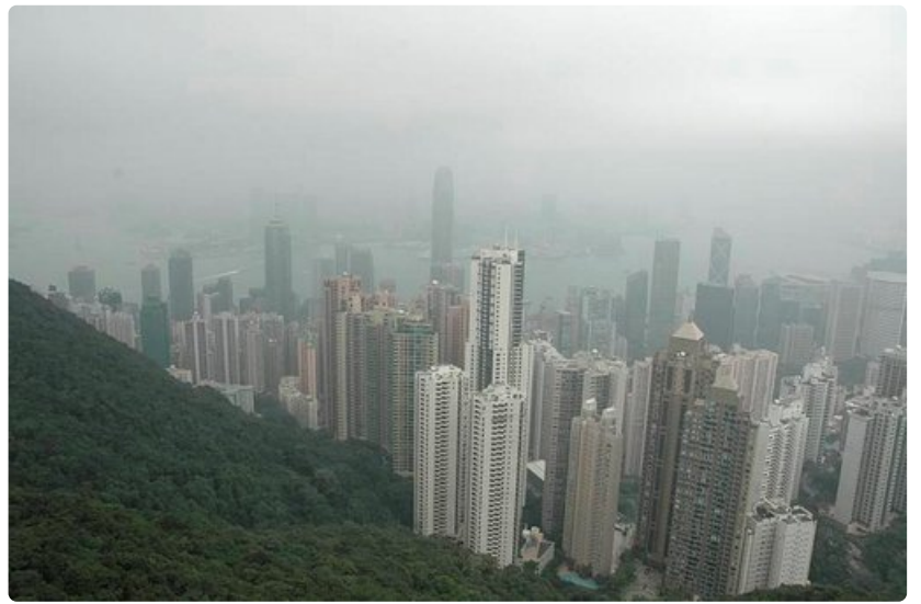
Alue lentokentän ja istuvalle Buddhalle vievän köysiradan lähellä on maailman tiheimmin asuttu lähiö, jossa asuu 6500 ihmistä neliökilometrillä.