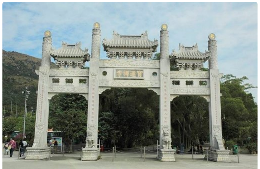
Portin teksteissä on onnentoivotuksia.