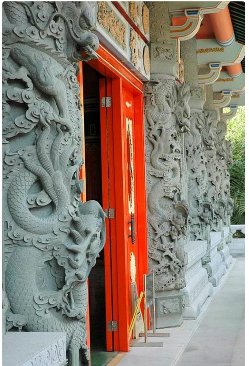
Taidokkaat ornamentit koristavat temppelin sisäänkäyntiä.