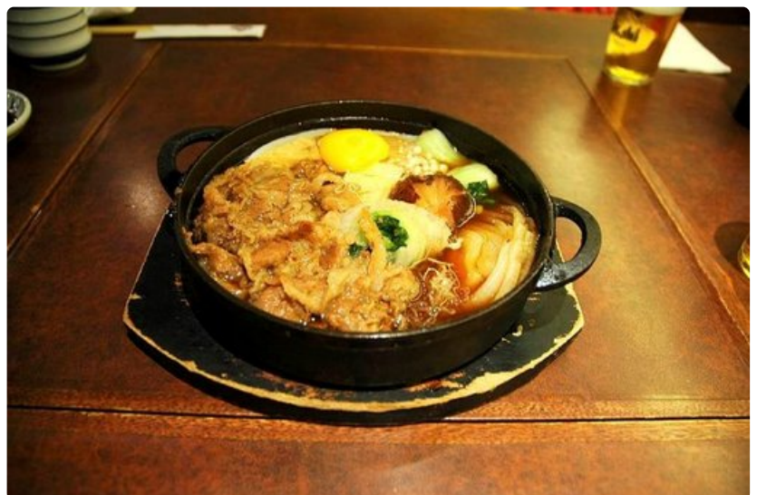
Ruoka on kadunvarsiravintoloissa maittavaa ja edullista.