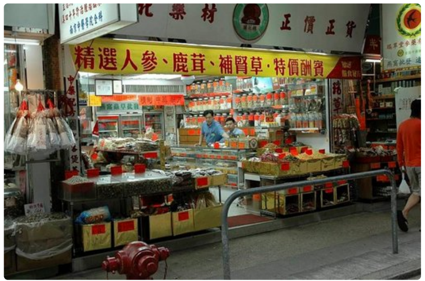
Tyypillinen pikkupuoti aukeaa, kun omistaja herää ja menee kiinni, kun alkaa nukuttaa.