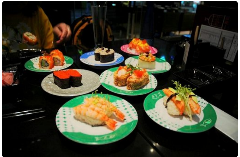
Myös Hongkongissa saa sushia monessa ravintolassa.