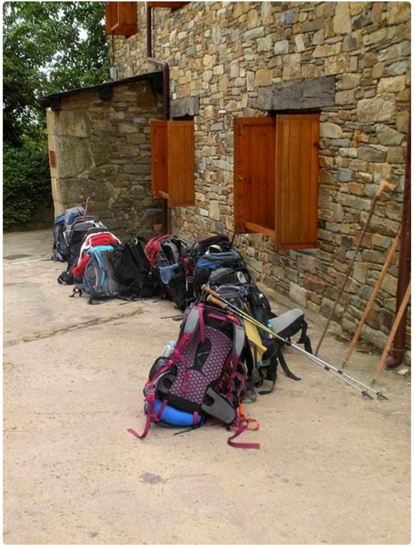
Rabanal del Camino. Rinkat jonottavat luostariin.