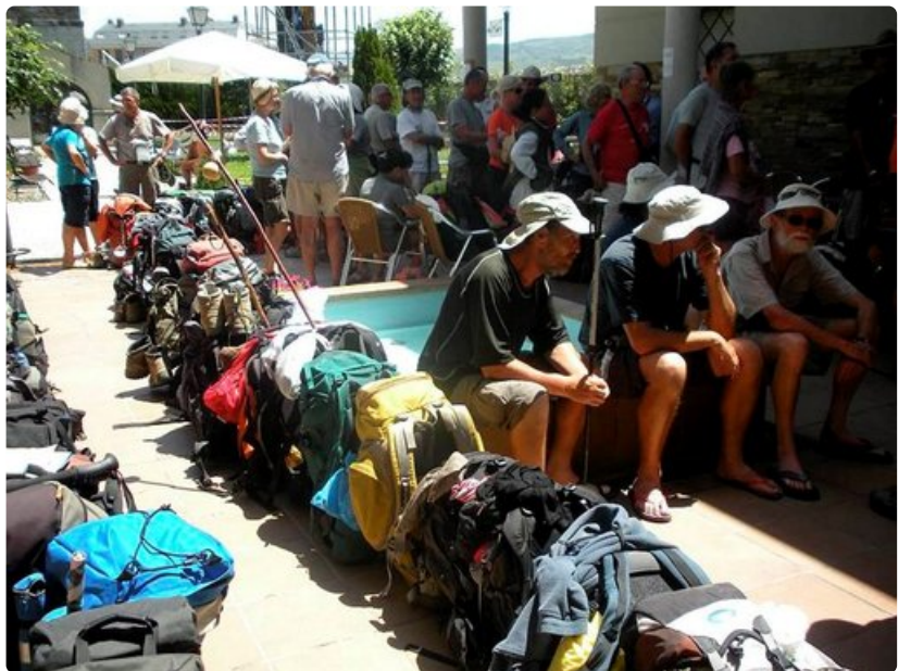
Ponferrada. Tunnelma alberguen sisäpihalla.