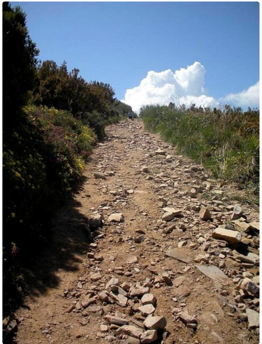
Kivinen vuoristopolku kohti Leonia.

El Burgo Ranero. Aurinko on laskenut vaeltajan takana. Katson ohii liiteleviä lintuja, narulla kuivuvia vaatteitani. Kuulen koiran ulvovan. Takanani on kirkontorni. Sen katolla on haikaran pesä. Auringon viimeiset säteet valaisevat pesän oranssinpunaiseksi. Tunnelma on kaunis - otan pyykkini ja menen sisälle. Ensi yönä nukun hyvin.