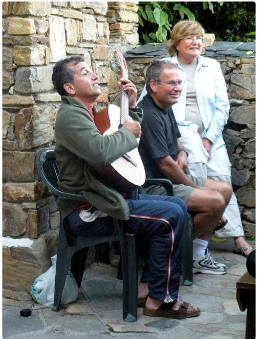
Kitara soi pihamaalla.

Teologi lumoutuu hämyisän kirkon tunnelmasta. Pyhimyspatsaat ja luiden edessä rukoileminen yhtä aikaa ihmeyttävät ja herättävät kunnioitusta. Ne puhuvat kieltä, jota mieli ei voi ymmärtää, mutta jonka sanoma välittyy rukoilevan naisen kasvoilta.