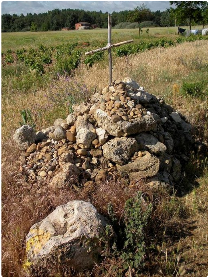
Vaeltajan pystyttämä risti.