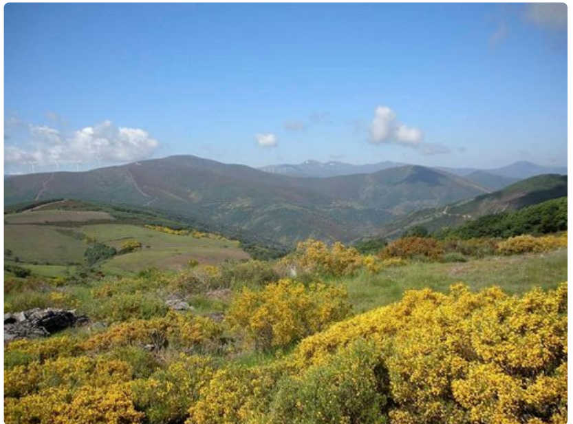
Masiema on karu ja kaunis.