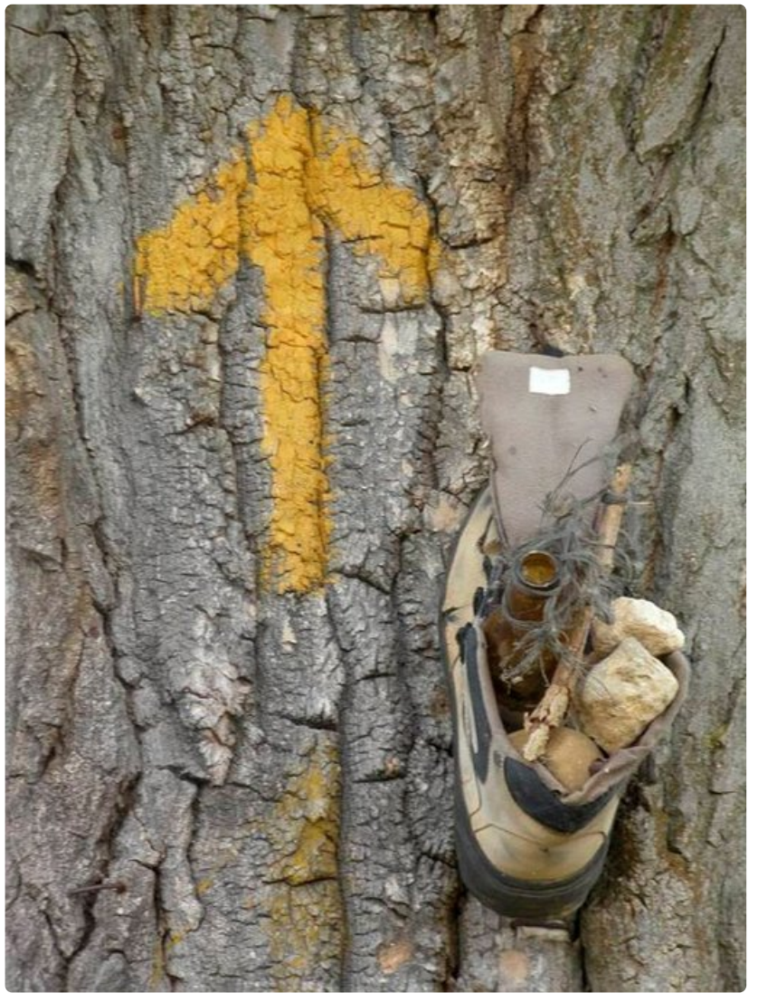
Keltainen nuoli oppaana.