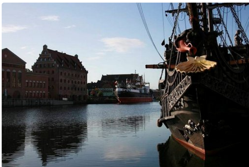
Motława virtaa Gdanskin läpi.