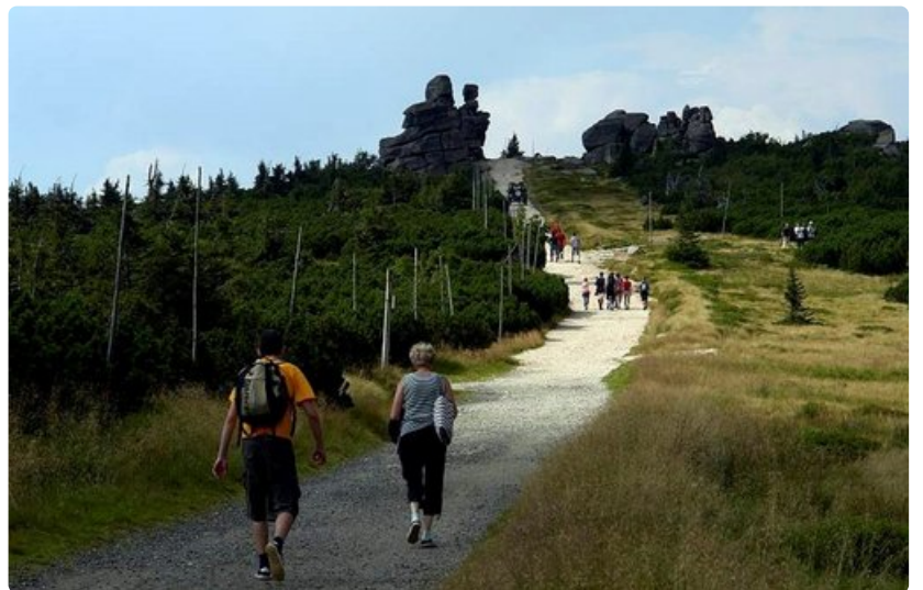
Patikoitsijoille on lukuisia reittejä.