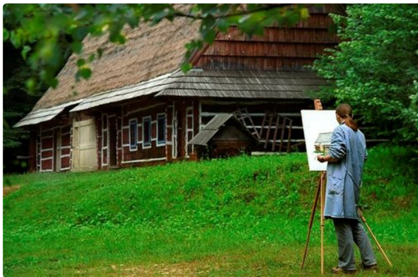
Kasubian seutu tarjoaa rauhaa.

Helissä on muutamia pieniä kalastajakylä, muun muassa Jastarnia, Jurata, Hel ja Chalupy, joissa herkutella maukkailla kala-aterioilla. Vesiturheilulajien harrastajille, niin vesihiihtäjille kuin surffaajille niemimaa on ykköskohde. Paikallinen erikoisuus on harmaahyljeakvaario Seal Aquarium.