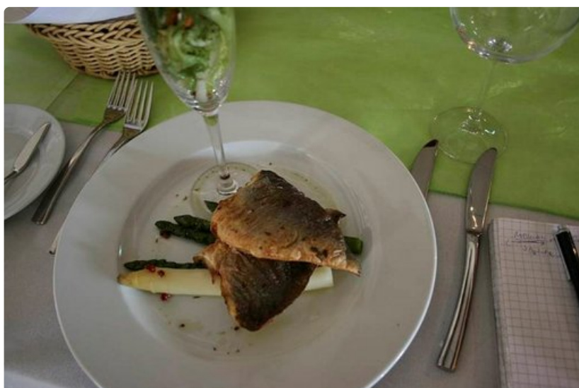
Parsaa ja kalaa.