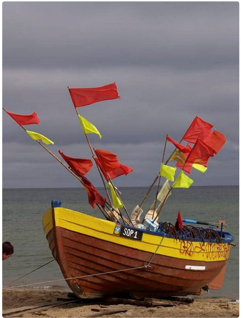
Kalastajat ovat jo palanneet mereltä.