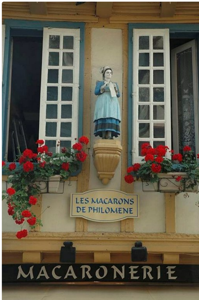
Täältä saa marenkeja.