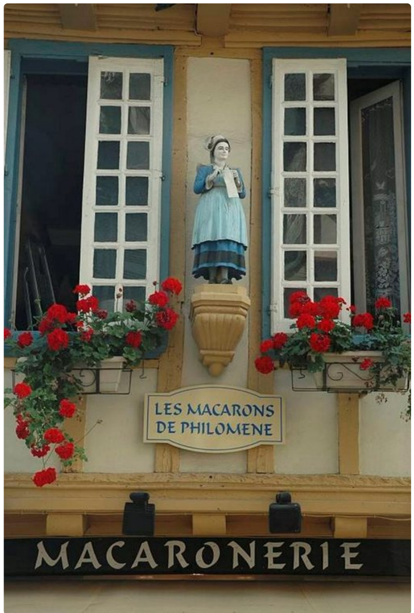
Täältä saa marenkeja.