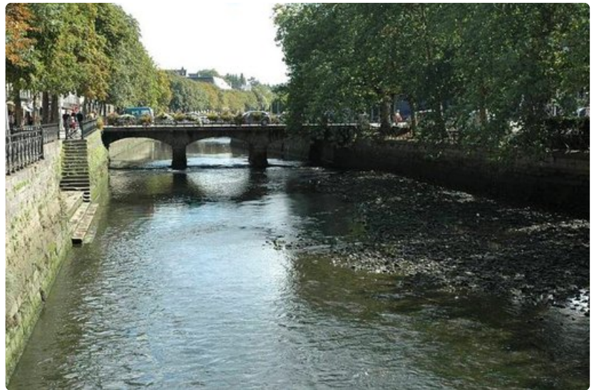
L'Odet-joki on suurin kolmesta virrasta. Tästä alkaa Vanhakaupunki.