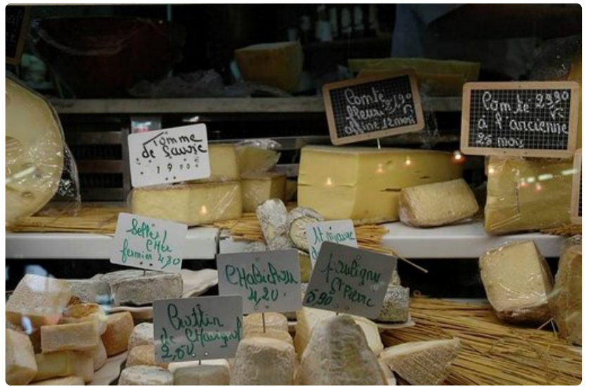
Ranskalaisjuustoissa on valinnanvaraa.