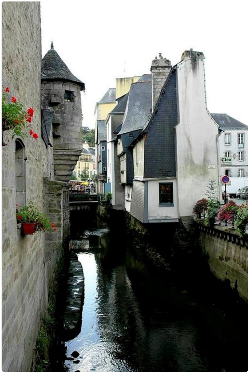
Quimperin läpi virtaa kolme jokea. Tämän joen varrella on ollut mylly, joka toimii ravintolana. Toisella puolella on vanha vartiotorni.