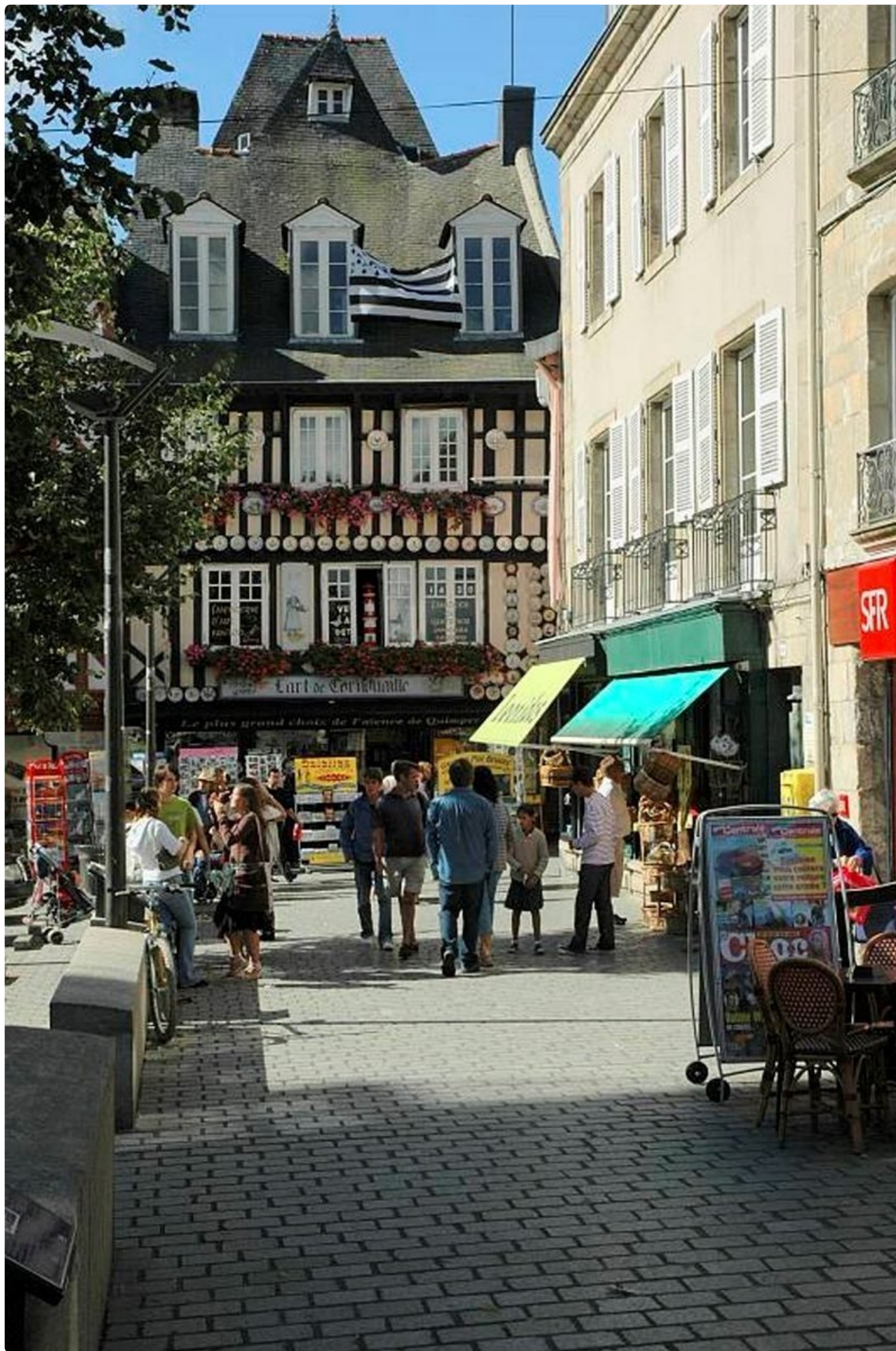
Mustavalkoinen Bretagnen lippu liehuu posliinikaupan edessä.