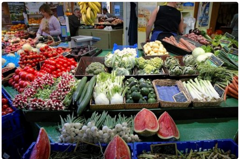
Kauppahallissa tarjonta on värikästä.