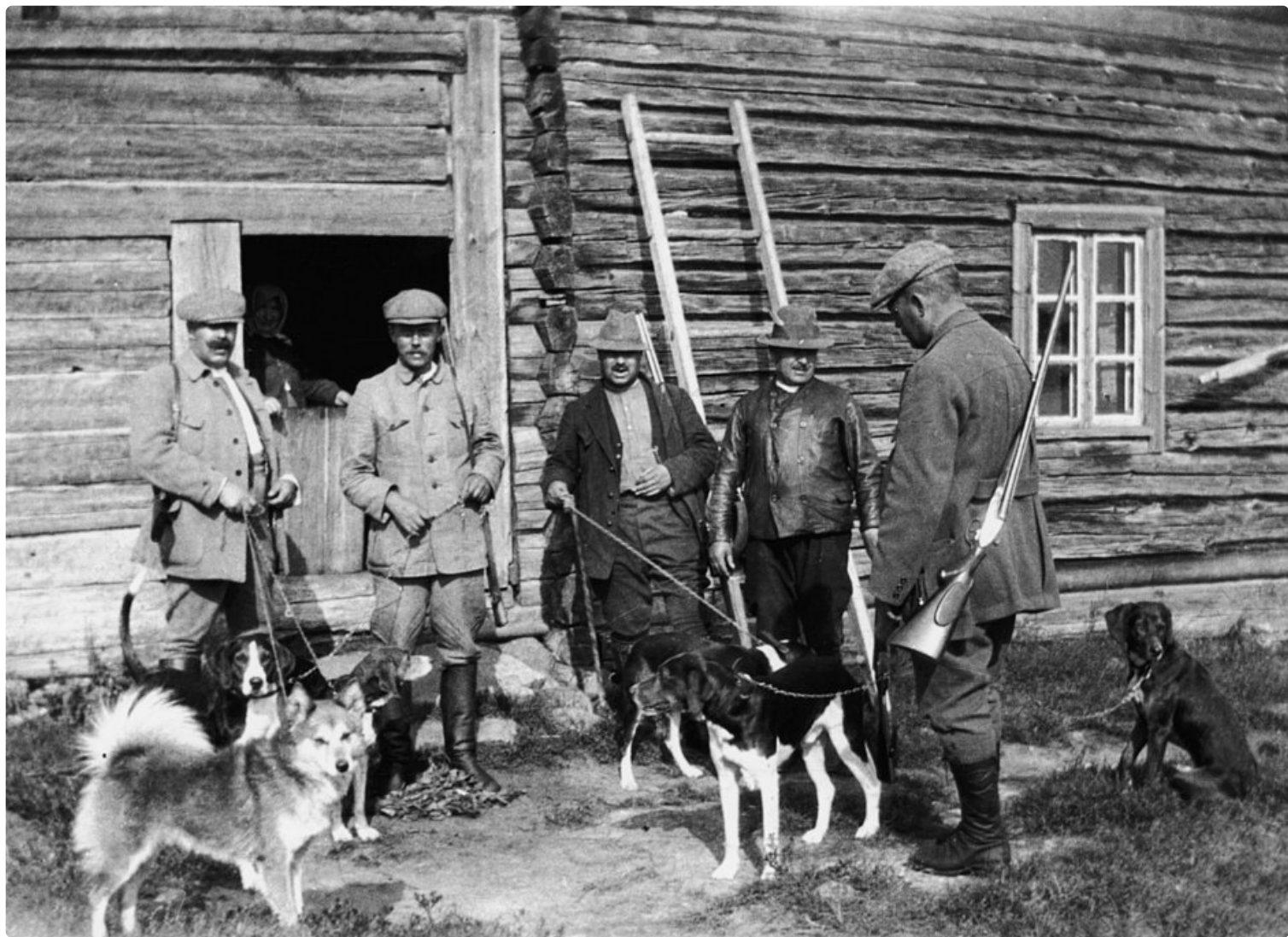
Historia kiinnostaa kesän matkailijoita. Tämä kuva on Rovaniemen metsämuseolta.