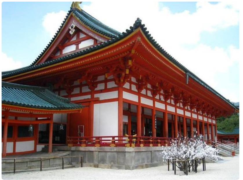
Punainen shintolaistemppele kuuluu Kioton kauneimpiin nähtävyyksiin.