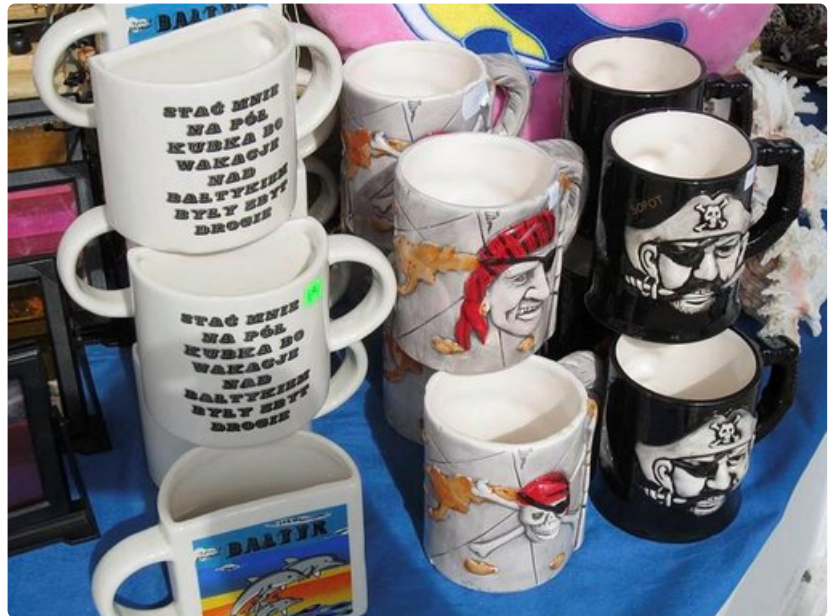
Mukeja matkamuistoksi Puolasta.