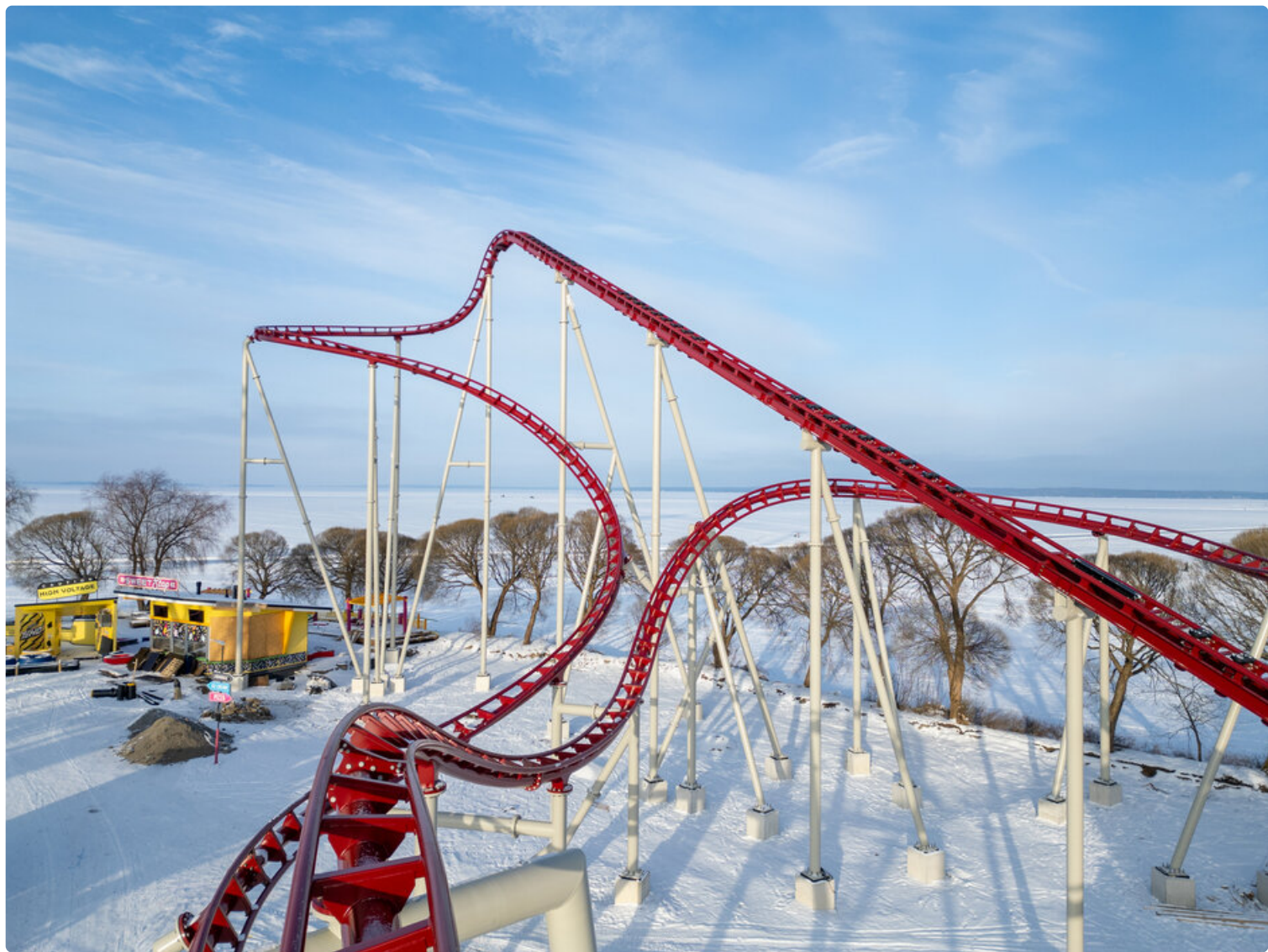
Särkänniemen Konect-vuoristorata avataan toukokuussa 2026.