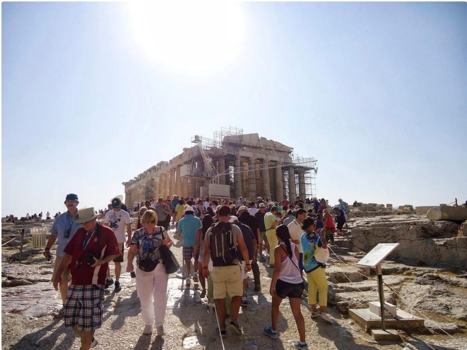
Pyhiinvaelluksella Akropolis-kukkulalle Ateenassa.