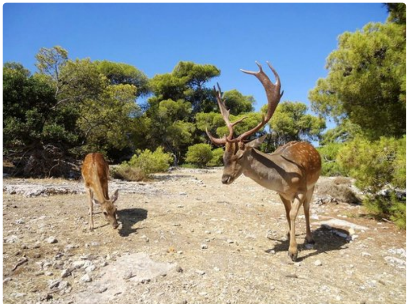
Monin saarella on kuin Disneyn elokuvassa.