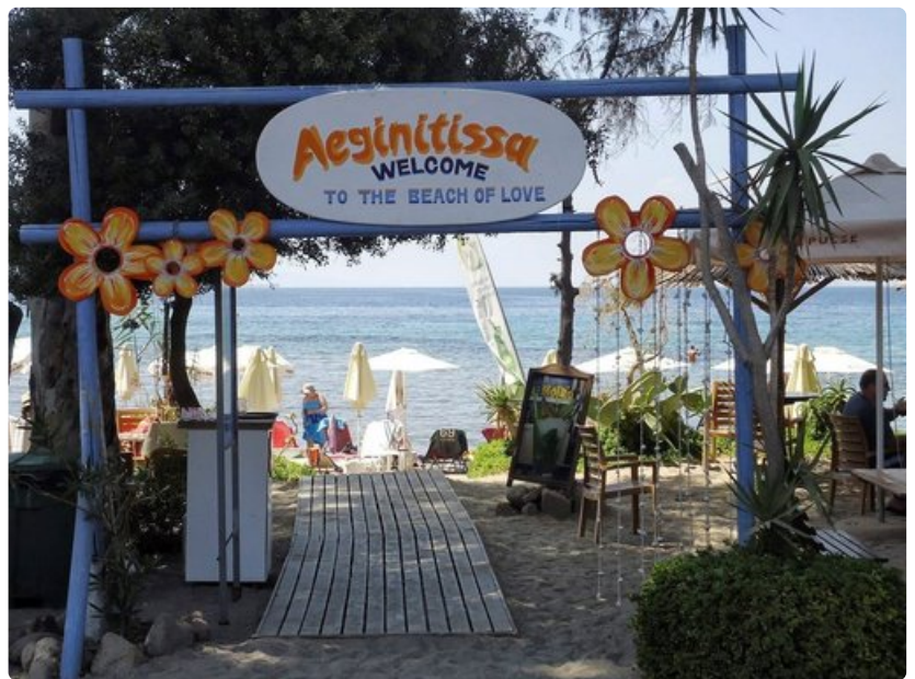
Aeginitissa on rakkauden ranta.