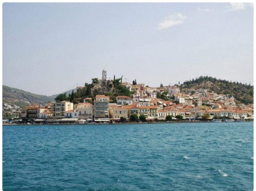
Poroksella voi syödä hyvin, uida, vuokrata skootterin, leikkiä banaaniveneillä, snorklata tai kävellä pitkin kukkuloita.