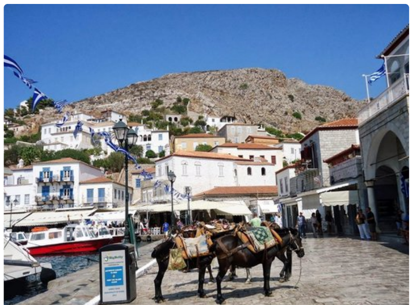
Hydran saarella aasit toimittavat autojen virkaa.