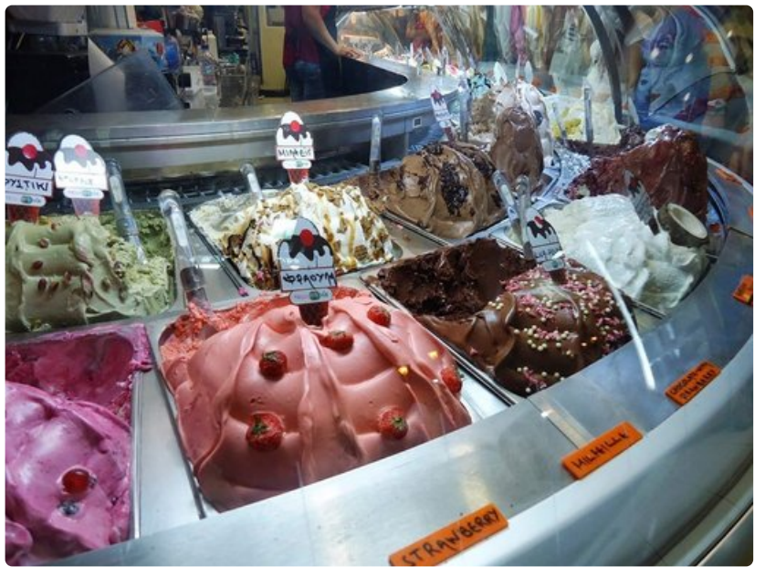
Jäätelötarjontaa Saronin saarilla. Maltatko kulkea ohi?