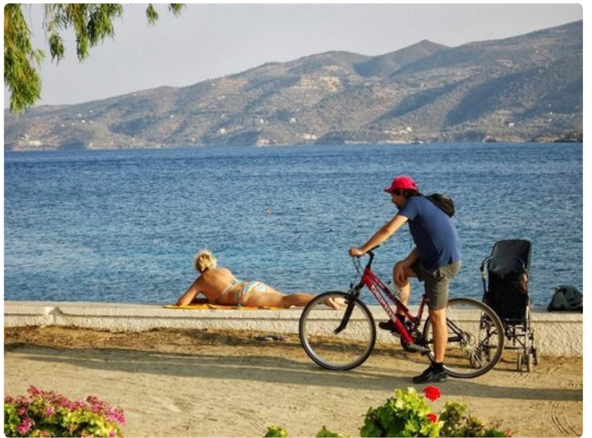
Väriä pintaan Kreikan auringosta.