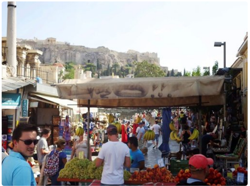
Monastirin markkinoilla Ateenassa on pidettävä huolta lompakostaan.

Aeginan saaren liikenteessä näkee paljon yliihavia paikallisia skoottereilla ja mönkijöillä. Se on jotenkin kummallisen näköistä aamukahdeksan ruuhkassa. Pistaasisaari on vain 40 minuutin laivamatkan päässä Ateenasta ja suosittu lomakohde kaupunkilaisten keskuudessa. Tänne tullaan viikonlopuiksi juhlimaan ja nauttimaan uimarannoista. Kreikkalaiset dj:t viihdyttävät klubeilla ja etelä-eurooppalaiset artistit tekevät keikkoja Aeginan sataman ravintoloissa. Aegina on tullut tunnetuksi myös ruoastaan, eritoten palkituista pistaaseista, joita myydään turistikaupoissa kreikkalaisen saippuan, liköörin ja oliivien rinnalla. Korkealaatuiset pistaasipähkinät saavat runsaasti ravinteita rikkaasta maaperästä. Ne maistuvatkin hyvin uimisen ja rantakävelyiden lomassa.