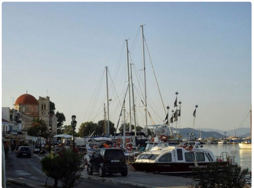
Aeginan sataman taustalla on Panayitsan kirkko.